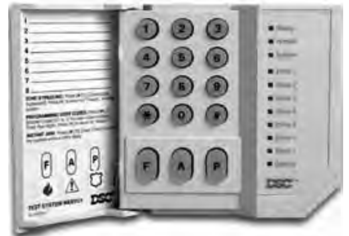
La instalación de sensores infrarrojos de movimiento, microcámaras de vigilancia y otros pequeños dispositivos, se incrementan en todos los hogares sin distinción, convergiendo en la clásica centralita con código de seguridad que el usuario debe recordar.

Los sistemas consisten en sensores infrarrojos de movimiento, microcámaras de vigilancia y otros pequeños dispositivos que van conectados a una centralita inteligente que evalúa la situación de riesgo y avisa al propietario del inmueble o a un centro de seguridad que despliega otros modelos de vigilancia. Todo ello, para contrarrestar la astucia y puesta al día de unos ladrones que cada día 'trabajan' con métodos más sofisticados. Los productos ofertados por las compañías de seguridad se adaptan a las peculiaridades de cada vivienda. Los paquetes estándar incluyen dos