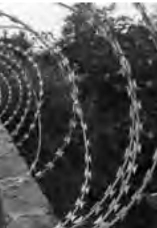
Adoptar en una casa, son aquellas que entre las más primitivas está el clásico o las nuevas "concertinas" tipo cárcel.

tres detectores de movimiento intercambiables por detectores de roturas de puertas o cristales), sirena, cartel exterior, conexión a una central receptora conectada con la policía y hasta hay equipos anticorte telefónico que emite señales vía radio (remitiendo mensajes similares a los de un teléfono móvil). La mayor parte de estos productos incluye servicios adicionales como el de asistencia inmediata, en el que un vigilante se presentará en su domicilio, previa comunicación a la policía, una vez que se salte la señal de alarma.