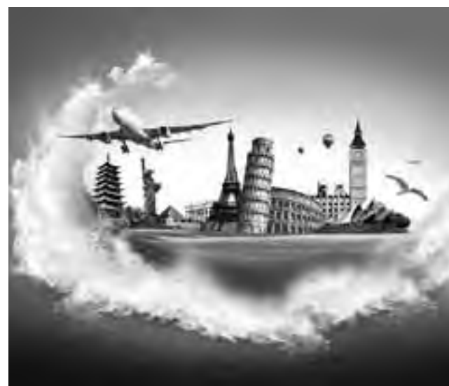
Viajeros en solitario. En pareja. En grupo. En familia. El propósito con el que salen a dar una vuelta por el globo es bien diferente en cada caso. Pero hay un denominador común. Los sueños.

Algunos propósitos de viaje se mezclan con el reparto de sonrisas entre los niños jugando con globos, sorprender con magia o