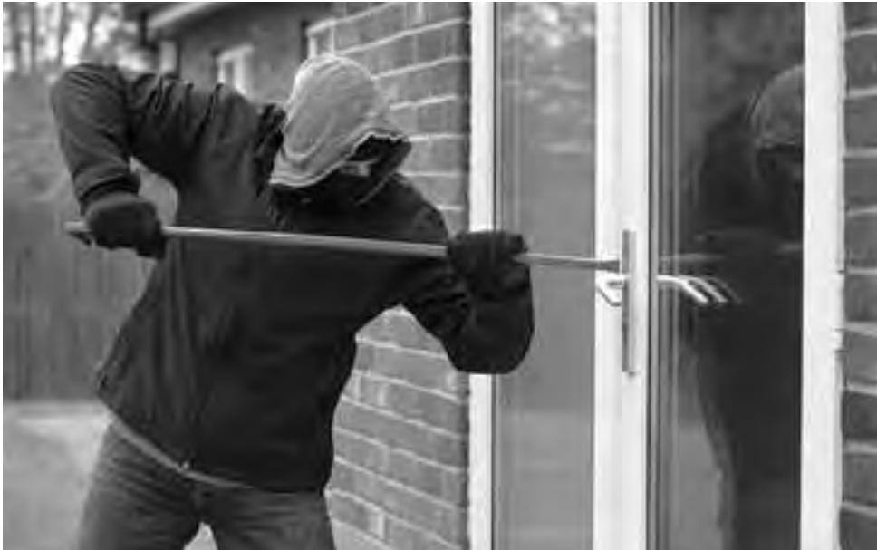
Las demandas y exigencias actuales están ligadas a la tecnología material y electrónica, aunque el personal policial asegura que el principal modus operandi de los ladrones sigue siendo el apalancamiento de puertas y ventanas carentes de medidas óptimas de seguridad, o bien el acceso mediante la técnica de escalado por tapiales bajos y terrazas accesibles.

Ningún domicilio está a salvo de ser víctima de la inseguridad, porque los amigos de lo ajeno no