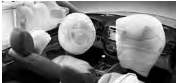
Al comprar un vehículo, las medidas de seguridad pasiva son las de mayor importancia.