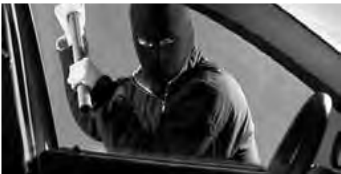
Las alarmas vehiculares cumplen una gran función hoy en día, para minimizar las posibilidades de robo. Pero los vehículos, al desplazarse, traen aparejado otro gran riesgo que es la inseguridad vial, ante la cual hay que protegerse con otras medidas.

Los elementos que hacen parte de la seguridad activa del vehículo son los encargados de mantener el control del mismo y realizar adecuadamente las acciones que realiza el conductor con el fin de evitar accidentes de tránsito. Entre ellos se encuentran: los Frenos, Llantas, Suspensión, Dirección, Iluminación y no menos importante la Climatización, porque regula la temperatura en el interior del automóvil. Es un elemento de seguridad activa porque garantiza la atención en el ejercicio de la conducción al evitar la fatiga al conductor (cuando la temperatura interior es 5 grados más caliente que el exterior es muy probable que se produzca estos efectos en quien conduce el vehículo).