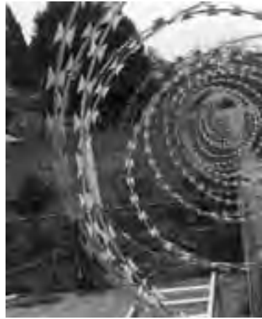
Las medidas de seguridad más sencillas de a entorpecen el libre acceso de los malvivientes. "alambre de púas" y desde hace poco tiempo

Las demandas y exigencias actuales están ligadas a la tecnología material y electrónica, el término casas inteligentes cada vez se hace más accesible, pero también están vigentes los métodos más tradicionales, sencillos y primarios para garantizar la seguridad de las viviendas. Al respecto, el personal policial asegura que el principal modus operandi de los ladrones sigue siendo el apalancamiento de puertas y ventanas carentes de medidas óptimas de seguridad, o bien el acceso mediante la técnica de escalado por tapiales bajos y terrazas accesibles.