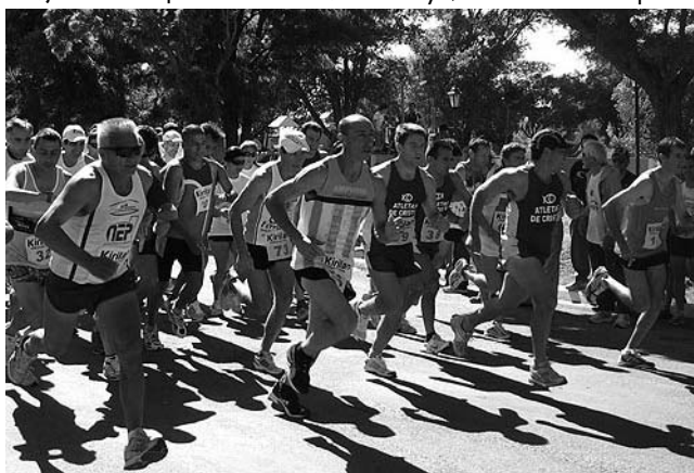
"Corre, Trota o Camina", competencia de atletas veteranos. Inscripción gratuita.

Las inscripciones se podrán efectuar en Kirilan Deportes, en 25 de Mayo esquina Yrigoyen, el 20 de mayo por la tarde y el 21 en horario de mañana y tarde.