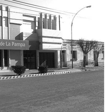
Central. A partir de la década del 60, el banco se regionalizó hacia las provincias vecinas. La localidad de General San Martín.