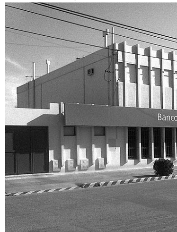
Fue en 1964 cuando el BLP abrió su Casa Central y se expandió en toda la provincia y en los 90... Foto de la Sucursal pampeana en...

A mediados de los años 90, desplegó su capacidad operativa para convertirse en un banco Regional. En 1995 se extendió a las provincias de Buenos