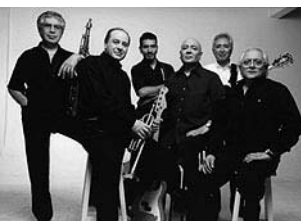
-Sáb. 21 a las 23:30 hs: «Alma y Vida», rock argentino. $ 10