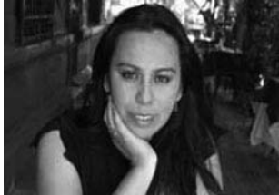
-Vie. 20 a las 23:30 hs: «Rina