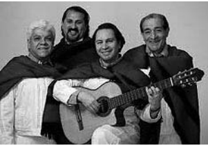
-Mar. 24 a las 23:30 hs: «Los de Salta», folklore $ 10