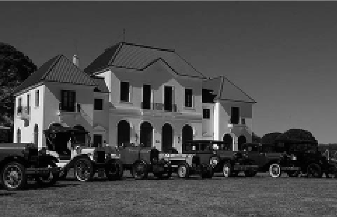
Foto del 1er Encuentro en 2010 en una visita a la Reserva Parque Luro.

El viernes 22, sábado 23 y domingo 24 de abril, se desarrollará en Santa Rosa, el «2º Encuentro Vintage», organizado por el Club de Vehículos Antiguos, Clásicos y Especiales de La Pampa.