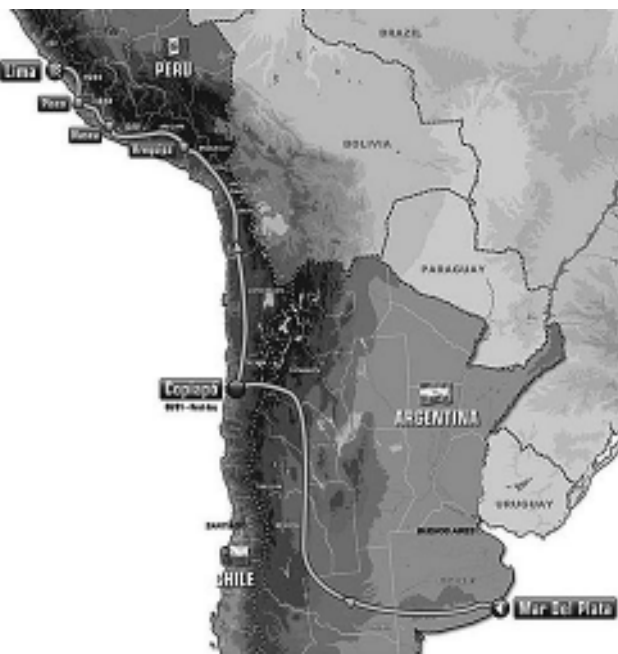
El trazado está en la web: www.dakar.com

Amaury Sport Organisation (ASO), la empresa francesa dueña de la competencia más famosa del mundo, ya publica en su página oficial el nuevo recorrido del «Rally Dakar Argentina - Chile - Perú 2012», que será anunciado este miércoles 19 de abril en la