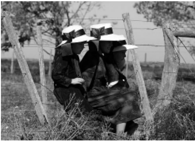
El jueves 21 y sábado 23, se realizarán visitas guiadas a la Colonia Menonita partiendo desde Guatraché. Reservas al tel: (02923) 1542-6936

Diferentes alternativas turísticas que van desde peregrinaciones religiosas hasta actividades relacionadas al entorno rural, son ideales para aprovechar el fin de semana largo de Semana Santa y Pascua del 21 al 24 de abril.