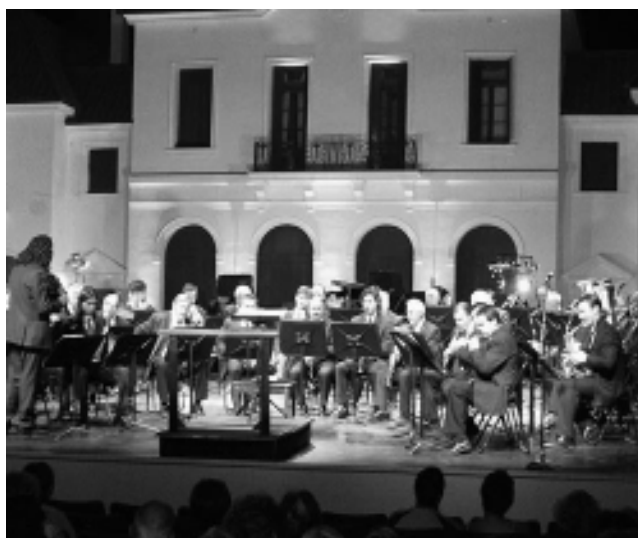
«Música en El Castillo», el Viernes Santo del 22 de abril.

Se viene un nuevo fin de semana turístico, del jueves y viernes santo, y nos anticipamos con la propuesta de disfrutar de las actividades que hay programadas en nuestra provincia. En lo concerniente a la fecha religiosa, habrá un Via Crucis en Santa Rosa, otro en La Adela y otro en Guatraché. En lo recreacional, la cabalgata que organiza la Estancia «San Carlos» en Luan Toro; el evento