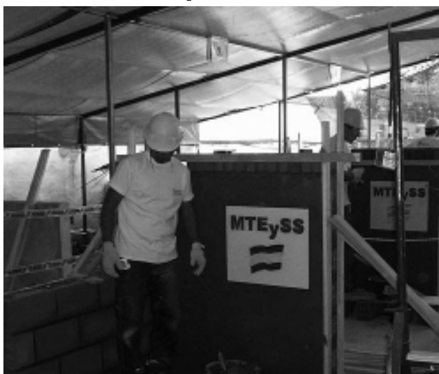
Trabajadores compitiendo en la 1ª Olimpiada de Formación Profesional UOCRA.

Batimat Expovivienda 2011 y la Fundación UOCRA llevarán a cabo dos importantes actividades en el marco de la exposición. Se trata de la 2ª Olimpiada de Formación Profesional y el Foro de la Construcción 2011. Batimat Expovivienda se desarrollará entre el 31 de mayo y el 4 de junio de 14 a 21 hs., en La Rural, Predio Ferial de Buenos Aires.