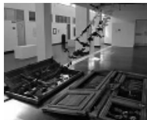
-Muestra «De eclipses y pájaros». Hasta el 26/4. Gratis