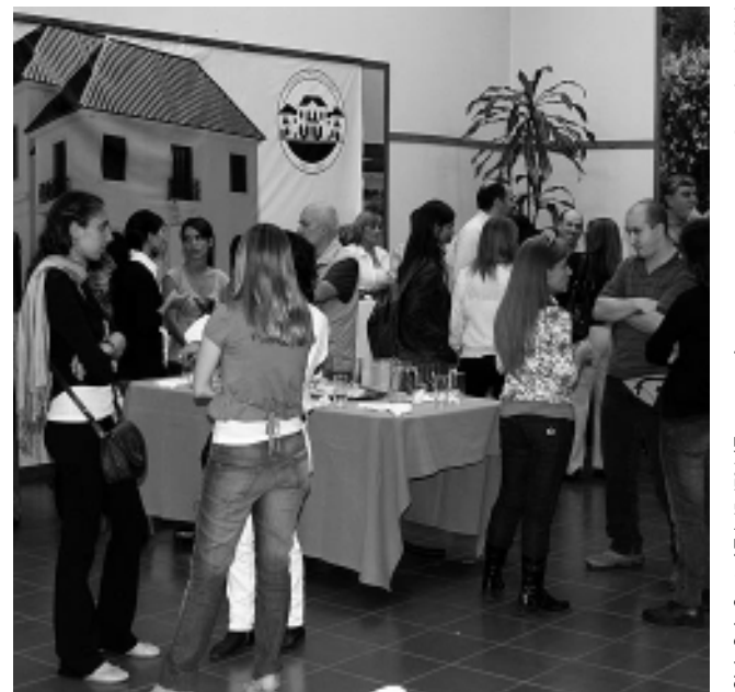
En la Secretaría de Turismo de La Pampa.