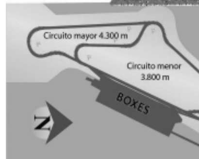
Los terrenos están ubicados en el cruce de la Ruta N° 9 (tierra), que va a Cachirulo y Naicó al Sur sobre la Ruta 14, a unos cinco kilómetros del emp