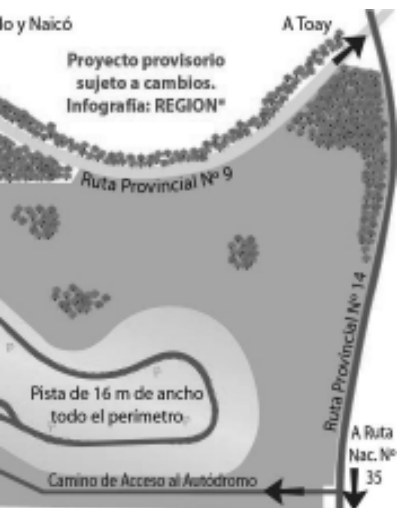
La Ruta Provincial N° 14 (asfalto) con la Ruta Provincial N° 9 y la Ruta Nacional N° 35 (Bajo Giuliani).

Estimó más adelante que el Autódromo Provincial podría estar finalizado a fines de octubre o principios de noviembre de este año. "Está todo preparado como para contar con este autódromo finalizado en el transcurso de este año y ver si podemos tener una fecha este año, está pendiente en ese sentido una charla que tendremos oportunamente con el presidente de la ACTC".