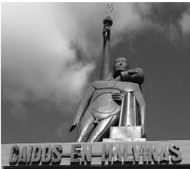
Este sábado se conmemora en todo el país el 29° Aniversario de la Recuperación de las Islas Malvinas, denominado «Día del Veterano de Guerra».

La ceremonia central en Santa Rosa se llevará a cabo a las 11 horas frente al monumento que recuerda a los Caidos en Malvinas, sito en Corrientes y Pasaje del Tribunal de Justicia.