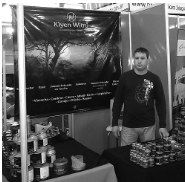
Uno de las empresas pampeanas presentes: «Kiyen Witrú».

Se destacó cierto interés en algunos productos o destinos relevantes de nuestra provincia como la Reserva Provincial Parque Luro y el Avistaje de Ciervos en Brama; la Villa Turística Casa de Piedra; las Termas y Colonia Menonita. Es de destacar que, Bahía Blanca y su zona es considerado un mercado regional de mucha importancia. Esto se debe a que gran parte de nuestra demanda turística proviene de la región por ciertos condicionantes como accesibilidad, distancia, tiempo disponible y costos.