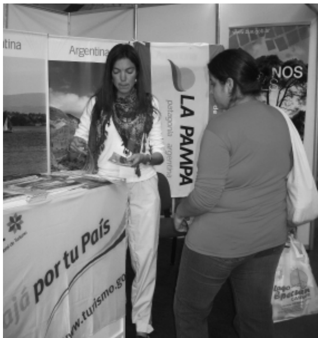
La Secretaría de Turismo de La Pampa junto al Ministerio de Turismo de la Nación presentaron el stand "Viajá por tu país".

El pasado fin de semana largo, se llevó a cabo una nueva edición de la Feria Multisectorial de la Producción, el Trabajo, el Comercio y los Servicios del Sur Argentino (FISA), que se desarrolla en la ciudad de Bahía Blanca.