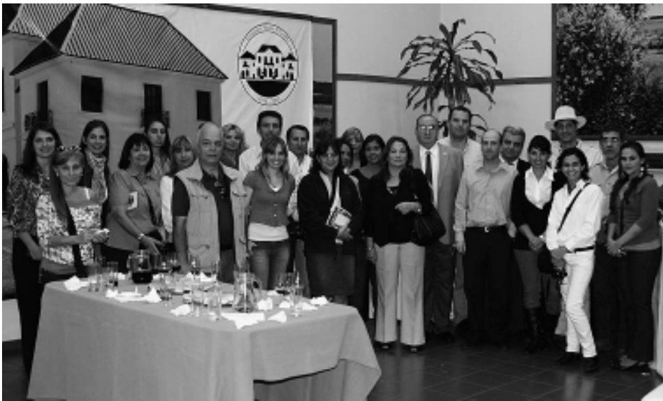
Funcionarios, agentes de viajes y periodistas de la Patagonia y de provincia de Buenos Aires, estuvieron en La Pampa en el contexto de la 164ª Reunión Ordinaria del Ente Patagonia Turística. Fueron recibidos con una degustación de exquisitos regionales, participaron del avistaje de ciervos en brama en Parque Luro y de un completo Fam Tour.

En la ciudad de Santa Rosa tuvo lugar la 164ª Reunión Ordinaria del Ente Patagonia Turística y representantes de áreas de turismo de la Patagonia y Buenos Aires. El objetivo fue acordar la agenda de trabajo, además de efectuar un recorrido por los principales atractivos urbanos y rurales de La Pampa.