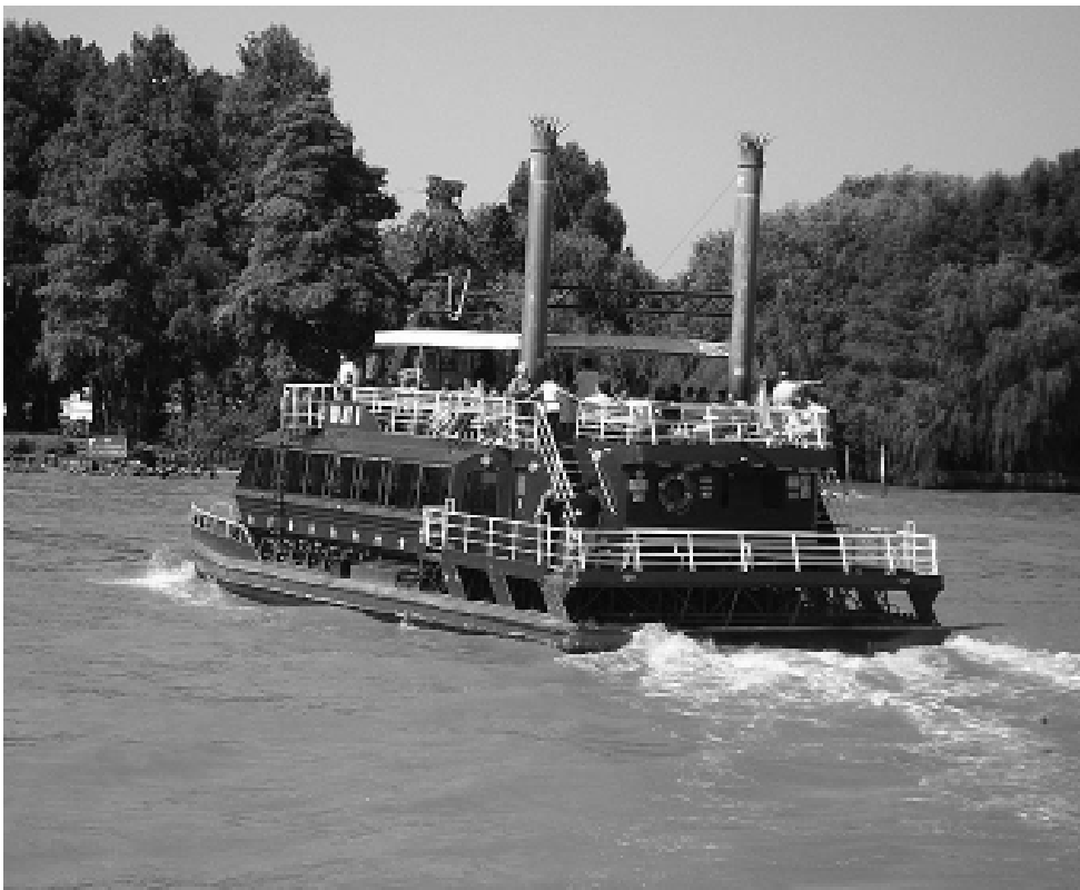
Otra variante de un finde largo es una escapada a la ciudad de Buenos Aires y sus alrededores. Donde el día tiene sus atractivos, con lugares maravillosos como la zona de Tigre (foto), «la venecia argentina» y otros para disfrutar plenamente. Las noches complementan con mucho cine, espectáculos teatrales, musicales y otros más atrevidos.