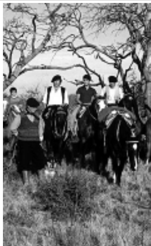
Cabalgata en el oeste pampeano.

pesquero; Concarán -pinturas rupestres y Minas de los Cóndores como destacado-, atravesando el Valle del Conlara hasta la Sierra de los Comechingones.