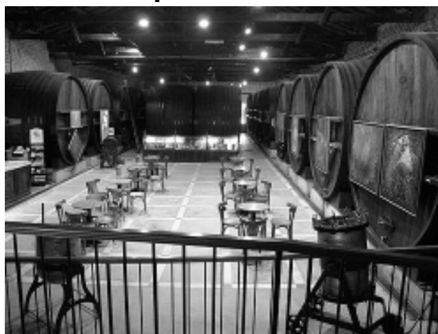
Museo del Vino de Bodega La Rural en Mendoza.

Desde ya que la ciudad de Mendoza merece una recorrida por el Cerro de la Gloria, El Plumerillo, el Parque San Martín y los museos que contienen documentos del paso por la región del prócer argentino. Por la zona aledaña a la ciudad se puede conocer sitios y localidades interesantes como las Ruinas del Templo San Francisco, El Challao, las termas de Villa vicencio, Cacheuta, Potrerillos y Vallecitos.