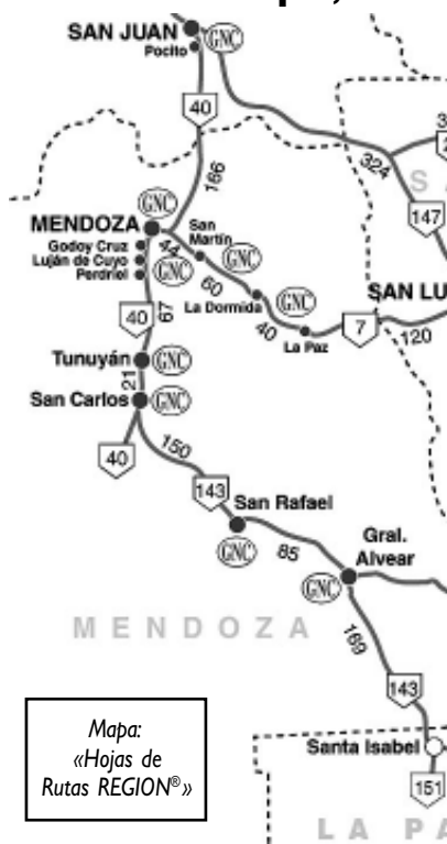
Mapa: «Hojas de Rutas REGION®»

¿Cómo sigue?... bueno, si hubiera más tiempo diríamos que hay que visitar Merlo (a 190 km al norte), pasando por La Toma -capital del mármol onix- y su dique