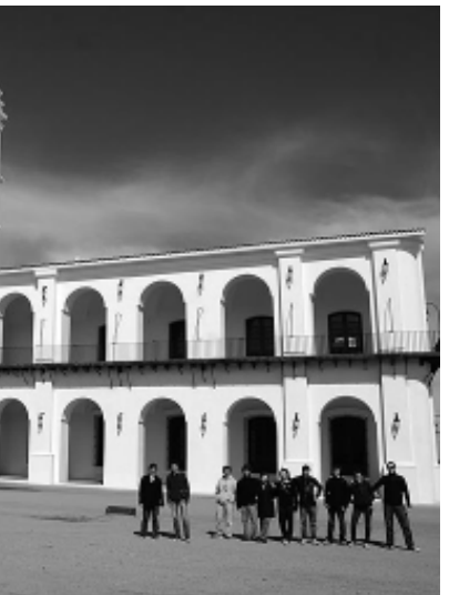
Aires, en la Ciudad de la Punta, San Luis.