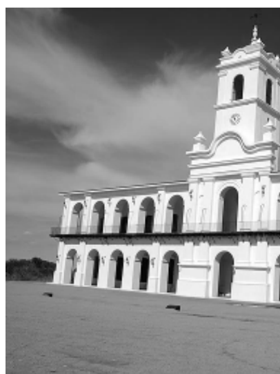
Réplica completa del Cabildo de Buenos Aires