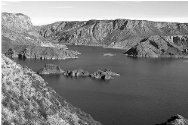
«El Submarino» figura de la erosión en el Cañón del Atuel.

Renglón aparte si decide quedarse para la Fiesta Nacional de la Vendimia, que se desarrolla este fin de semana del 4 al 7 de marzo, oportunidad en la que esperan realizar el brindis más grande del mundo. Este record será en la noche central del sábado 5, cuando en el teatro griego Frank Romero Day, le entregarán a cada espectador una copa con una botellita de vino para realizar de esta manera un brindis multitudinario que sea el mayor en la historia mundial.