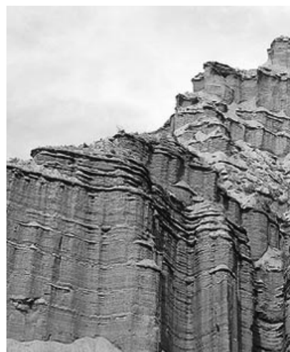
Parque Nacional Sierra de las Quijadas