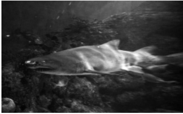
Espectacular Acuario del Parque Temaikén en Escobar.

Hay que hacer base en uno de los cientos de hoteles de la Capital Federal y programar salidas.