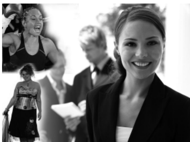
Nada de sexo débil. Son talentosas, trabajadoras, esposas, madres, abuelas, hijas, novias, hermanas, siempre protectoras. Están a la par de los hombres en todo y cada vez más se ganan su lugar, a veces a las trompadas, como nuestra «Gata» campeona mundial de box. El martes 8 de marzo es el día de ellas y aunque el traje de súper heroína a algunas no les entre, son Maravilla.

La municipalidad de Santa Rosa, a través de la Subdirección de Políticas de Género, está organizando distintas actividades con motivo del Día Internacional de la Mujer, que se conmemora el martes 8 de marzo.