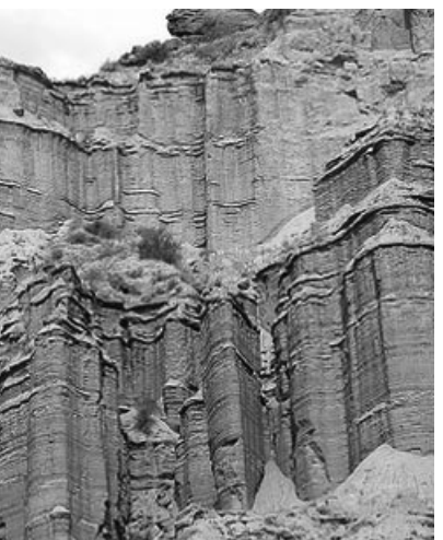
Las Quijadas en San Luis.

Ni hablar que la zona es la más rica en cuanto a turismo rural y en testimonios de historia pampeana, con estancias turísticas muy destacadas, que es necesario reservar previamente.