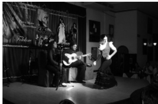
Cenas shows de tango, folklore y flamenco. Para todos los gustos.

Los tragos y las miradas van y vienen. El que busca encuentra, pero nadie molesta.