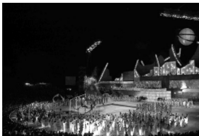
Fiesta Nacional de la Vendimia en Mendoza. Este año batirán un record.