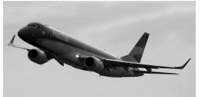
Tienen 88 asientos clase turista y 8 ejecutiva, con 4 butacas por hilera, 2 de cada lado del pasillo, con pantallas de entretenimiento individual.

Este viernes 4 de febrero será el primer vuelo de Austral Líneas Aéreas desde Buenos Aires a Santa Rosa, con los nuevos aviones brasileños EMBRAER 190 AR. La renovación total de la flota de cabotaje y cabotaje regional mediante la adquisición de veinte de estas unidades y la incorporación de aviones BOEING 737/700, representa la modernización de la flota más completa realizada hasta ahora por nuestro país y deberíamos remontarnos a los años 70, cuando se compraron doce 737/200 para encontrar antecedentes de una operación de esta envergadura. Los E-190 poseen 88 asientos en clase turista y 8 en clase ejecutiva (bussiness class), con 4 butacas por hilera, 2 de cada lado del pasillo, con pantallas de entretenimiento individual. Su nivel de ruido es muy bajo, es un avión muy amigable con el