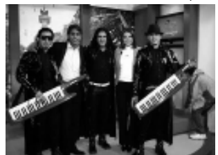
-Sáb. 5 a las 23:30 hs: