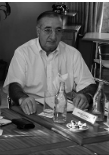
(Hotel Cuprum), vicepresidente y presidente de la Asociación Hotelera Gastronómica de La Pampa.

redes relacionadas al Turismo en nuestra Provincia, cuyo mayor objetivo alcanzado ha sido la elevación a Secretaría de Estado de la cartera de Turismo Provincial, a cargo del Sr. Santiago Amsé, el apoyo a la creación del Ministerio de Turismo Nacional, a la llegada de Sol Líneas Aéreas, y la adhesión a programas publicitarios de destinos turísticos nacionales; la capacitación de nuestros propios miembros a través de la Escuela de Dirigentes y el Programa Formador de Formadores de FEHGRA, la motorización de estudios de impacto socio-económico de la actividad hotelera-gastronómica locales, y el cumplimiento y participación en forma estricta de todas las responsabilidades asumidas por nuestra Institución.