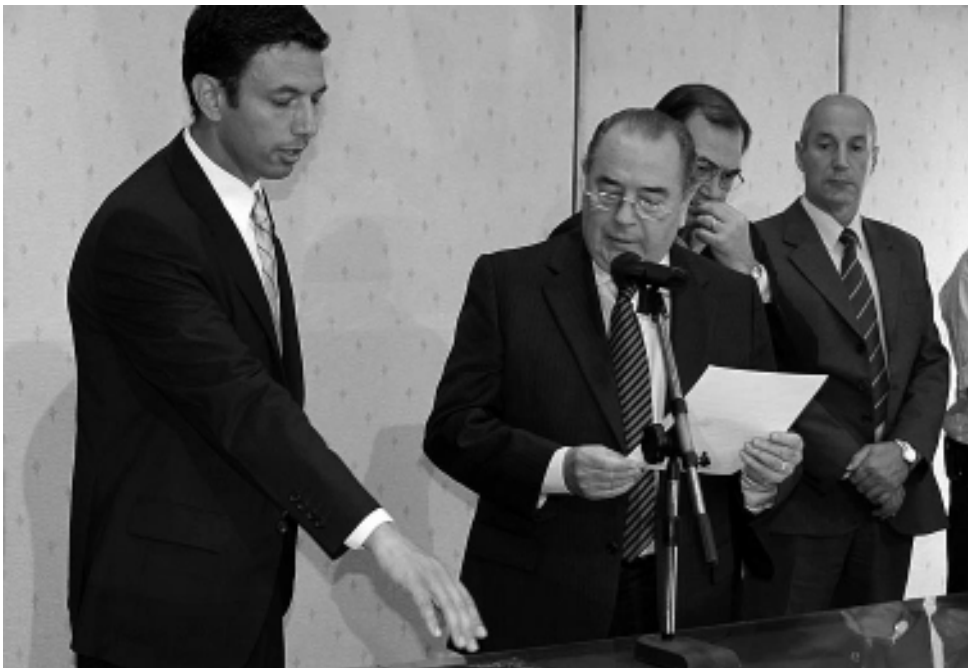
El gobernador Oscar Jorge al referirse a Santiago Amsé en el acto de asunción, expresó: "Se ha preocupado y ha desarrollado una tarea muy particular y sobre todo ha logrado una tarea en conjunción con las Cámaras, para lograr los mejores objetivos en materia turística".

El gobernador de La Pampa, ha brindado permanente apoyo al sector turístico, reconociéndolo como potenciador de la econo-