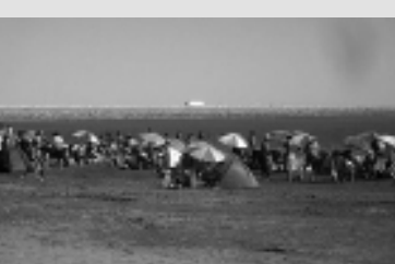
del movimiento turístico en Casa de Piedra aron un promedio de 2.500 personas por semana, de las cuales 1.500 utilizaron las instalaciones y comodidades del camping.

80%. En el caso de las estancias turísticas cubierta su capacidad de alojamiento con varias reservas para febrero. s principales referentes turísticos, los leto en: www.region.com.ar