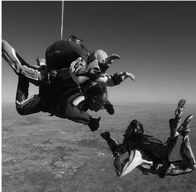
Realizarán saltos en tándem desde 10.000 pies en un radio de 6 millas náuticas con centro en el aeropuerto Santa Rosa.

Vértigo, velocidad, caída libre, saltos de bautismo en tándem, planeadores, ultralivianos, experimentales y hasta un reactor ruso que fuera icono de la guerra fría, se darán cita en el cielo pampeano el próximo fin de semana del 12 y 13 de febrero.