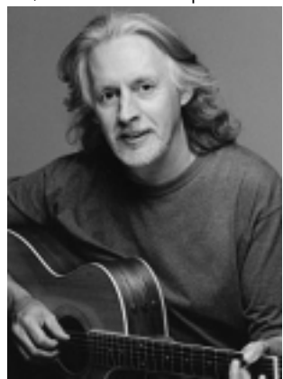
-Sáb. 14 a las 23:30 hs: «Nito Mestre» $ 5

-Jue. 26 a las 21:15 hs: «Noche de Danza». Música clásica. $ 15 • María Teresa Pub: Rivadavia y Lagos. Tel: 1550-1600 -Vie. 20 desde las 23 hs: «Tierra plana» Melódicos, pop, latinos. -Sáb. 21 a las 23 hs: «Frack», música y humor del bueno. • Casino Club Santa Rosa: Ruta 5 Km. 606,5. Tel: 45-4794. Entrada $ 3, antes de las 19 después: