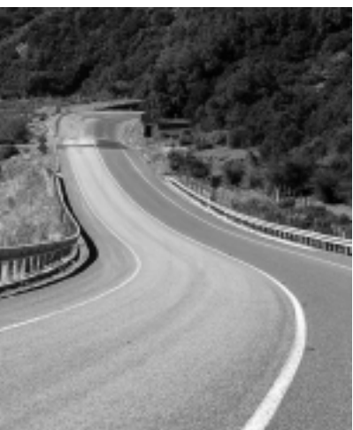
Se dice que en marzo entrega el penúltimo tramo terminado y ya adjudicó el último final. Argentina asegura que el primer semestre del año próximo completa el tendido de todo el camino. Ambos países están comprometidos a inaugurar en el Bicentenario en 2010.