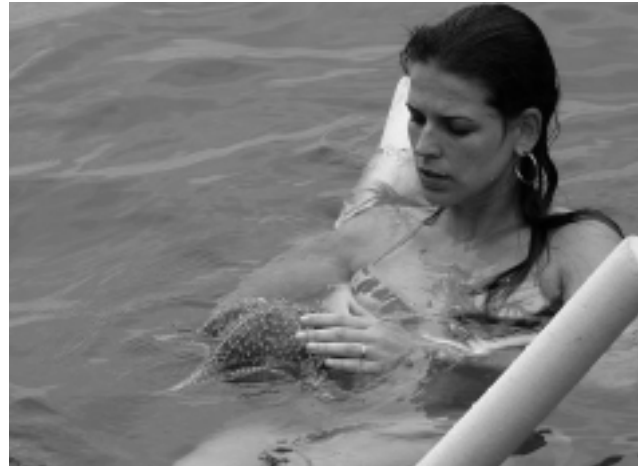
En el viaje a Isla Grande, una parada para zambullirnos en Laguna Azul nos hará descubrir la fauna subacuática, alimentando a coloridos peces. Tomar contacto con alguna estrella de mar, puede ser otra sorpresa agradable.

En esta serie, la propuesta ha sido volar a San Pablo, punto de partida de una recorrida en auto alquilado por el Sur de Brasil.