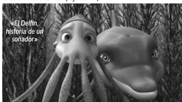
«El Delfín, historia de un soñador»

• «El Delfín, historia de un soñador»: Daniel Alejandro es un joven delfín que anhela descubrir el verdadero propósito de su vida. Vive en un arrecife con toda su manada, para quienes no existe nada más importante en la vida que pescar. Pero Daniel siente que está predestinado para otra cosa, y motivado por sus propios sueños, emprende un maratónico viaje, en donde conoce a otros habitantes del océano y vive aventuras increíbles, con la felicidad de realizar lo que desea... Aventuras animadas para toda la familia. 85 min.