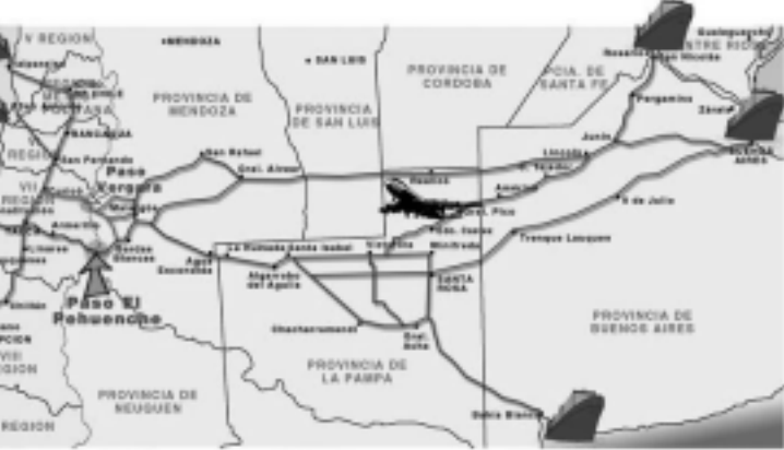
El Sistema Pehuenche tiene a la provincia de La Pampa como eje central del futuro movimiento rutero bioceánico, entre el Atlántico y el Pacífico.