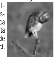
nocturno». $ 12