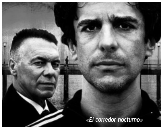
«El corredor nocturno»