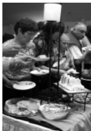
Dichos festejos culminarán con una gran cena show, entrega de premios y la coronación de la reina provincial de la caza mayor y menor. informes al tel: (02952) 49-9008 y (02954) 1555-6850 ciervosquehue@yahoo.com.ar

Además, la Asociación Pampeana Argentina de Medición de Trofeos del Club de Caza Valle de Quehué, junto al Tiro Federal Argentino de Bs.As., presentará una guía de medición de trofeos de nuestra fauna argentina que contiene los parámetros de medición que se requieren para la fórmula del Conseil International de la Chasse y los parámetros de medición que se requieren para la Formula Argentina de Medición y así llenar el vacío existente en nuestro país de literatura al respecto.