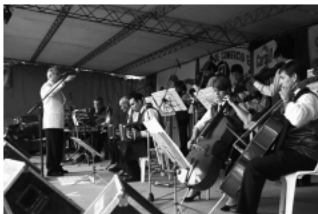
La Orquesta de Cámara de General Pico presente en la vecina localidad.