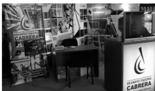
La empresa «Desinfectadora Cabrera» mostró sus novedosos productos.