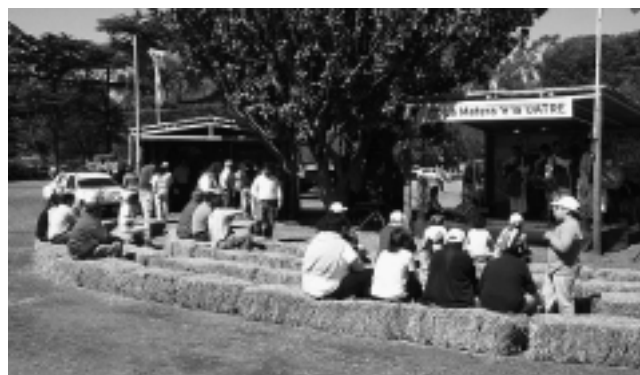
Gran convocatoria en la Expo en torno a la «Materia de La Uatre».