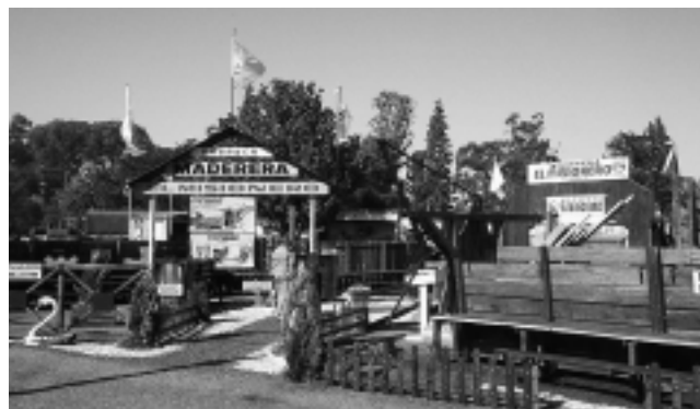
«Maderera El Misionero». Mejor stand Industria con el 1er Premio.