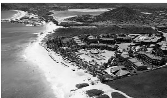
Muy buenos establecimientos hoteleros están presentes en la isla venezolana con el servicio todo incluido. Se destacan entre muchos, el «Hesperia Margarita» y el «Lagunamar Resort».

El próximo destino del viaje es Punta Arenas, donde se almuerza en una especie de cabaña con vista