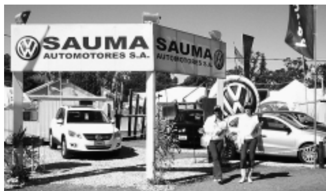
«Sauma» y sus bellas promotoras, le pusieron alegría y color a la Muestra.