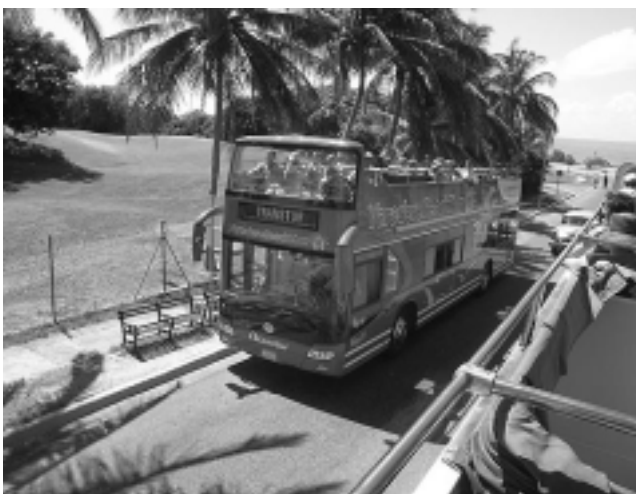
En el ómnibus «Varadero Beach Tour», con un boleto diario podrá bajarse y volver a subir cuantas veces quiera. Son micros doble piso, con el piso superior sin techo, una visión panorámica incomparable.