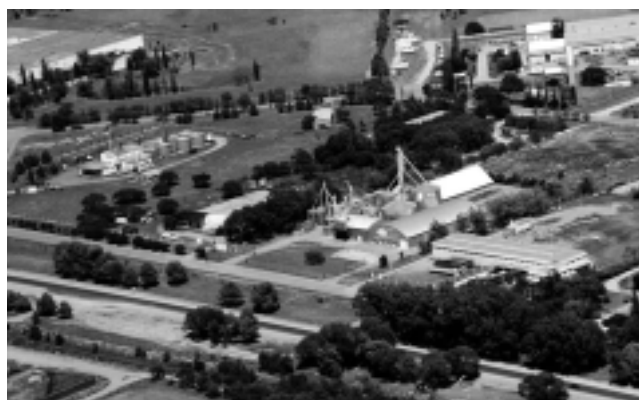
Hay $ 2,5 millones disponibles en el presupuesto 2009, para dotar de más servicios al Parque Industrial de Santa Rosa.

Es evidente que el predio dedicado a la industria en la capital pampeana debe retomar la naturaleza para lo cual fue creado y no seguir siendo un circuito para aprender a conducir, ni como basural o foco de actos dañinos y muchas veces de robos.