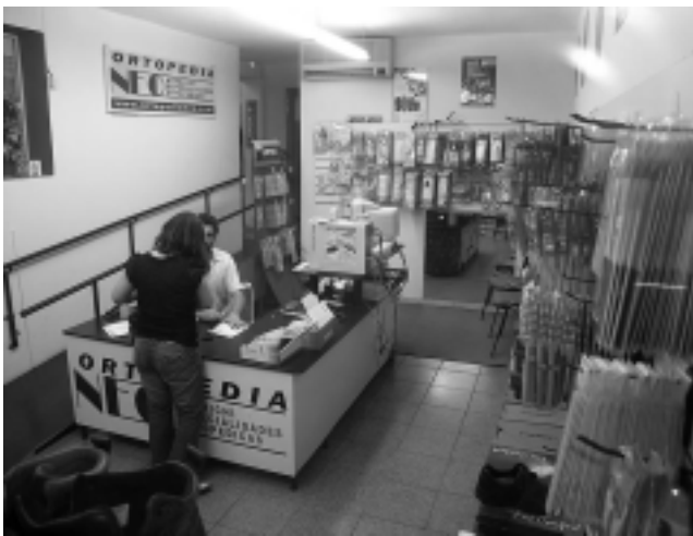
Actualmente, NEO dispone de un moderno y amplio salón de ventas y exposición, ubicado en Av. Uruguay 32 de la capital pampeana.

La empresa de Santa Rosa «Ortopedia NEO» (Nutrichi Especialidades Ortopédicas), cumple este mes 13 años, desde su inicio en 1996 en un pequeño local en la calle 25 de Mayo.