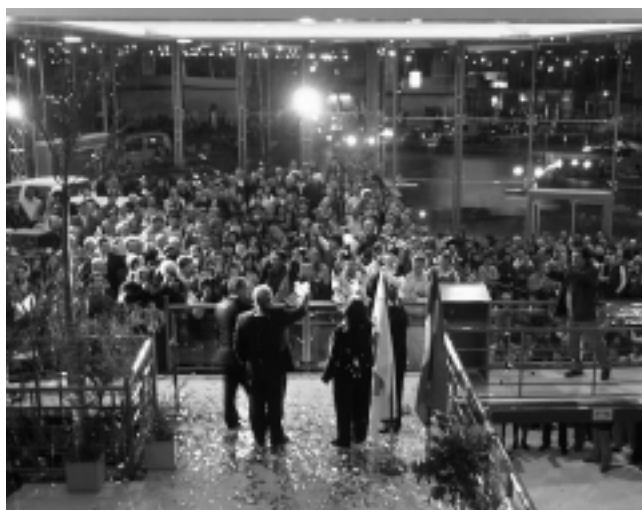
Unas 500 personas se dieron cita en la noche inaugural de la nueva Casa Central del Concesionario Oficial Toyota en La Pampa, «BHAS SA».

Ocho alumnos de las escuelas EPET fueron distinguidos, siete varones y una mujer.