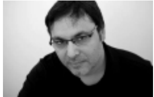
«Charlas de Diván» con Gabriel Rolón. $ 80, $ 70 y $ 60.