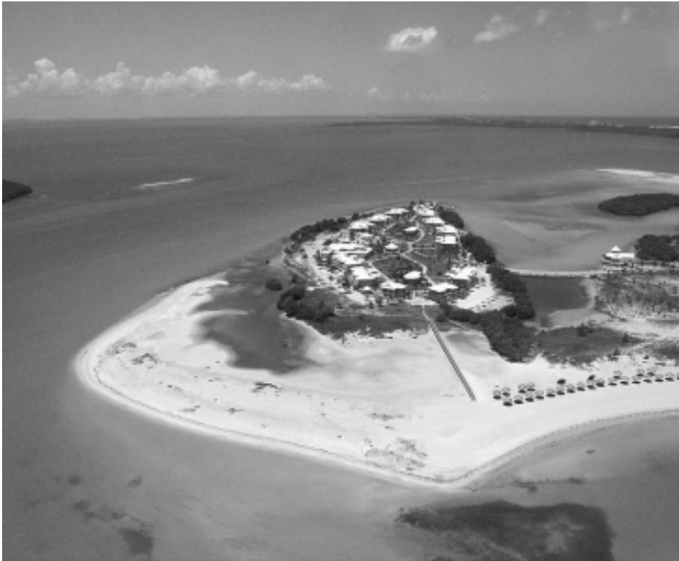
En el polo turístico de Varadero, Cuba, la mayoría de los hoteles son de 4 y 5 estrellas y están los nuevos «5 superior» ó 6 estrellas, con su servicio «súper all inclusive» como el Paradisus Princesa del Mar, el Sandal Royal Hicacos o el Iberostar.