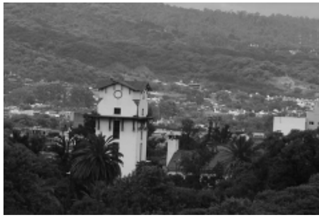
El Abra Santa Laura, es el límite entre las provincias de Salta y Jujuy. La ruta sinuosa nos interna en la montaña tupida de vegetación y en una de tantas curvas, aparece San Salvador de Jujuy en todo su esplendor.

En ediciones anteriores divulgamos el recorrido en vehículo de un viaje al Norte Argentino, con salida desde Santa Rosa y como destino final la Quiaca.