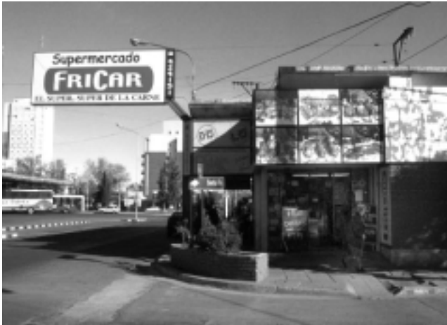
El «súper, súper de la carne» en la esquina de Corrientes y Santa Fé, frente a la Terminal de Omnibus de Santa Rosa.

La firma «Frigorífico de la Carne SRL» arribó recientemente a su segundo aniversario.