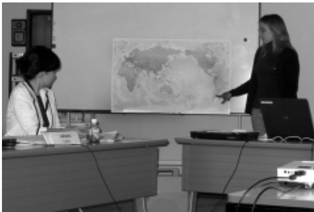
«Aquí les envío una de las fotos que mi compañera de Tailandia me tomó mientras hacía mi presentación de Argentina en un power point... Saludos desde Tokio, Malela»

curso «Marketing y Promoción turística», nos mandó un par de fotos de su actividad y quedamos que nos enviará material de interés desde ese país.