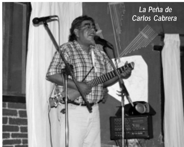
La Peña de Carlos Cabrera