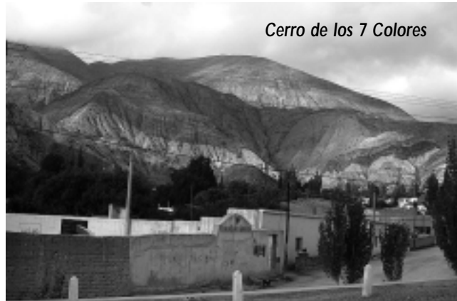
Cerro de los 7 Colores