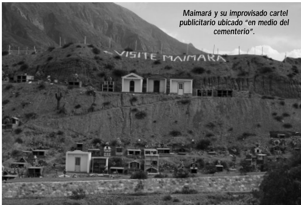
Maimará y su improvisado cartel publicitario ubicado "en medio del cementerio".

-El primer punto de interés turístico son las Termas de Reyes, a 18 km, un complejo moderno