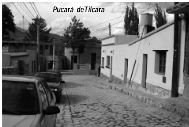
Pucará de Tilcara

Lo que resta del camino, como decíamos, nos lleva al límite nacional 160 km al norte. Es una buena experiencia conocer este