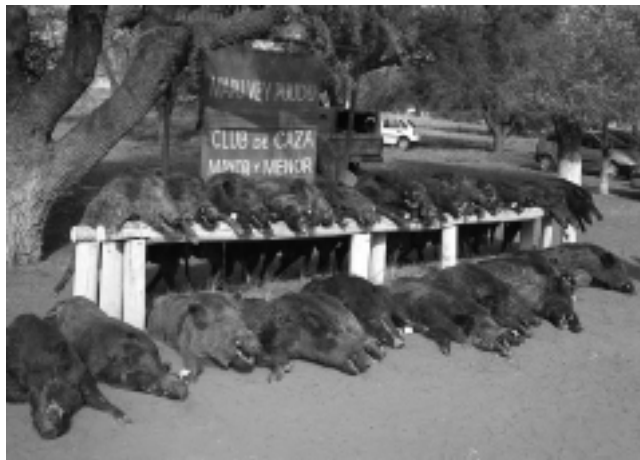
La fiesta anual coincidió con la realización del Torneo de Caza de Jabalí 2009, donde hubo record de participantes y de trofeos logrados.

En una reunión en horas del mediodía del pasado domingo 7 de junio, donde el clima acompañó la celebración, el Club de Caza Mapú Vey Puudú desarrolló en sus propias instalaciones de Toay, un almuerzo show con más de 250 comensales, donde se entregaron premios, copas, distinciones, medallas y emotivos pasajes con reconocimientos, junto a la gran familia de la cinegética.