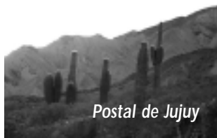
Postal de Jujuy

-La llegada a la ciudad, bajando del Abra, es muy linda. Si uno es un apasionado de los templos religiosos y las expresiones litúrgicas, estará de parabienes, pero el turista mayormente busca el entorno natural, como el «Paraje Tiraxi», un laberinto de bosques, quebradas y arroyos que es un prodigio de la naturaleza, a tan sólo 37 kms.