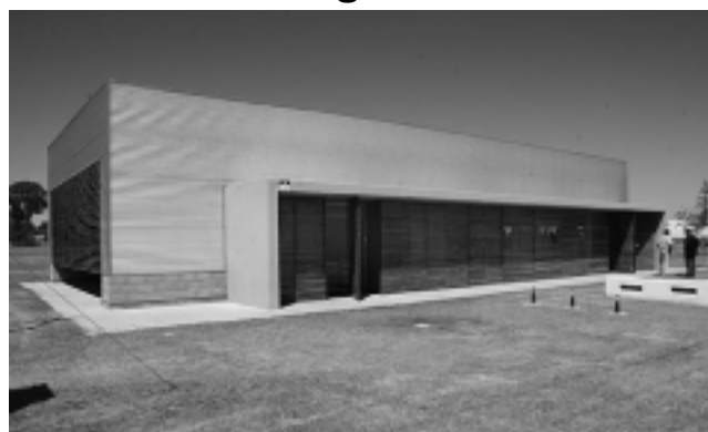
Edificio «Patagonia» de la ZFGP donde se desarrollará la 3ra. Reunión.