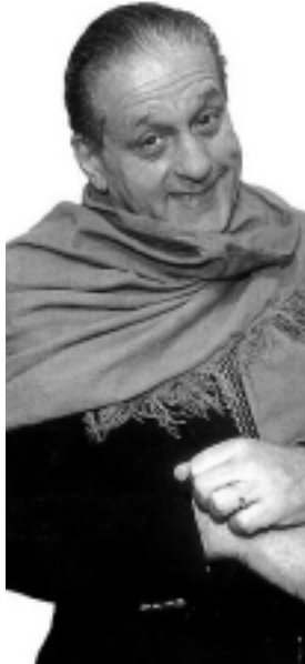
«Joaquín V. González, escribió la lección de optimismo que se nos entregaba al recibirnos: 'a mí no me ha derrotado nadie'. Yo no puedo decir lo mismo. A mí me ha derrotado esta sociedad corrupta que todo lo controla» escribió Favaloro antes de quitarse la vida.

y responsabilidad de siempre. Muchos de estos cardiólogos, son de prestigio nacional e internacional. Concurran a los Congresos del American College o de la American Heart y entonces sí, allí me brindan toda clase de felicitaciones y abrazos cada vez que debo exponer alguna 'lecture' de significación. Así ocurrió cuando la de Paul D. White lecture en Dallas, decenas de cardiólogos argentinos me abrazaron, algunos con lágrimas en los ojos. Pero aquí, vuelven a insertarse en el 'sistema' y el dinero es lo que más les interesa.