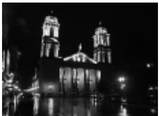
-Sacarse fotos en Plaza Independen-

-Recorrer el Parque 9 de Julio en vehículo, son 190 has muy bien cuidadas.