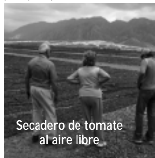
Secadero de tomate al aire libre

al aire libre. Llamativo, interesante y muy original.