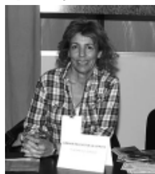
«Granja La Lomita» promocionó la realización de eventos en el campo y hasta estableció reservas.