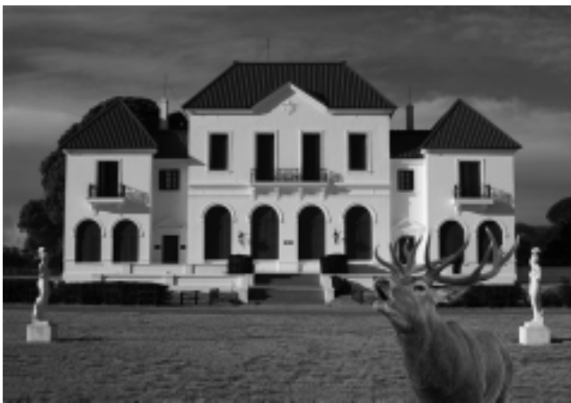
Esta fotografía será la imagen representativa de la Provincia en la campaña promocional organizada por el Ente Patagonia Argentina.