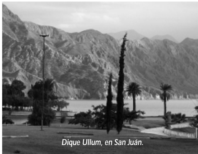
Dique Ullum, en San Juan.

El mes pasado, a pedido de un matrimonio amigo, le armamos el recorrido en vehículo de un viaje al Norte Argentino, bajo la premisa de que querían conocer la Quebrada de Humahuaca y darse el gusto de llegar hasta la Quiaca (para la foto nomás) en nuestra provincia de Jujuy, límite con el país hermano de Bolivia. Al regreso, agradecieron con un mistela exquisito de los Valles Calchaquies -buena actitud y