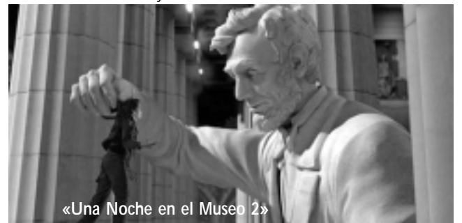
«Una Noche en el Museo 2»

Es el primer capítulo de la saga de X-Men, y reúne al personaje del título con otras varias leyendas del mismo cómic, en una épica revolución. Con Hugh Jackman, Liev Schreiber, Danny Huston, Will I Am, Dominic Monaghan y otros. Acción y aventuras. AM13. 110 min.