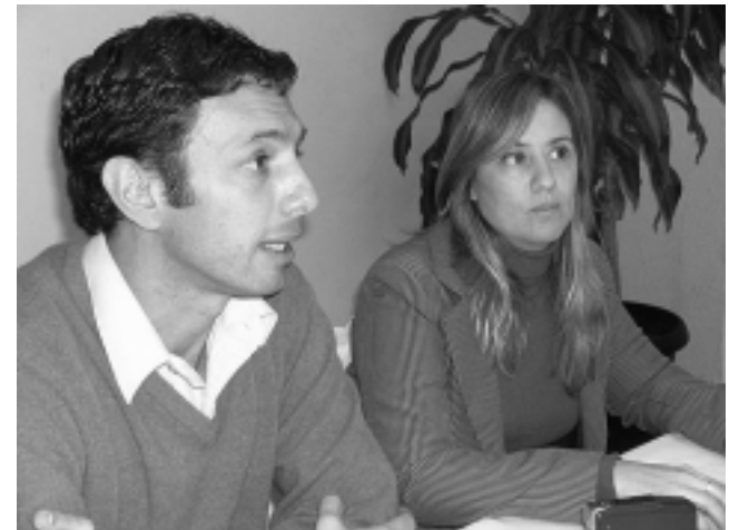
La presentación la hizo el subsecretario de Turismo, Santiago Amsé, junto a la becada, que estará en Tokio, Japón, desde el 1° de junio hasta el 2 de julio.

El gobierno japonés extiende la Asistencia Oficial para el Desarrollo (AOD) a los países en vías de desarrollo con el objetivo de apoyar al esfuerzo que conducirán al progreso económico y a una mejor vida de las personas de dichos países.