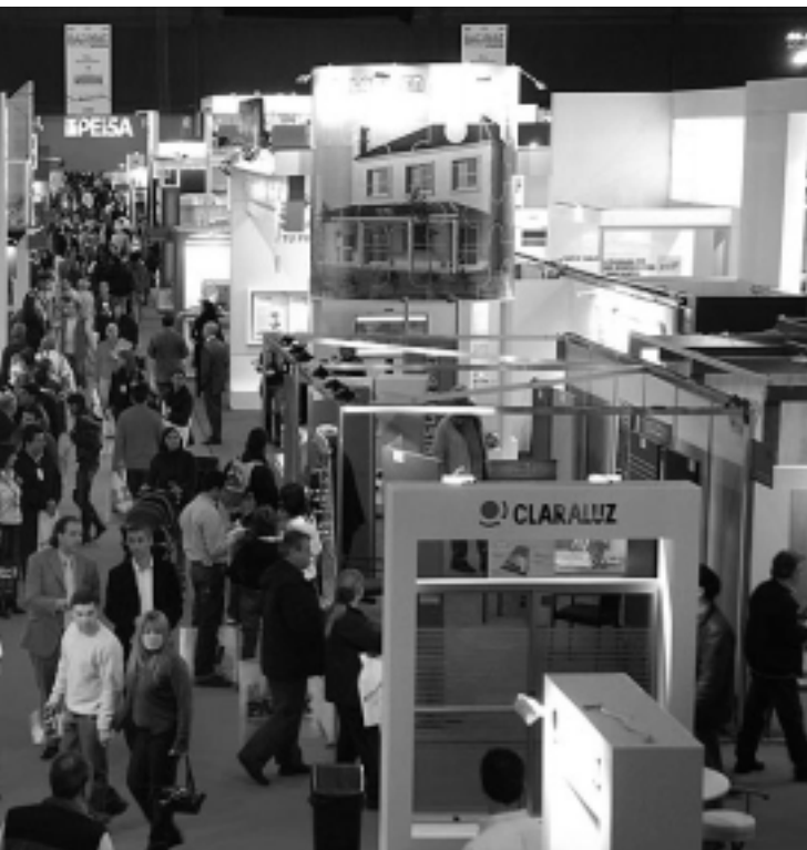
La vivienda «Batimat-Expovivienda 2009», es organizada como en ediciones anteriores, por la Asociación de Desarrollos Inmobiliarios - AEV -, la Cámara Argentina de la Construcción - CAC - y Exposiciones y Ferias de la Construcción - EFCA - a la que se suma el importante auspicio de Clarín ARQ. El ingreso será por Plaza Italia.