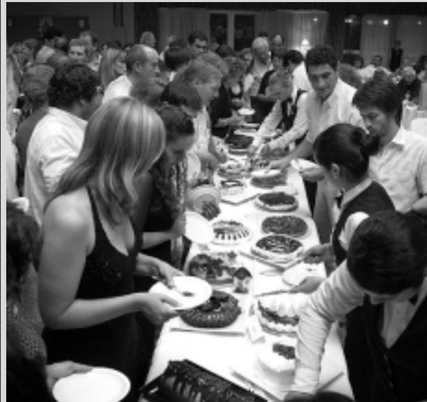
Foto de la reunión anual 2008. Este año la celebración y entrega de medallas y diplomas es con un almuerzo-show en carpa calefaccionada.

Coincidentemente, el mismo domingo 7 de junio junto con el almuerzo de cierre del mencionado torneo, se desarrollará el Almuerzo y Show Anual del Club. El valor de la tarjeta es de $100. Informes: Joaquín V. González 30, S. Rosa, tel: (02954) 424198 clubcazamapu@speedy.com.ar