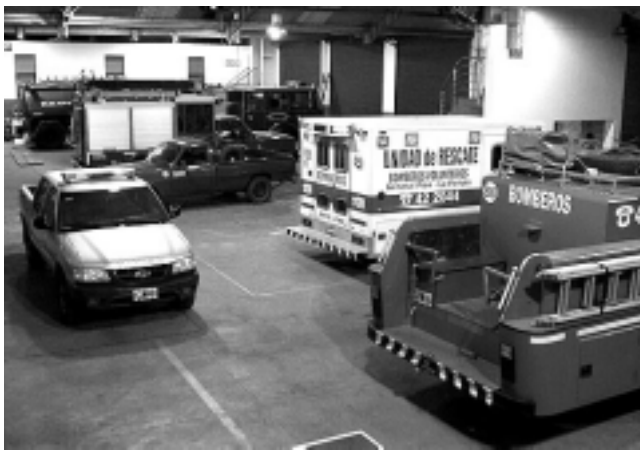
Cuartel de la Asociación de Bomberos Voluntarios de General Pico.

El primer cuartel fue en el barrio de la Boca, en Buenos Aires, ejemplo que se multiplicó a lo largo y ancho del país.