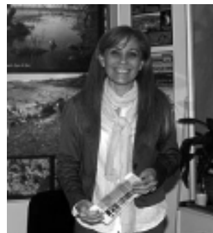
«Che Pampa» desplegó su oferta de Turismo Aventura. Gustó mucho.

La Villa Turística ahora dispone de alojamiento y es un producto serio sostenido. Un proyecto político hacia esta actividad no puede crecer sin el trabajo con las instituciones» explicó, a lo que el presidente de CaTuLPa coincidió señalando que la Cámara «conlleva un proyecto calificado al respecto y que tiene en claro el objetivo entre lo público y lo privado, que es la única manera de hacer crecer con éxito a Casa de Piedra, producto que está integrado a los objetivos de CaTuLPa».