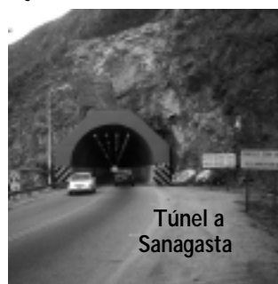
Túnel a Sanagasta

-Tomando la RN 75, a muy pocos kilómetros se puede visitar «Las Padercitas», un conjunto de ruinas de barro y piedra, de valor histórico que da para unas buenas fotos. Más adelante se llega al Dique «Los Sauces», un paisaje muy lindo. Muy cerca está el túnel a Villa Sanagasta, vale la pena conocerlo. A 12 km está el Mirador de la Cruz, una importante elevación con muy buena vista del lugar.