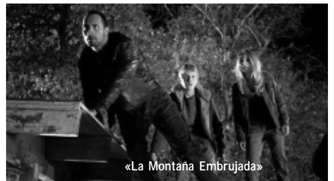
«La Montaña Embrujada»

Durante años, han circulado historias sobre un lugar secreto en medio del desierto de Nevada, conocido por fenómenos inexplicables y extraños avistamientos. Se llama «Witch Mountain», y cuando un taxista de Las Vegas (Dwayne Johnson) se encuentra con dos chicos con poderes sobrenaturales a bordo de su vehículo, se da cuenta de que se encuentra en medio de algo que no puede explicar. Cuando descubren que el único modo de salvar el mundo es develar los secretos de Witch Mountain comienza