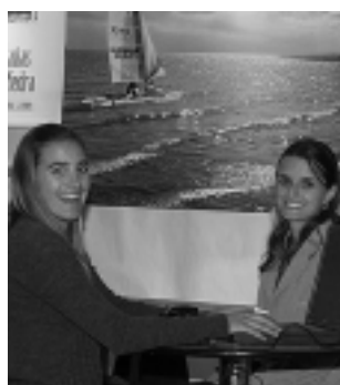
«Cabañas de Piedra» derrochó simpatía y buena información sobre la Villa Turística Casa de Piedra.

El ex gobernador y ahora candidato a Senador Nacional, Carlos Verna, cuando estuvo en la Carpa de Turismo dialogando con Zamponi dijo: «El desarrollo de Casa de Piedra ya atrapa al turista y debemos integrarlo a los circuitos».