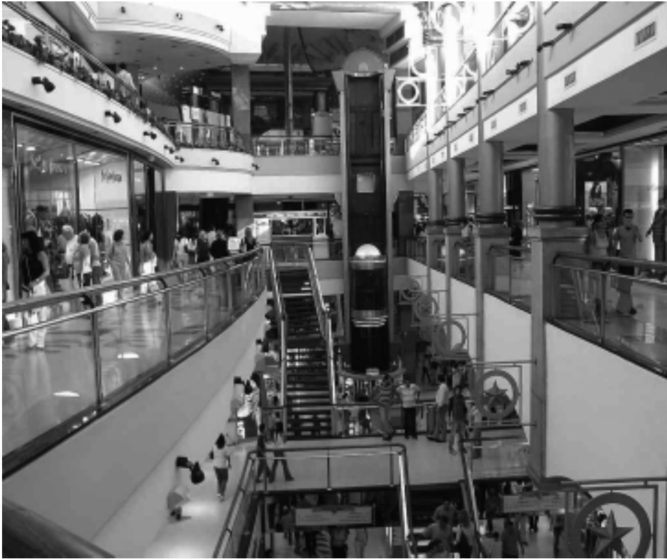
Las estadísticas del Shopping Alto Palermo indican el paso de un millón de personas de promedio por mes, de las cuales el 77 % serían mujeres y el 23 % hombres; casi la mitad, adultos de entre 24 y 40 años.