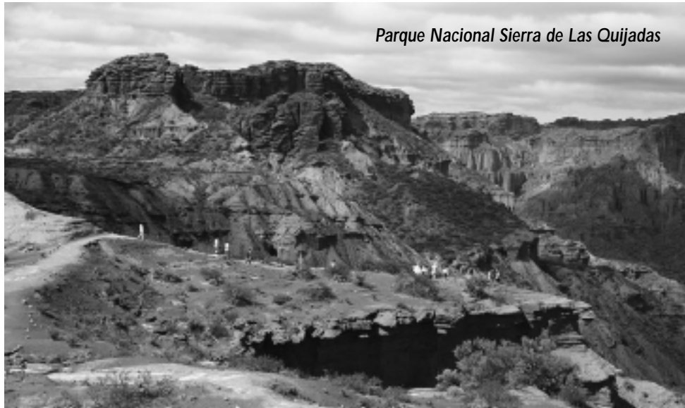
Parque Nacional Sierra de Las Quijadas

cuenta propia la visita guiada a la «Casa Natal de Sarmiento», un testimonio increíble de la historia ilógica de Argentina, con los desencuentros propios de la intolerancia. Muy apasionante. Solicitar información de horarios en la Secretaría de Turismo.