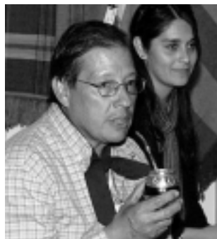
Estancia «San Carlos» entre mate y mate promocionó sus cabalgatas.