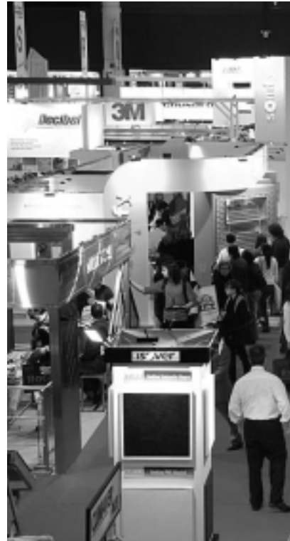
La exposición internacional de la construcción y la Asociación de Empresarios de la Vivienda y Desarrollo de las Ferias de la Construcción Argentina - EFCA.

Basada en el éxito obtenido en su última edición, este año la exposición que atrae y convoca de manera más efectiva a los protagonistas del mercado de la construcción y la vivienda se realizará del 2 al 6 de junio, como siempre en La Rural, Predio Ferial de Buenos Aires. Se llevará a cabo en forma simultánea la 5ª Exposición Internacional de las Industrias del Vidrio y el Aluminio - ALUVI 2009.