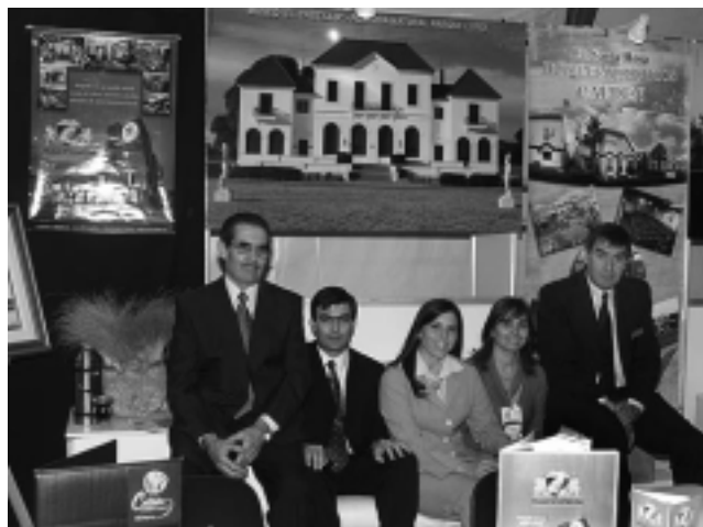
Hoteleros durante la Expo: Repartieron folletería, charlaron con público del interior provincial y tuvieron muchas consultas sobre tarifas y servicios.