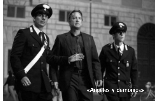
«Angeles y demonios»

«Angeles y demonios»: Tom Hanks vuelve a interpretar el papel de Robert Langdon, un catedrático de la universidad de Harvard experto en religión.