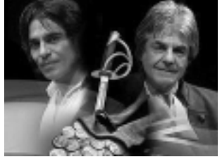
Dom. 26 a las 21hs: «La Tentación» de Pacho O'Donnell con Juan Palomino y Raúl Rizzo. $ 50, $ 65, $ 80.

Últimas funciones y despedida: -Sáb. 25 a las 20 hs y Dom. 26 a las 19 hs: Adaptación de la obra de Shakespeare «La Señora Macbeth».