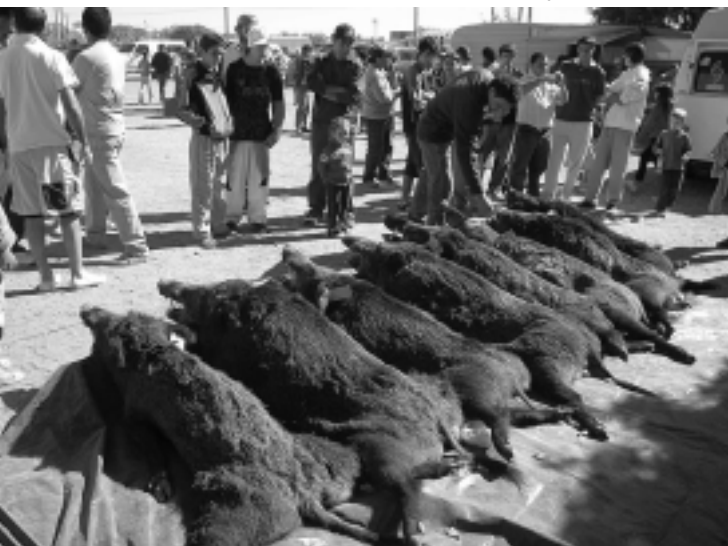
estacable la muy buena participación lograda por la organización en este primer Torneo.