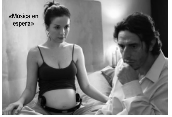
«Música en espera»