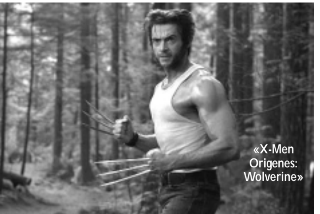
«X-Men Origenes: Wolverine»