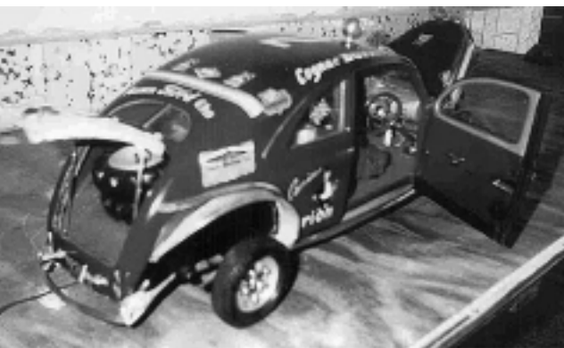
La réplica mide 75 cms de alto, 24 cms de ancho y pesa 30 kilos. Las puertas se abren, enciende las luces, tiene amortiguadores, una obra de arte.