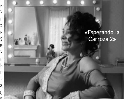
«Esperando la Carroza 2»