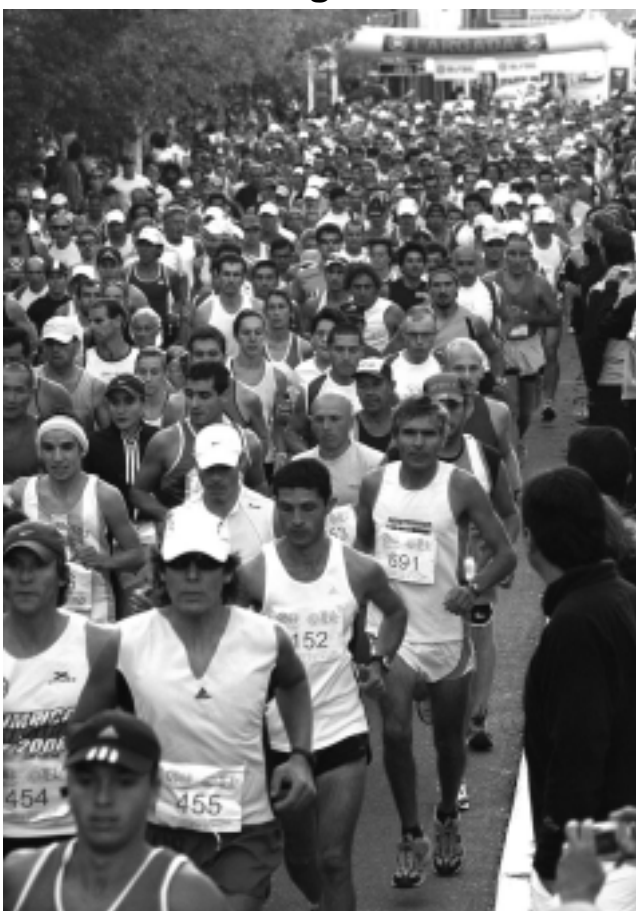
Muy buena participación de atletas de distintas latitudes, afirmaron el éxito de este evento turístico deportivo de Santa Rosa, ciudad que ahora será sede del V Binacional Argentino Chileno de Atletismo Veterano (ver nota aparte).