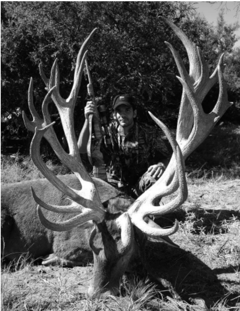
La noticia fue primicia mundial de REGION® Empresa Periodística en el sitio Web: www.region.com.ar.