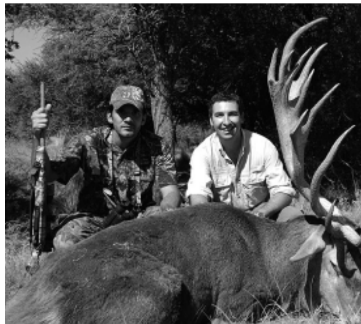
El trofeo ya precintado, se exhibirá por unos días, en el hall del Hotel Calfuclurá.