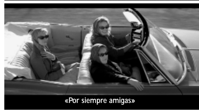
«Por siempre amigas»