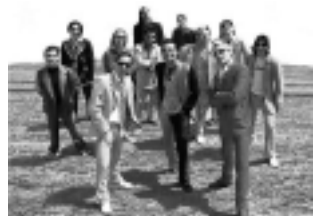
Sáb. 11, 23:30 hs: Los Caligaris $ 5

Jockey Rock: 9 de Julio 234 -Vie. 10, desde las 00 hs: Recital de rock de los grupos Núcleo y Kaidas