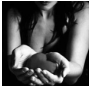
-Sáb. 7, 21 hs: «Mujeres son las

Más info: Agenda Cultural de la Subsecretaría de Cultura de La Pampa. e-mail: culturaprensa@lapampa.gov.ar - Tel: (02954) 43-1538 / 43-1651