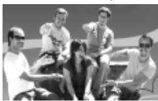
-Vier. 6, a las 23:30 hs: «Tarde Piaste» e invitados. Clásicos de rock nacional y latino, canciones melódicas, pop, etc. $ 10

• Casino Club Santa Rosa: Ruta 5 Km. 606,5. Tel: 45-4794. Entrada $ 3, antes de las 19 después: