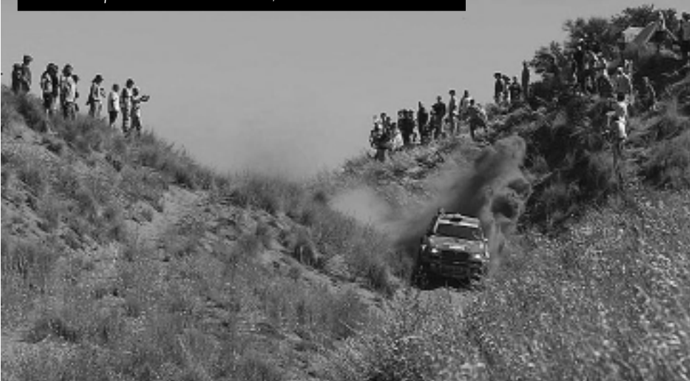
La carrera ya tiene fecha, será del 2 al 17 de enero de 2010 y de la Patagonia solamente tocará La Pampa. Esta edición tendrá más recorridos por la arena y las dunas, sin dirigirse hacia los duros terrenos del sur argentino.