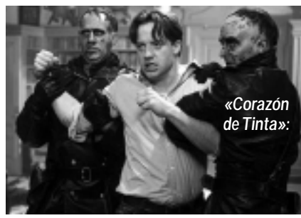
«Corazón de Tinta»

con muchos y diversos grupos de la vasta gama política. Desde alianzas con ciudadanos de la tercera edad hasta acuerdos con trabajadores sindicalizados, Harvey Milk cambió hasta la fisonomía de la lucha por los derechos del hombre, y para el momento de su prematura muerte en 1978, ya se había convertido en un héroe para los norteamericanos. Basada en una historia real. Con Sean Penn, Emile Hirsch, Josh Brolin, Diego Luna, James Franco, Allison Pill y otros. Drama biográfico. AM16. 130 min.