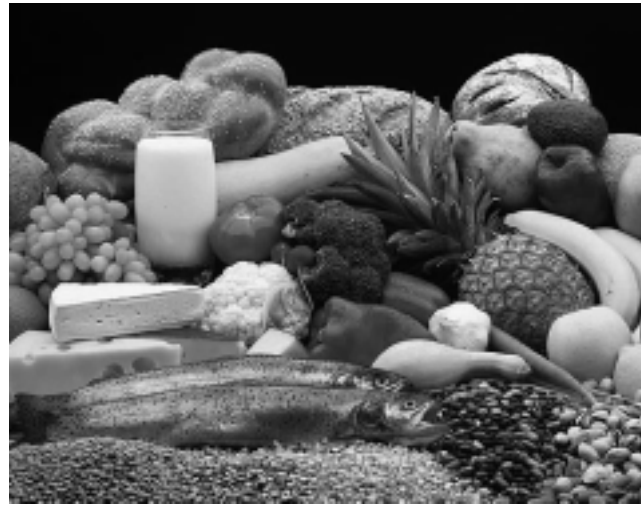
Es necesario llevar una vida sana con una buena alimentación a base de frutas y verduras.