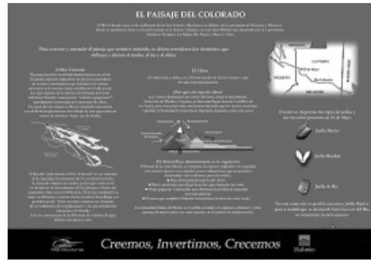
El paisaje, como aspecto visible del espacio, guarda información sobre su origen. Muestra detalles y cicatrices, a veces sutiles, de los eventos y procesos que resultaron en lo que actualmente se puede observar.