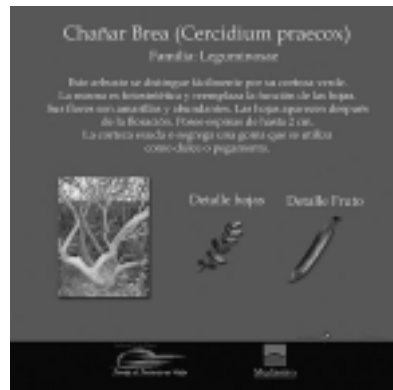
Los carteles de interpretación de flora y fauna local tienen un diseño de fácil comprensión, con fotografías de las especies, que facilitan al usuario la observación de los aspectos más relevantes y distintivos de cada especie.