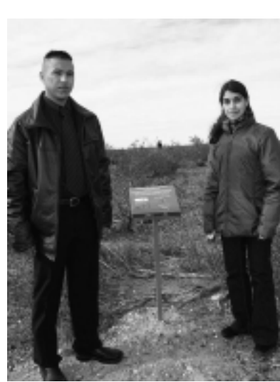
La consultora turística «Pampas Argentinas» también capacitó a guías locales que recibirán a los turistas que deseen disfrutar de los atractivos de la zona, entre ellos el flamante Mirador. El uso del río como recurso productivo incluye también la central hidroeléctrica «Los Divisaderos», donde también se ha desarrollado una visita guiada con imágenes interpretativas, que será motivo de otra nota.