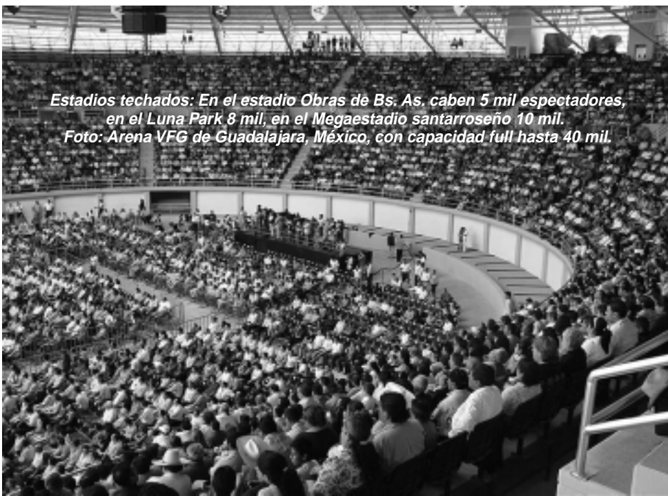
Estadios techados: En el estadio Obras de Bs. As. caben 5 mil espectadores, en el Luna Park 8 mil, en el Megaestadio santarroseño 10 mil. Foto: Arena VFG de Guadalajara, México, con capacidad full hasta 40 mil.

El aumento en la cantidad de visitantes nacionales e internacionales que la captación de eventos trae a un destino es el efecto más inmediato de este segmento. Además, hay un incremento en el tiempo promedio de estadía, generando una demanda de servicios adicionales a la de los turistas corrientes y por lo tanto un gasto turístico promedio mucho mayor, calculado en al menos tres veces el de los turistas convencionales.