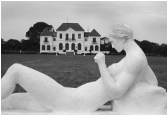
Los turistas serán llevados a transitar imaginariamente los jardines franceses que embellecían el frente, dicen los guías.

embellecían el frente -dicen los guías-. Se destacarán las comodidades que tuvo la Casa, las modernidades de Europa de principios de siglo presentes en todos sus aspectos, desde la iluminación, la calefacción y hasta sus detalles de lujo». Junto a la «Caminata histórica» ofrecen también una caminata por el «Bosque pampeano», donde el visitante puede elegir el recorrido de su preferencia. Para consultas, llamar al (02954) 49-9000 ó info@parqueluro.gov.ar