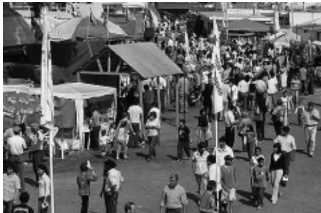
El Predio Ferial de la AAGLP cumple un rol incomparable como sede turística, de esparcimiento y cultural, siendo un espacio permanente de importantes actividades