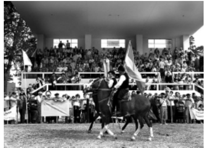
Este año la AAGLP realizará su 81ª Exposición Agrícola, Ganadera, Industrial y Comercial el 28, 29 y 30 de setiembre.

Los Comercios y Empresas presentes en esta página, saludan a dirigentes y asociados de la Asociación Agrícola Ganadera de La Pampa, al arribar al 89º aniversario de su puesta en marcha.