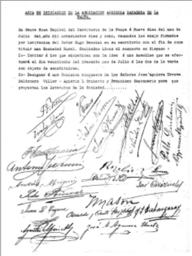
Acta inicial donde se propone la primer asamblea para el día 28 de julio de 1918 a las dos de la tarde.

Todas las miradas están puestas en el desequilibrio climático que globalmente se sufre, a la espera de una próxima feria agrícola, ganadera, industrial y comercial, que en un panorama adverso le pone fuerzas institucionales para que una vez más sea la gran fiesta del encuentro del campo con la ciudad.