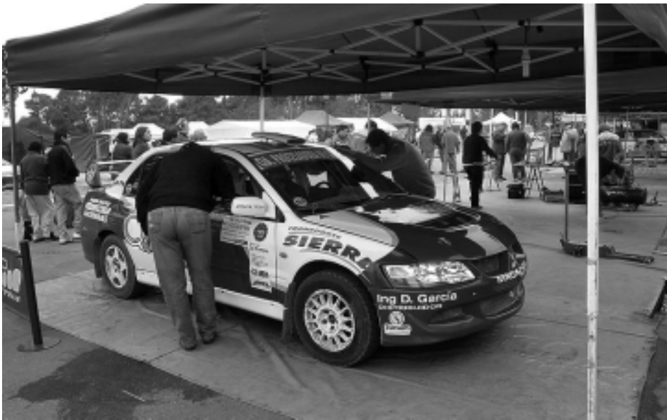
Los accesos a la competencia del Rally son gratuitos y se cerrarán una hora antes de cada largada. Se espera la participación de una gran cantidad de espectadores y medios de prensa.

Como si esto fuera poco y aunque parezca increíble la superposición de fechas, en el autódromo de Santa Rosa se presentan tres categorías convocantes: Supercar Pampeano, Fórmula Renault Pampeana y Monomarca Gol, prometiendo que habrá en total cerca de 100 autos.