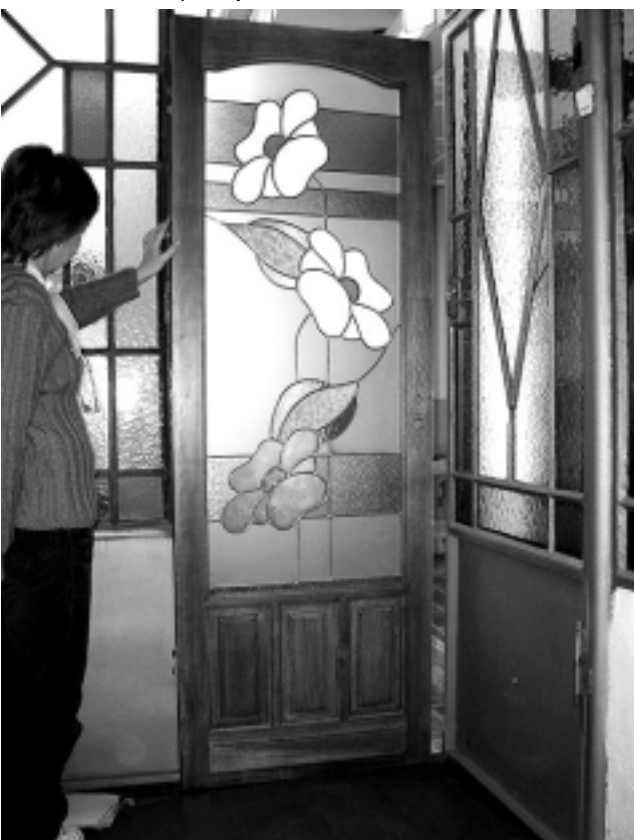
El vitraux y la vitrofusión no sólo dan lugar a la expresión artística sino que son además, una salida laboral rápida y redituable que abarcan los rubros de la construcción, decoración, artefactos eléctricos, bazar, etc.

El taller se desarrollará en Marcos Molas 46 esquina Beltrán de esta Capital y los interesados pueden pedir mayor información en el Tel: (02954) 42-7795 ó al Cel: 1551-7478.