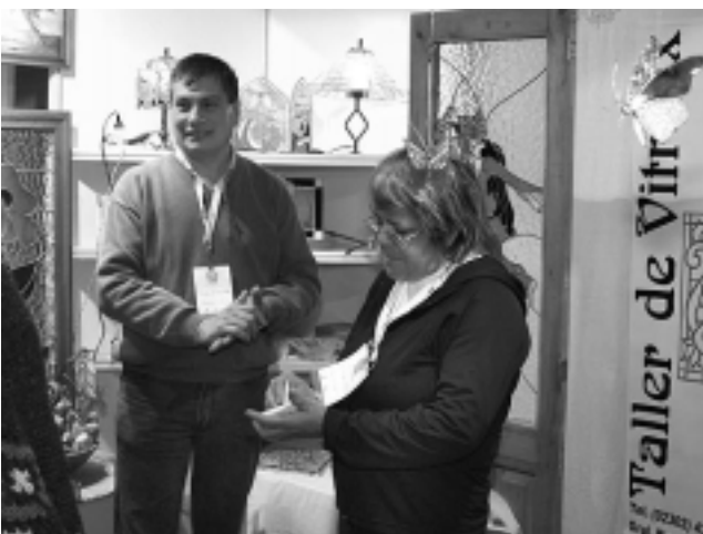
En la «Expo PyME 2007» realizada este año en Santa Rosa, el «Vitrales de La Pampa» recibió gran cantidad de consultas sobre esta actividad verdaderamente apasionante.

Los maestros de «Vitrales de La Pampa» de la ciudad de General Pico comenzarán a dictar cursos en Santa Rosa de realización de vitraux y vitrofusión.