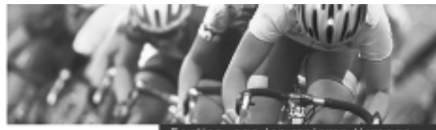
Festina, con los mejores tiempos