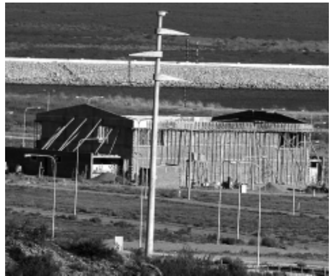
El Polideportivo junto al lago, que hasta hace pocos meses estaba en etapa constructiva (foto REGION® de abril), ya está terminado y será puesto en marcha el miércoles próximo.