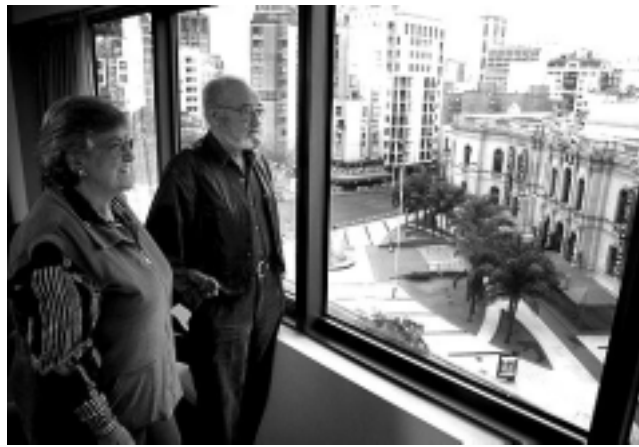
La cadena Amerian Hoteles se caracteriza por muy buenas ubicaciones en cada destino. Aquí en nuestra visita al primer establecimiento de Córdoba, se observa que están frente al Shopping con una impresionante vista de la ciudad, la misma que habrá de Santa Rosa, a 50 metros de la plaza central.

Actualmente el proyecto edilicio tiene los planos ya visados por la Municipalidad de Santa Rosa y el estudio de impacto ambiental aprobado. Las etapas que tienen por delante son, primero, la parte constructiva, luego las terminaciones de «ves-