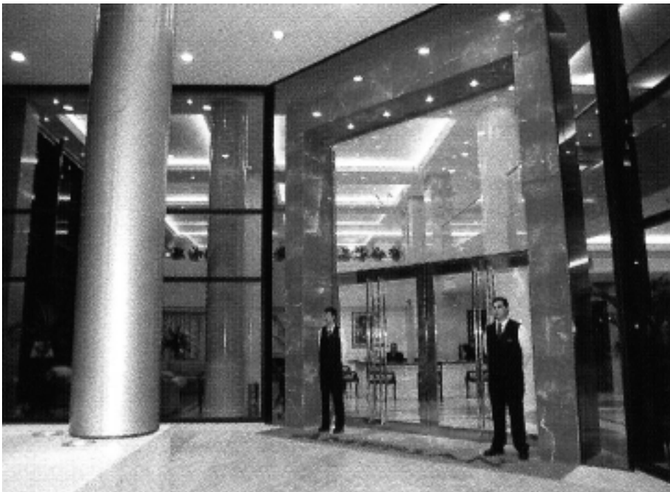
El proyecto del nuevo Hotel & Spa con franquicia de la cadena Amerian, pertenece a un grupo de inversores pampeanos y tiene un monto estimado de entre 10 y 11 millones de pesos. La ubicación es en Av. San Martín 156 y la apertura está programada para diciembre de 2009.

Se trata de la construcción de un hotel y spa, con salones de eventos, restaurante, bar y servicios complementarios, en un edificio de siete pisos con dos subsuelos para estacionamiento y sala de máquinas. «La propuesta involucra una importante inversión, con el objeto de construir un establecimiento acorde a la jerarquía que ofrecerá y su estratégica ubicación geográfica dentro de la ciudad, sobre la avenida principal» dijeron desde el grupo inversor franquiciante, integrado totalmente por empresarios pampeanos.