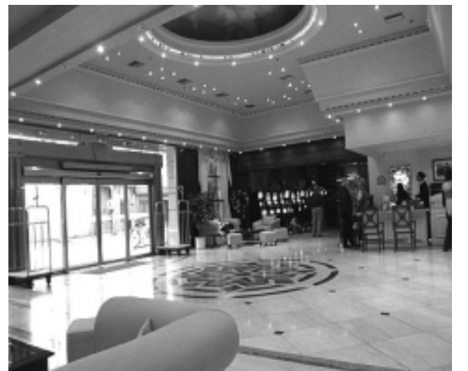
Santa Rosa será la cuarta franquicia de la cadena. Otras son Catamarca, Resistencia y Villa Mercedes, estas dos últimas con casinos. La foto pertenece a nuestra visita al Amerian Palace Hotel Casino de Villa Mercedes, San Luis.

Recientemente Amerian Hoteles fue distinguido con la primera mención al Mejor Stand de la Categoría Hotelería presentado en la FIT 2006, recibiendo diploma de honor. Sin duda la elección de la marca para La Pampa, por su prestigio y alcance, resulta en un claro acierto, incorporando servicios que desde hace tiempo venimos señalando como una necesidad y que tienen un nicho que ahora comienza a ocuparse.