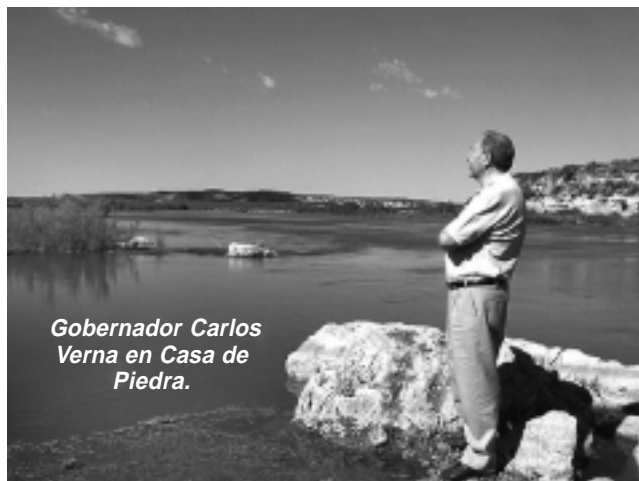
Gobernador Carlos Verna en Casa de Piedra.