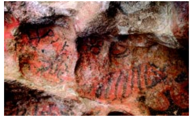
Camino al Valle de las Pinturas Rupestres, el sendero pasa por «La Casona», ruinas de la Estancia Santa María.

En el paraje: cerca de la entrada al Parque hay un motel con restaurante y teléfono público. Tel: (02952) 43-6101.