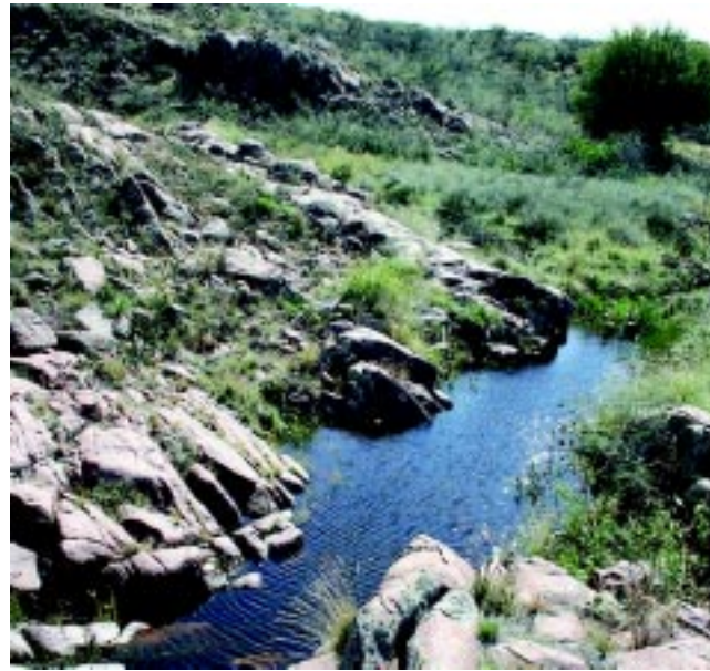
Cardos, líquenes, zampas y otras muchas expresiones de la flora, brotan bordeando un arroyito que va formando pequeños pozones de agua entre las sierras que lo encajonan.

Después de observar el contenido de la reserva, nos dará ganas de llegar hasta La Casona (ruinas de lo que fuera la Estancia Santa María) y recorrer el Valle de las Pinturas (pinturas rupestres de 2.000 años de antigüedad) para regresar a la hora del al-