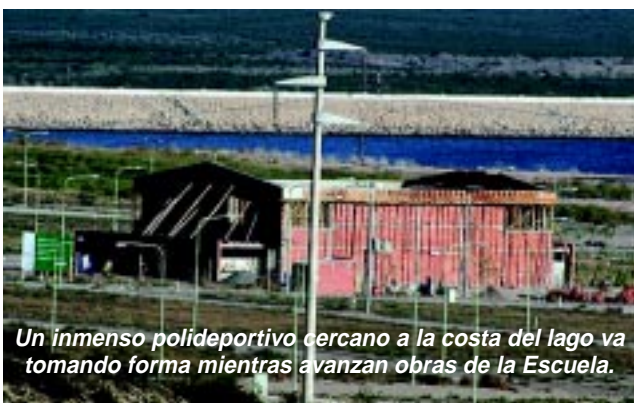
Un inmenso polideportivo cercano a la costa del lago va tomando forma mientras avanzan obras de la Escuela.