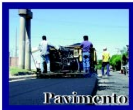
Realizamos obras de pavimento y cordón cuneta mejorando la calidad de vida de los vecinos en todos y cada uno de los barrios.