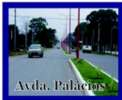
Remodelación integral que convierte a esta arteria en una alternativa ágil y moderna de acceso a la ciudad.