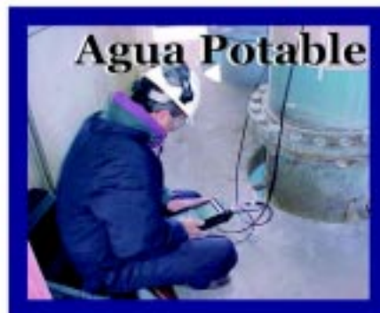
Automatización de pozos. Medidores domiciliarios. Recuperación de tanques. Cierre de mallas. Servicio de agua potable con calidad y cantidad.