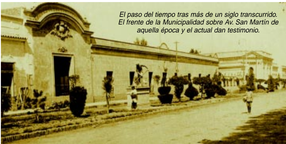
El paso del tiempo tras más de un siglo transcurrido. El frente de la Municipalidad sobre Av. San Martín de aquella época y el actual dan testimonio.