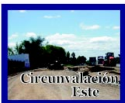
Moderna Obra que incorporará colectoras, iluminación, doble carril central, catorce cruces semaforizados y tres puentes peatonales aéreos.