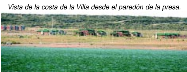
Vista de la costa de la Villa desde el paredón de la presa.