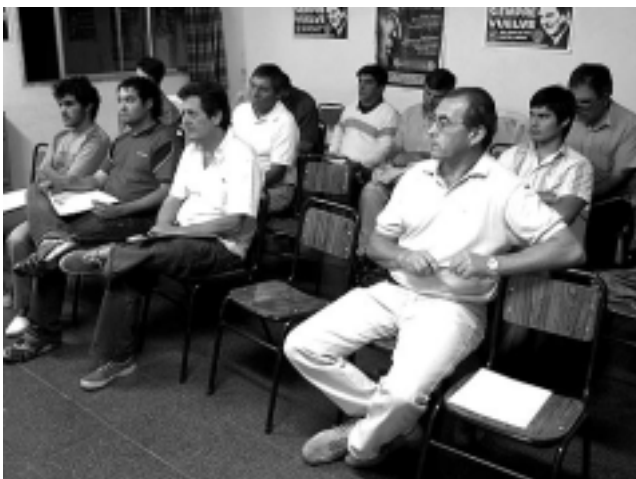
La capacitación a los taxistas comenzó el martes 17 y sigue este viernes 20 y el martes 24 de abril, a partir de las 19 hs. en la sede de la CGT, sita en Irigoyen 261, Santa Rosa.

Con miras a establecer mejoras en el servicio de taxis de la ciudad de Santa Rosa, se acordó la organización de distintas jornadas de capacitación para los conductores.