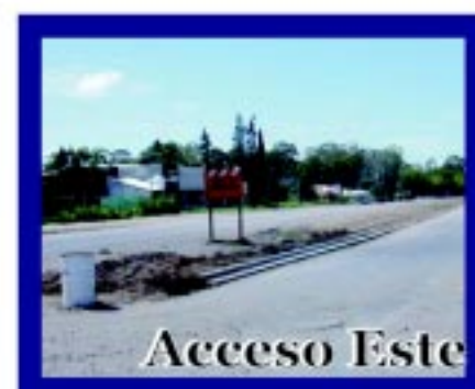
Obra Acceso Este, que incluye ingresos a los barrios totalmente iluminados y seguros, señalización, colectoras y reforestación.