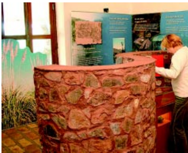
Lo mejor es empezar recorriendo el nuevo Centro de Interpretación, una sala con excelente información.