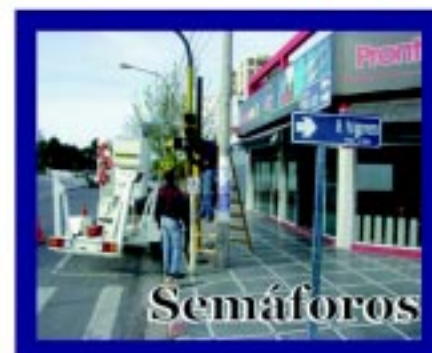
Colocamos nuevos semáforos, recambiamos viejos equipos y coordinamos las señales, para mejorar el ordenamiento vehicular.