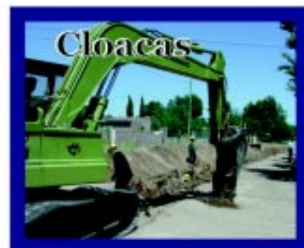
Obra de desagües cloacales para los Barrios Villa Elisa, Malvinas Argentinas y Villa Germinal, que suma 1200 nuevas conexiones domiciliarias.