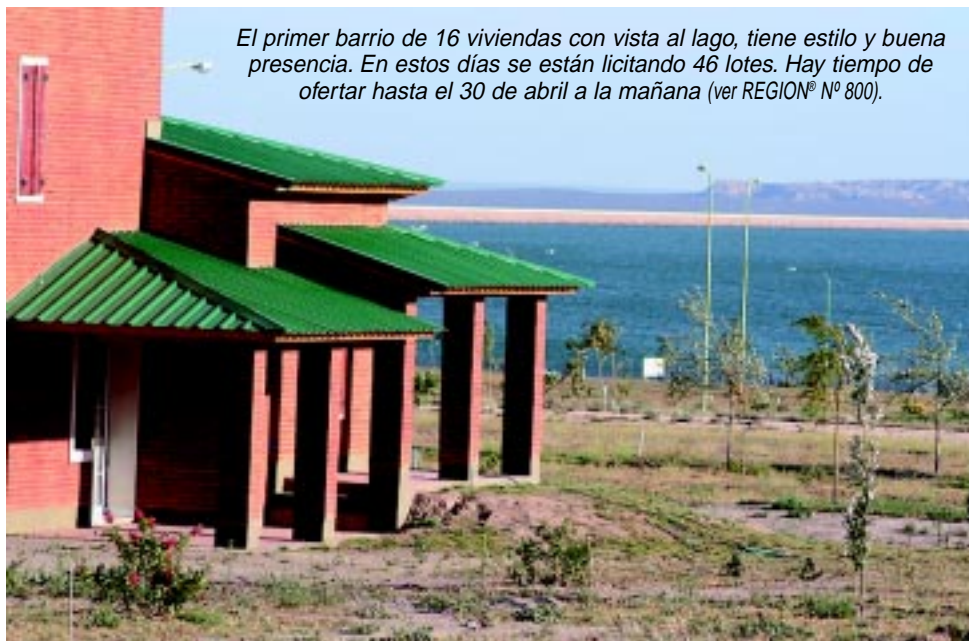
El primer barrio de 16 viviendas con vista al lago, tiene estilo y buena presencia. En estos días se están licitando 46 lotes. Hay tiempo de ofertar hasta el 30 de abril a la mañana (ver REGION® N° 800).

El espejo de agua de 55 km de costa es el atractivo principal, con bordes de suave pendiente, que favorece la práctica de actividades náuticas y de pesca.