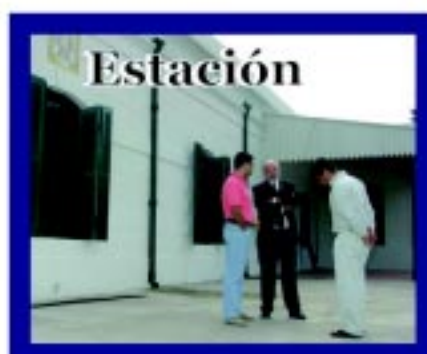
Remodelación de la Estación de Trenes, recuperando el patrimonio histórico, cultural y arquitectónico de los santarroseños.