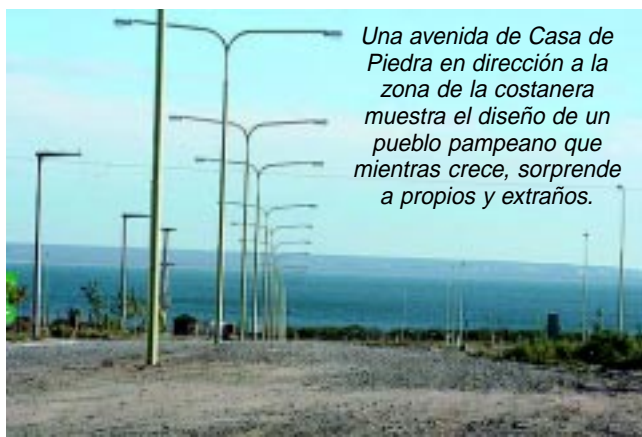
Una avenida de Casa de Piedra en dirección a la zona de la costanera muestra el diseño de un pueblo pampeano que mientras crece, sorprende a propios y extraños.

A pocas cuadras del «centro» del pueblo, una zona de altura a 20 mts sobre el nivel del lago, es un mirador natural que ofrece una vista panorámica de la región.