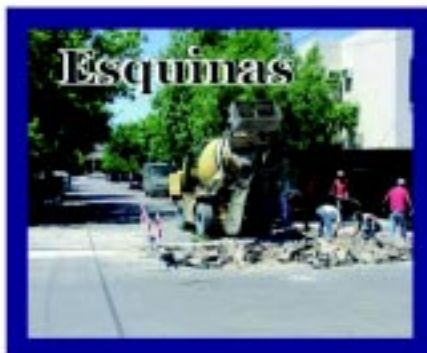
Completo programa de reconstrucción de esquinas que se desarrolla en distintos sectores de la ciudad.