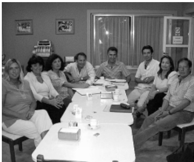
La Cámara de Turismo hará una presentación en Buenos Aires sobre Los Recursos Turísticos de La Pampa.

La Cámara de Turismo de La Pampa realizó en el Hotel San Martín de Santa Rosa, la primera reunión del año, con importantes anuncios de diversas actividades a desarrollarse, como la presentación en Buenos Aires la semana próxima, durante un desayuno de trabajo con la prensa, a llevarse a cabo en la Cámara