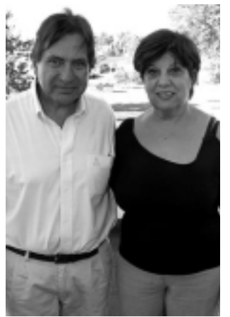
Dómina y Bertone.