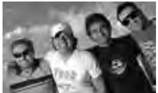
-Sáb. 6 a las 21 hs: "Sabroso" con todo el cuarteto cordobés.

• Feria: 1° de Mayo y R. B. Díaz. -Sáb. 6 y dom. 7 a las 10 hs: locales de venta. Espectáculos artísticos. • Agrupación "El Indio": V. Arriaga. -Sáb. 6 a las 19 hs: Fiesta Provincial "Día Nacional del Gaucho. Paseo Gaucho recorriendo la ciudad. Peña. - Dom. 7 a las 9:30 hs: Concurso de riendas. Jineteada • Predio Horacio del Campo: Toay -Sáb. 6 a las 21 hs: "Sabroso" con todo el cuarteto cordobés. • Club de Planedores: Ruta 5 -Sáb. 6 y dom. 7 a las 10hs: Encuentro Nacional de aeromodelismo. • Jardín Botánico: Chimango a media cuadra de Av. Perón. Especies autóctonas e implantadas. Sáb. dom. y feriados de 16 a 20 hs. Gratis • Bosque Los Caldenes - Avila y Pereyra. Visita al Centro de Interpretación -Lun. a vie. 8 a 13 y de 16 a 20 hs. Sáb, dom. y feriados de 10 a 13 y de 16 a 20 hs. Gratis • La Malvina - Parque Don Tomás. Casa Museo - Reserva Natural Urbana. Exposiciones. -Lun. a vie. 8