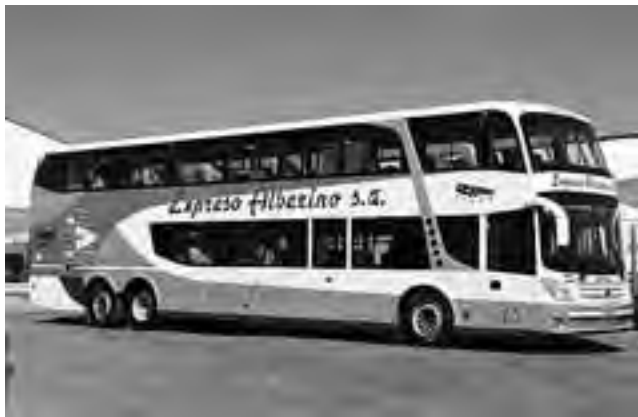
Últimos micros cero kilómetro incorporados este año. La actualización permanente de las unidades constituye una característica distintiva de «Expreso Alberino» a nivel nacional.