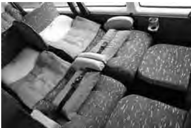
El servicio ofrece un confort incomparable que los pasajeros valoran.

Más información en: www.expresoalberino.com