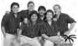
-Sáb. 6 a las 23:30 hs: show retro tropical con "Los Palmeras". $ 30. -Dom. 7 a las 23:30 hs: Candela. $ 5

• Teatro Español: H. Lagos 44. -Sáb. a 6 las 21 hs: "Transitando Caminos" con Hueney Mapu. $50. • DZero: Avellaneda y Alvear. -Vie. 5 y sáb. 6 a las 23 hs: Todo el Rock con "Led Ladies". • Jockey Club: 9 de Julio 130 -Vie. 5 a las 00 hs: Kommando, Prisión Kaos y Resistencia. -Dom. 7 a las 23:30 hs: Fiesta del Combinado. • Marcopolo: Avellaneda 215 -Vie. 5 a las 00 hs: "Los Barentos" • Social BarClub: Alvear 42. -Sáb. 6 a las 22 hs: "Colosal" Joe Satriani tributo. $ 40. -Dom. 7 a las 21 hs: Indio Mike & Testa. $ 50 • Casino Club Santa Rosa: Ruta 5 y Circunv. Tel: 45-4794. Entrada $ 5 antes de las 19 hs después: -Vie. 5 a las 23:30 hs: folklore tradicional con "Los de Maza". $ 5.