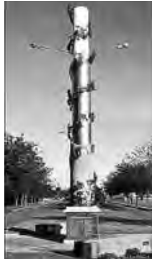
Monumento al Centenario de General Pico, donado por la Asociación Italiana.