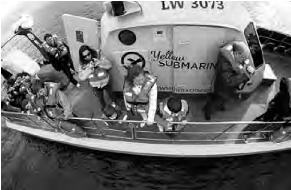
Único en el mundo, invita a sumergirse en el Golfo Nuevo para ver a las ballenas y a los lobos marinos bajo el agua. Hasta el 15 de diciembre: $ 980 para mayores y $ 490 para menores, entre 4 y 12 años.

Se trata de la primera embarcación del mundo diseñada especialmente para avistar ballenas francas australes y lobos marinos de un pelo, sobre la cual hemos comentado en anteriores notas.