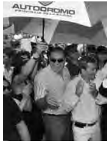
El día de la inauguración, 11 de noviembre de 2012.