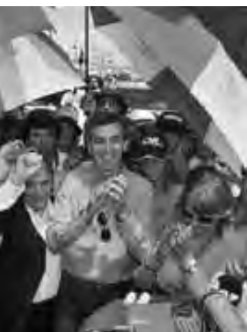
2012, con la presencia del ministro Randazzo sus productos”.