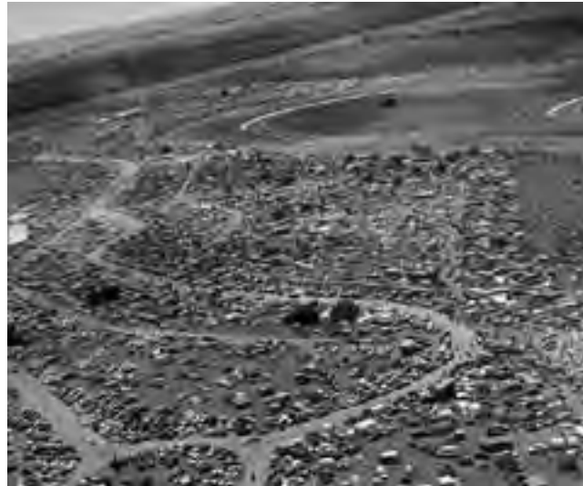
En la sumatoria de las actividades de estos dos años, más de 500 mil espectadores han concurrido al circuito pampeano.

El próximo martes 11 de noviembre, se cumplen dos años de la inauguración del "Autódromo Provincia de La Pampa". Una obra del Turismo Deportivo que ha generado una muy buena respuesta económica y recreativa, no sólo en el sector turístico hotelero y gastronómico, sino también en