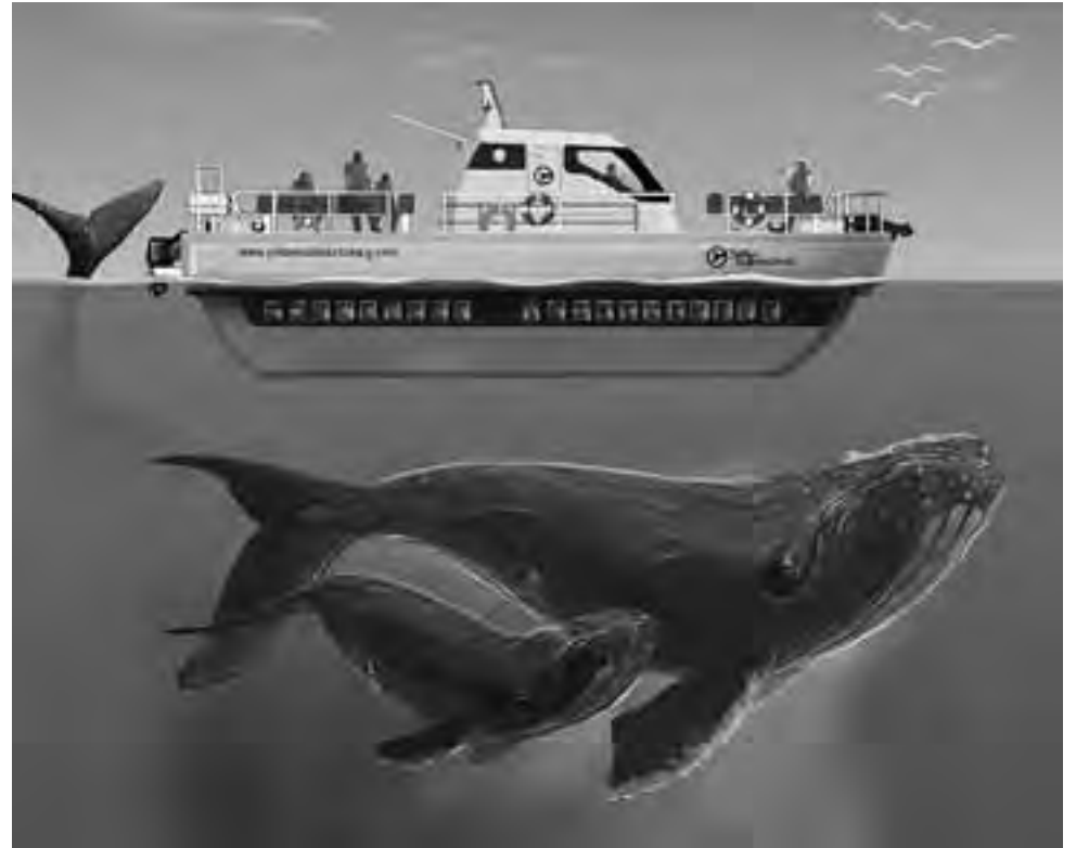
Dibujo recreativo de cómo funciona el servicio, que permite a los pasajeros circular libremente y observar a las ballenas en superficie, desde la cubierta superior, y desde la cabina submarina, a través de las 40 ventanas que tiene bajo el nivel del agua, como si estuvieran buceando junto a ellas.

Las salidas se realizan desde Puerto Pirámides y en un radio de diez millas desde el punto de