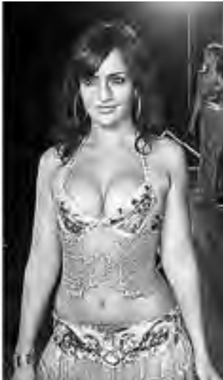
Monumento a la belleza, Reina del Centenario, un aporte de la colectividad árabe.

Este martes 11 de noviembre la ciudad de General Pico celebra un nuevo Aniversario Fundacional, ocurrido en 1905 y comienza a transitar su camino hacia los 110 años. En oportunidad de su Centenario, la Asociación Italiana XX de Setiembre de Socorros Mutuos de la ciudad noroesteña, donó el Mo-