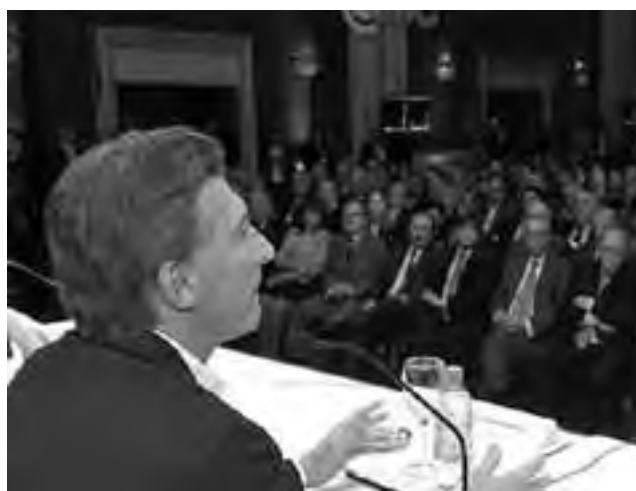
Mauricio Macri fue el primer precandidato presidencial en hablar en el Encuentro "Los Candidatos y la Industria PYME" organizado por CAME. El líder del PRO anticipó que llevará de dos a tres años terminar con la inflación.

Héctor Méndez, presidente de la Unión Industrial Argentina (UIA), afirmó que hay "enorme tristeza" en el sector industrial y que es "unánime" el rechazo al proyecto de modificación de la ley de abastecimiento que impulsa el Gobierno porque supone un "retroceso enorme". También dijo no estar de acuerdo con las afirmaciones de Cristina Kirchner respecto al "encanute" de los autos. El presidente de la UIA señaló que harán la celebración a fin de año, junto con las fiestas tradicionales, por ahora "no están dadas las condiciones para festejar nada".