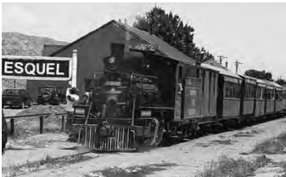
"La Trochita" sale todos los sábados desde Esquel hasta El Maitén con una parada en Nahuel Pan.

Para quien visita Buenos Aires y quiere conocer Tigre y su delta, el Tren de la Costa lo lleva todos los días desde Olivos, con un boleto que le permite bajar en estaciones intermedias y disfrutar de sus atractivos, para continuar