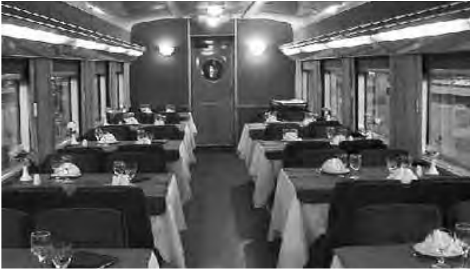
Un viaje inolvidable es en el Tren Patagónico, que cubre el recorrido desde Viedma a Bariloche. El servicio cuenta con clases Turista, Primera, Pullman y Camarote. Además tiene coche comedor, una disco, vagón cine y como para completar la comodidad, cuenta con bandejas para transportar el auto del pasajero.

El Tren a las Nubes, La Trochita, el del Fin del Mundo, el de las Sierras, el Histórico, el de la Selva, el Tren de la Costa y el Patagónico, son servicios destinados al turismo para recorrer algunos lugares mágicos de Argentina y también disfrutar de originales viajes. Estos trenes son las opciones turísticas que sobrevivieron en el país al desmantelamiento del sistema ferroviario de pasajeros de larga distancia en la década del 90.