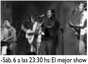
-Sáb. 6 a las 23:30 hs: El mejor show

-Vie. 5 a 21:30 hs: recital homenaje del grupo Pampa4, integrado nuevamente con sus creadores $40. -Sáb. 6 a las 21:30 hs: Recitales Asociación Pampeana de músicos. $50. • Peña Choique: Salta 1361 -Vie. 5 a las 22 hs: Agasajo a "Pampa 4" con músicos invitados. $ 30. • Social BarClub: Alvear 42. -Vie. 5 a las 22 hs: Folclore pampeano de "León Gamba". $ 40. -Dom. 7 a las 21 hs: jazz tradicional con "La Trigueña Jazz Band". $ 50. • Club el Fortín: 9 de Julio 652. -Vie. 5 a las 23:30 hs: Cumbia y cuarteto con la Banda K-Liente. • Marcopolo: Avellaneda 215 -Vie. 5 a las 00 hs: "Los Sospechosos de Siempre" Rock Nacional. • Casino Club Santa Rosa: Ruta 5 y Circunv. Tel: 45-4794. Entrada $ 5 antes de las 19 hs después: -Vie. 5 a las 23:30 hs: Folclore tradicional con Anita Fernández. $ 5.