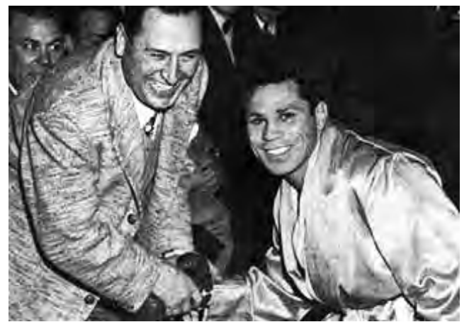
Famosa foto del Mono con el General Perón.

En Villa Mercedes, provincia de San Luis, fue inaugurado este año el “Museo del Boxeador”, en la vivienda que habitó en sus primeros años, una de las personalidades emblemáticas del deporte argentino de los puños: José María “el mono” Gatica.