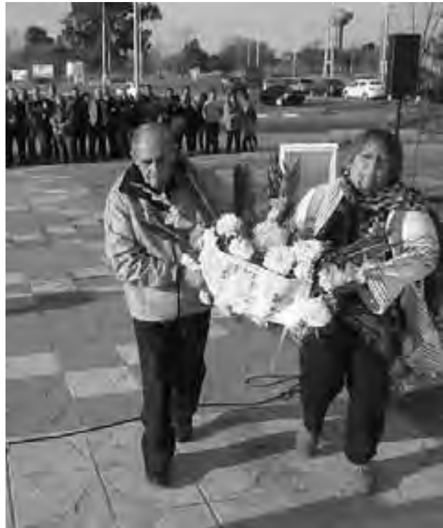
Ofrenda floral de la Unidad Básica de General Pico