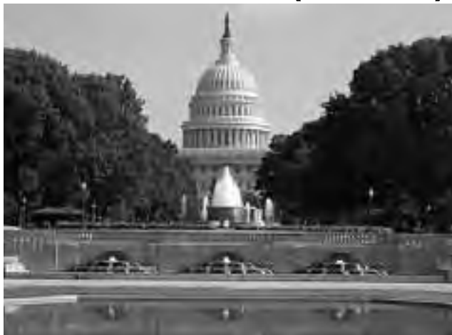
Esta semana abordamos la llegada a la capital federal: Washington DC

La semana pasada (ver Semanario REGION® N° 1.138) cubrimos la tercera parte de esta nota, donde la sugerencia de viaje es volar a Nueva York y de allí recorrer en auto alquilado equipado con GPS, toda la Costa Este de Estados Unidos, hacia el Sur.