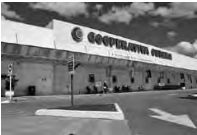
La industria cooperativa prioriza el mercado interno al externo, hace un uso racional de los recursos naturales, efectúa sus inversiones en el país y acredita una singular responsabilidad social

Naciones Unidas en su Resolución 47/90, proclamó como "Día Internacional de las Cooperativas" al primer sábado de julio de cada año, en razón de que estas empresas son 'claves' para el impulso de un desarrollo duradero y equitativo.