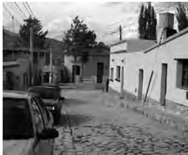
Tilcara, donde cada calle es una postal y cada noche, una fiesta.

Miles de norteros y turistas, se preparan para participar de los festejos del jueves y viernes santo en la localidad de Tilcara, donde la tradición da lugar a la máxima expresión anual del Turismo Religioso, que despliega coloridas procesiones por las calles del pueblo, distante a 84 kilómetros al norte de Jujuy, en plena Quebrada