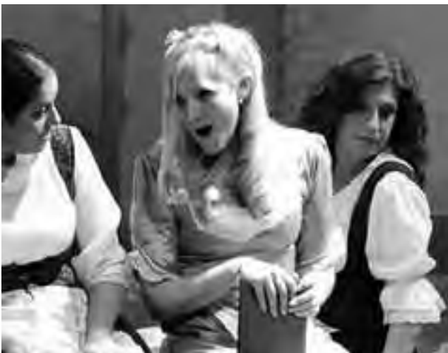
La soprano Cecynés Peralta será una de las intérpretes de la velada.