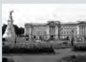
Palacio de Buckingham, causal del recorrido que dió la distancia actual.

tancia existente entre la meta prevista y los soportales del palacio (pórtico cubierto, un alero con columnas), sumaron un total de 42,195 km, distancia que permanece como oficial hasta nuestros días.