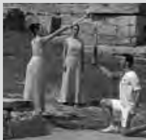
Representación en Olimpia, Grecia.

Los Juegos Olímpicos, comenzaron en la antigua ciudad de Olimpia, en Grecia, en el año 884 antes de Jesucristo, y se celebraron durante 1.200 años, hasta el 394 en que fueron suprimidos.