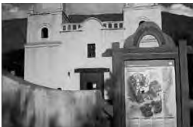
Templo «Nuestra Señora del Rosario y San Francisco».