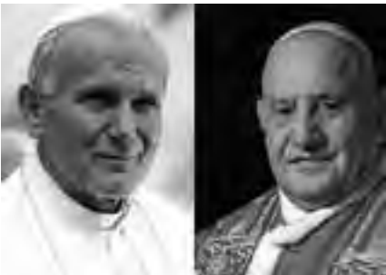
Juan Pablo II y Juan XXIII

El domingo 27 de abril en la Ciudad del Vaticano está programada la canonización de Juan Pablo II y Juan XXIII y el dato curioso es que el período que va del 26 al 28 de abril presenta un costo promedio de alojamiento de $ 2.516 argentinos, un 35% más que el de Pascuas.