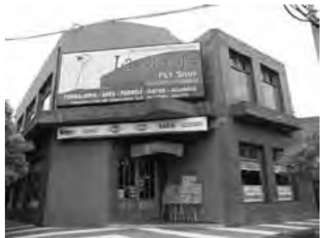
Frente actual de la Distribuidora Mayorista "La Granja" en 2014

"Hacemos extensivo el agradecimiento a los colegas que confiaron en nuestra Distribuidora, quienes trabajamos día a día en el fortalecimiento de la relación comercial" finalizaron diciendo.