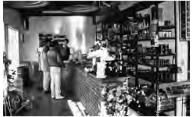
El inicio de "La Granja" fue en el año 1991. Comenzaron con el Acuarismo.