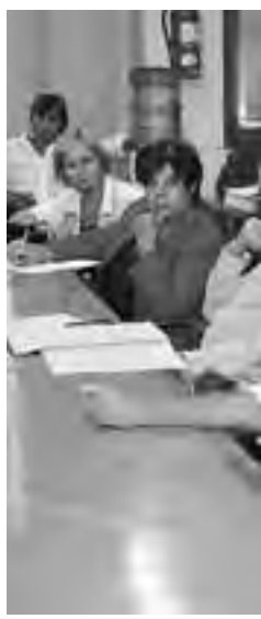
Los constructores solicitaron precios locales, tanto en materiales como en mano de obra, para hacer la redeterminación de precios que utiliza la provincia no puede ser por encima del INDEC.