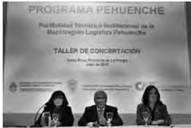
Foto de archivo de cuando se realizó el 'Taller de Concertación del Programa Pehuenche' en Santa Rosa, La Pampa, en el mes de julio de 2012.

Está a la vista que la Municipalidad de General Pico desde hace algún tiempo tiene inconvenientes comunicacionales, puede observarse en algunas cuestiones que atañen a la comunidad piquense que el Ejecutivo Comunal no ha tenido en cuenta a la hora de comunicarlas de manera oportuna. Considerado un despropósito por todos los medios de prensa de la provincia que vienen dando real difusión y seguimiento, y ge-