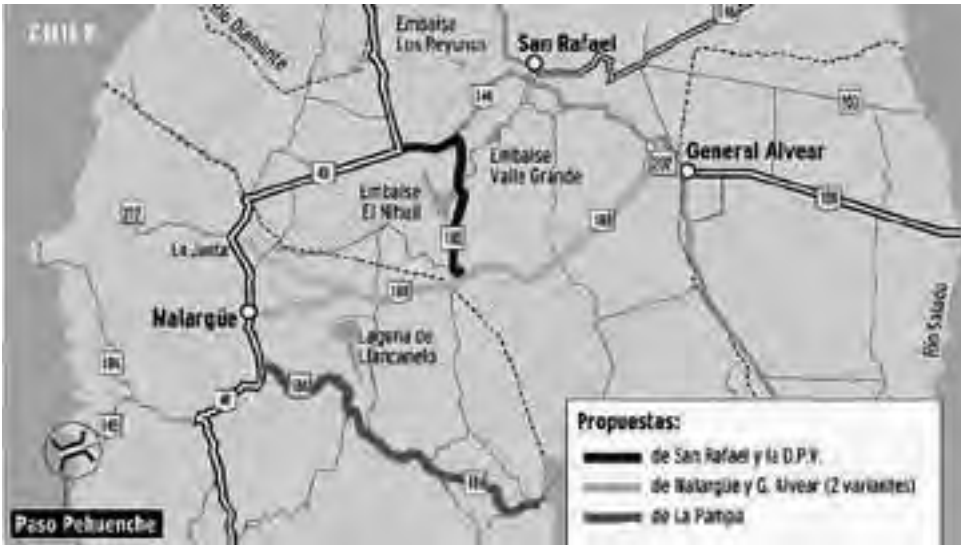
Por fin se empieza a considerar en las conexiones del Corredor Bioceánico, la necesidad de pavimentar de la RP N° 186 en Mendoza, continuación de la RP N° 10 en La Pampa que también falta pavimentar (entre el límite, zona de La Humada y Algarrobo del Aguila), aunque tiene fuerte oposición - Infografía del Diario Los Andes de Mendoza

El diario Los Andes de Mendoza, puso sobre la mesa la realidad de que Malargüe y General Alvear pugnan para que la ruta 188 finalice en la 40, mientras "se oponen al proyecto de desviar el camino hacia El Nihuil como propone San Rafael o por la Ruta 186 que sugiere La Pampa" señalaron, agregando que "desde Vialidad provincial tratan de conciliar posiciones."