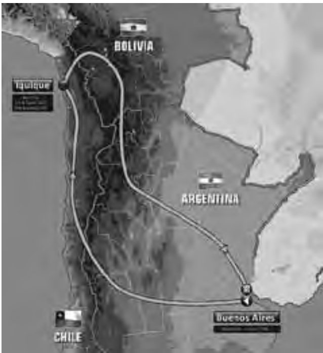
Esta vez parece que el "Rally Dakar Argentina - Bolivia - Chile 2015" no tocará suelo pampeano, pero por la experiencia de ediciones anteriores habrá que esperar a un dibujo más detallado de la ruta a fin de año.