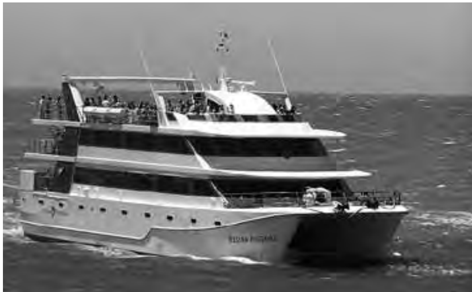
El "Regina Australe" comenzó a operar hace un año en Puerto Madryn, recorriendo las aguas del Golfo Nuevo.

Sus amplios salones también pueden ser utilizados para organizar eventos corporativos y sociales como desayunos de trabajo, Workshops, convenciones, conferencias, capacitaciones,