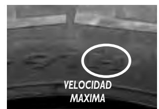
Tabla Velocidad Máxima

El rango de velocidad para el cual un neumático está diseñado, es indicado por una letra grande. La tabla adjunta muestra los rangos de velocidad en Km/h. En la foto de ejemplo, la letra «H» indica una velocidad máxima de 210 km/h.