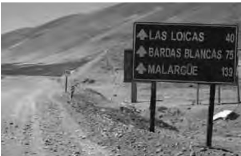
De los 75 km que hay del lado argentino entre el límite fronterizo El Pehuenche y la localidad mendocina de Bardas Blancas, medimos 57 kms que faltan pavimentar de la RN N° 145.

Chile ha gastado 200 millones de dólares en una obra inútil, y de alto costo de mantenimiento. ¿Cuándo terminará su tramo el gobierno argentino? ¿En cinco o diez años? (...)