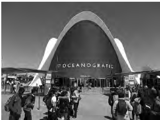
El Oceanogràfic, el mayor acuario de Europa con más de 500 especies marinas, es un punto para no dejar pasar por alto en una visita a Valencia.

Además Valencia es donde el Cid, el héroe nacional, luchó