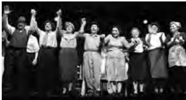
La troupe de "Las D'Enfrente"