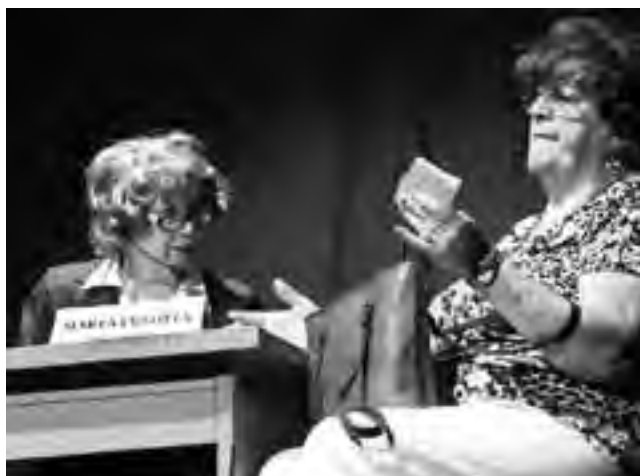
"Cuanto vale una heladera"

El grupo local de teatro "Brisas de Plata" se presentó en el Auditorio del Centro Municipal de Cultura, con tres divertidas obras, que hicieron reír y aplaudir a los presentes, en una sala colmada, con público hasta en los pasillos. Interpretaron en primer lugar, la desopilante historia de Claudia Piñeiro en "Cuanto vale una heladera", una humorada sobre la burocracia y el sin sentido de las grandes corporaciones, con enredos muy divertidos y una libre y desenfadada interpretación que arrancó carcajadas