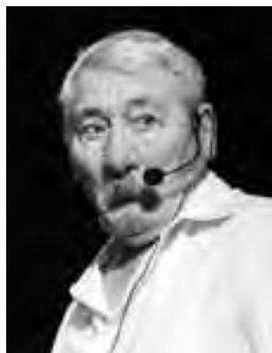
"Una bebida helada"

"Brisas de Plata" es un grupo que pertenece al Círculo de la Tercera Edad de Villa Alonso y esta enmarcado en los talleres que organiza PAMI.