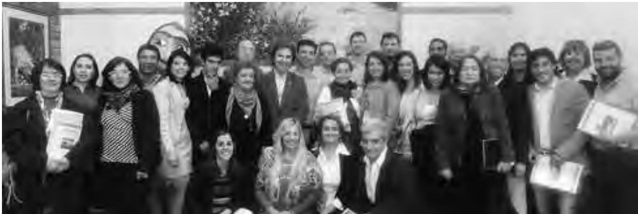
En el marco del Día Internacional del Turismo, y ante un importante marco de público vinculado con el sector, la Secretaría de Turismo provincial presentó el "Plan Estratégico para el desarrollo Turístico de La Pampa", un trabajo conjunto con las distintas áreas de Turismo municipales que desde tiempo vienen acompañando a la SecTur.