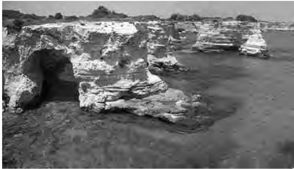
Playa de la Isla de Sant'Andrea, en la provincia de Lecce, un lugar espectacular que hay que conocer.

Tranquila y al mismo tiempo llena de vida. Los habitantes de Lecce buscan el relax en las innumerables terracitas callejeras, en los