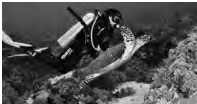
La principal atracción de la bahía de Ayangue, es la práctica de submarinismo de clase mundial, hasta donde llegan deportistas de todo el mundo.

ofrece toda su experiencia y también su técnica, para atender las necesidades de quienes deseen explorar la superficie y el fondo marino, apoyados en la docencia de su Centro de Buceo "Ray Aguila". Cuentan con embarcaciones, diversidad de equipos, recarga propia de tubos de aire, filmaciones, un desayunador y restaurante típico en la playa, hacen excursiones de pesca, paseos y todo lo que pueden ofrecer como operadores de buceo y agencia de viajes.