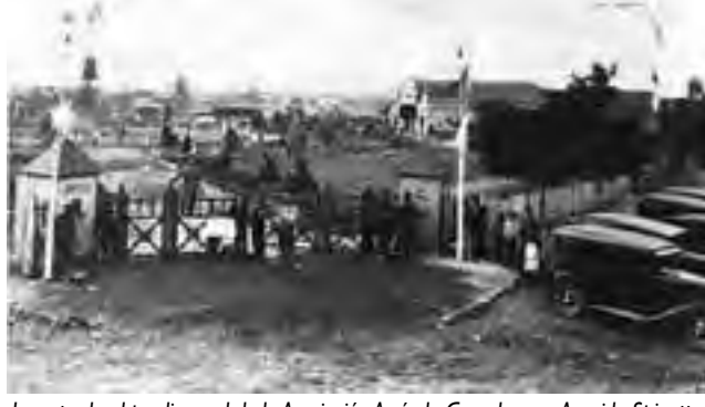
La entrada al predio rural de la Asociación Agrícola Ganadera en Avenida Spinetto y Gobernador Duval a principios del siglo pasado.