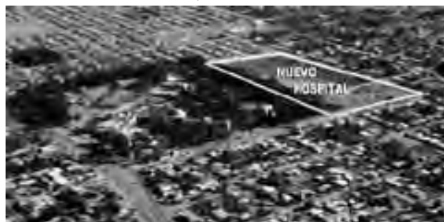
El nuevo centro de salud estará ubicado detrás del actual Lucio Molas.