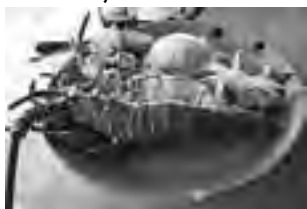
Un plato de langosta al ajillo, acompañado con arroz y verduras -una exquisitez-, se paga entre 7 y 10 dólares.

El alquiler de un auto económico para 4 personas, ronda entre 35 y 40 dólares diarios. Si es por una semana, baja bastante.