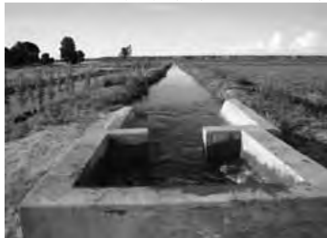
Canal de riego en Gobernador Duval, una de las zonas más productivas a la vera del río Colorado, merced al trabajo y el esfuerzo municipal, su población, empresarios y colaboradores. Los excelentes vinos logrados, han sido multipremiados.

Donde hace poco la trama del desierto no hacía previsible la prosperidad de ningún esfuerzo, merced al aprovechamiento del río y las más modernas tecnologías aplicadas, el Área Bajo Riego