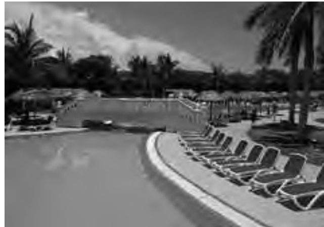
El Caribe y los hoteles todo incluido, una verdadera tentación.

Cancún: Es el destino más importante de México, sobre la Península de Yucatán. El mar es de un turquesa asombroso y aguas cálidas ideal para las actividades acuáticas. Además Cancún cuenta con diferentes parques temáticos, ruinas mayas y entretenimientos.