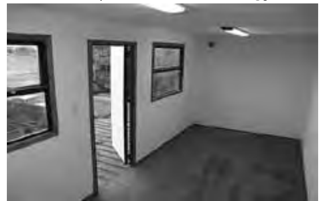
El límite de diseños solo tiene freno en la imaginación de cada uno. En muchos lugares del mundo se han atrevido a todo. Vean esta foto de abajo, en Austria.

"Estas cajas de medidas estandarizadas internacionalmente, son materia prima ideal para la construcción de módulos habitacionales, ya sea para vivienda individual, oficinas, talleres, espacios recreativos, obradores, puestos rurales, o cualquier uso que se le quiera dar" agregaron.