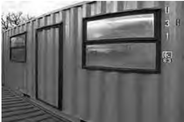
Cuando los contenedores marítimos son reemplazados, se reciclan como habitables.

Para más información y asesoramiento: BDIMAR Volúmenes , Av. Luro esquina Corona Martínez, Santa Rosa. Cel: (02954) 269458 y 299544. Correo electrónico: comercial.bdimar@gmail.com