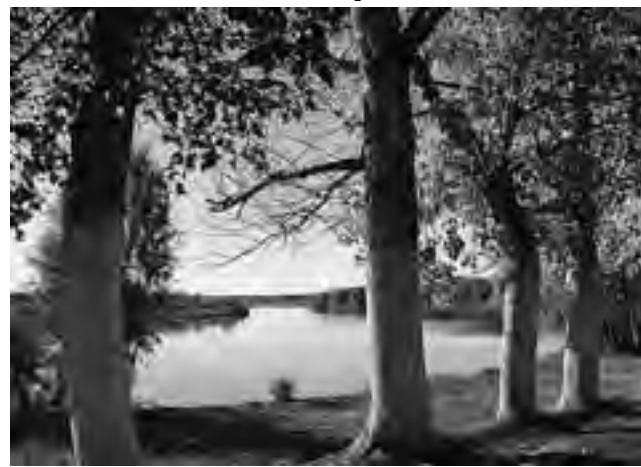
Este viernes 28 de junio, el Ente Provincial del Río Colorado cumple 51 años desde su creación en 1962. Hoy están bajo su control cuatro sistemas de aprovechamiento agrícola: El Sauzal, Planicie Curacó, Valle de Prado y Bajo de los Baguales y un sistema de aprovechamiento múltiple, el de 25 de Mayo.

La principal transformación fue la apertura a la colonización privada, que dió paso a grandes emprendimientos que hoy se encuentran