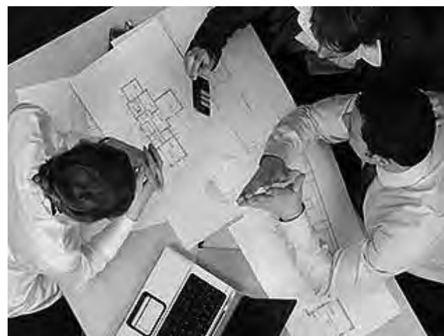
VIENE DE TAPA

Un arquitecto debe conocer los diversos sistemas constructivos, los materiales y las técnicas para dar respuesta a los requisitos del cliente, o las necesidades sociales, y cumplir las diferentes normativas para que la construcción pueda ajustarse a unos plazos y costos razonables.