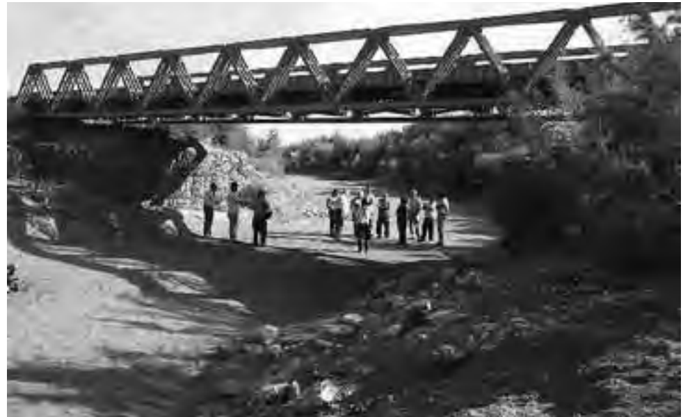
Mientras que en Mendoza el río Atuel corre caudaloso y es embalsado en forma repetitiva, en La Pampa suele caminar su cauce seco. (Foto de archivo: Walter Brandimarte - Por Asamblea Popular por los Ríos Pampeanos).

Ingresaba a La Pampa, antes de su alteración por la acción antrópica a comienzos del siglo pasado, a través de tres brazos principales y otros secundarios. Considerados de este a oeste, los brazos del Atuel, en La Pampa, eran: 1. El Atuel propiamente dicho, brazo mayor y más importante; 2. El arroyo de Las Tinajeras, un brazo pequeño; 3. El brazo Butaló, llamado localmente "arroyo"; 4. El arroyo de Los Ingenieros, otro brazo pequeño y 5. El arroyo de La Barda, cuyo lecho es en la actualidad el único en condiciones de escurrir caudales. Había otros cauces menores que se vinculaban con los más caudalosos, determinando un dédalo de arroyos e islas.