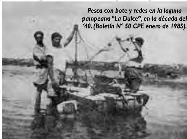
Pesca con bote y redes en la laguna pampeana "La Dulce", en la década del '40. (Boletín N° 50 CPE enero de 1985).

En una colaboración de lujo del Dr. Pedro Álvarez Bustos, reseña la historia de la pesca deportiva y comercial (y hasta un proyecto turístico) en el oeste provincial, cuando aún las aguas del Atuel no habían sido negadas.