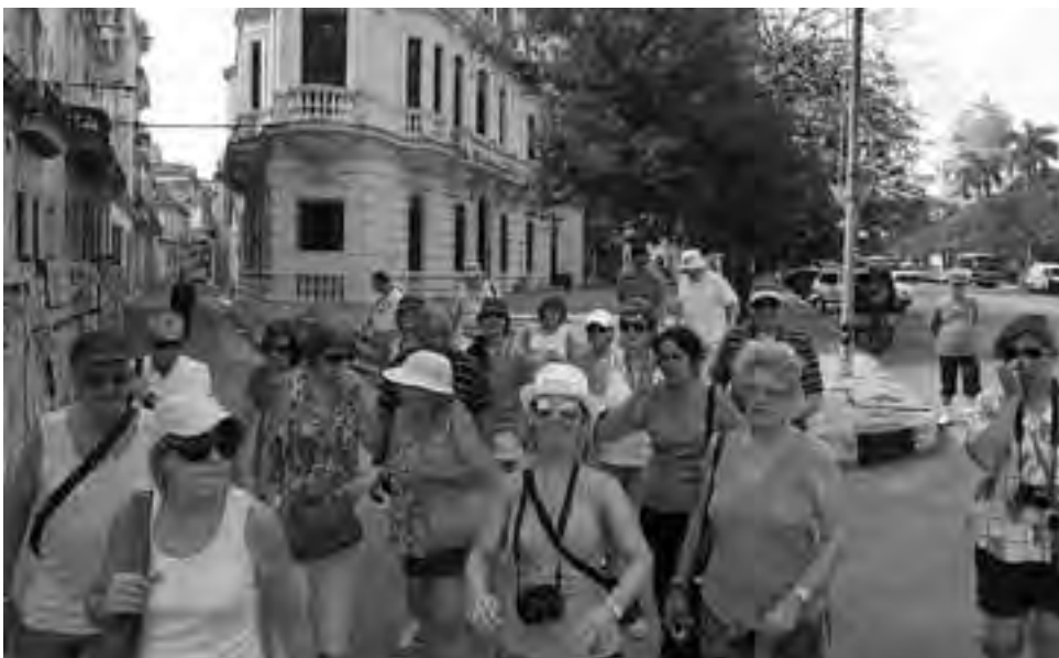
La Pampa podrá "escaparse" de viaje a partir del sábado 13 de julio. Desde ese día y hasta al domingo 21, es la semana vacacional complicada, porque en esos días coinciden las salidas turísticas de todo el país. Haga sus reservas con tiempo.

De todas maneras, la diversidad de fechas favorece las posibilidades tanto para los viajeros, como para los prestadores de servicios turísticos, ya que las reservas hoteleras no se saturan por demás,