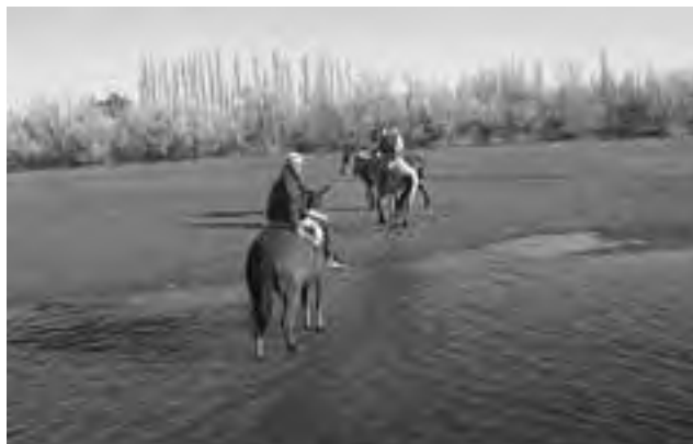
Cabalgata por el Río Colorado, La Adela, La Pampa.

La Secretaría de Turismo comunica que se encuentra disponible la Guía de Asistencia Financiera 2013 para el pequeño y mediano inversor y la Guía de Asistencia Financiera 2013 para microemprendimientos turísticos, conteniendo las líneas de crédito aplicables a emprendimientos privados del