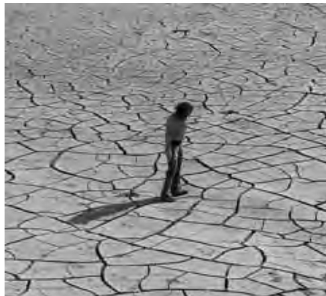
Zona de 25 de Mayo, provincia de La Pampa.

Este lunes 17 de junio se recuerda el "Día Mundial de la lucha contra la Desertificación y la Sequía" y en la Reserva Provincial Parque Luro se realizarán actividades relacionadas a la sensibilización sobre esta temática, como parte del programa de difusión