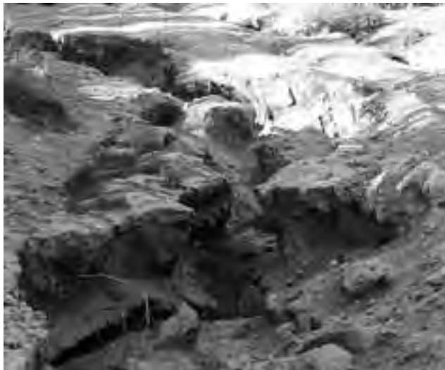
Zona seca de la Reserva Provincial Parque Luro.