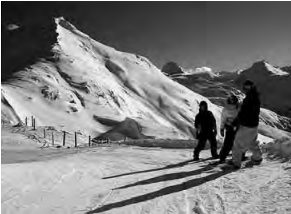
Con la postal blanca instalada en todos los destinos de nieve patagónicos, los centros de esquí ya confirmaron las fechas de apertura y dieron a conocer sus novedades para este invierno. En tanto La Pampa promociona su autódromo y Turismo Rural.

La llegada de la nieve a la Patagonia no se hizo esperar. El sur argentino ya está teñido de blanco y los centros invernales alistan los últimos detalles para inaugurar oficialmente la temporada 2013. Todos ellos presentan novedades en infraestructura y servicios, y prometen una atractiva agenda de eventos.