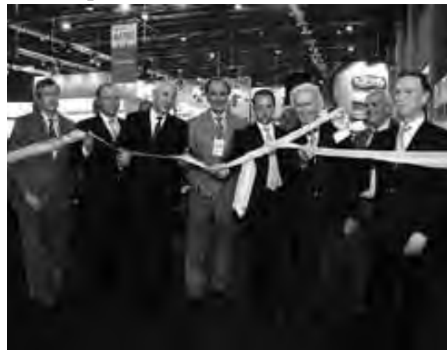
Acto inaugural en La Rural, Predio Ferial de Buenos Aires. La próxima edición de Batimat Expovivienda será del 3 al 7 de junio de 2014.

La reciente edición de "Batimat Expovivienda 2013" se destacó nuevamente como un ámbito ideal para el encuentro de todos los representantes de la cadena de valor de la industria de la construcción y la vivienda. Se congregaron en La Rural, Predio Ferial de Palermo, miles de arquitectos e ingenieros, desarrollistas, consultores, téc-