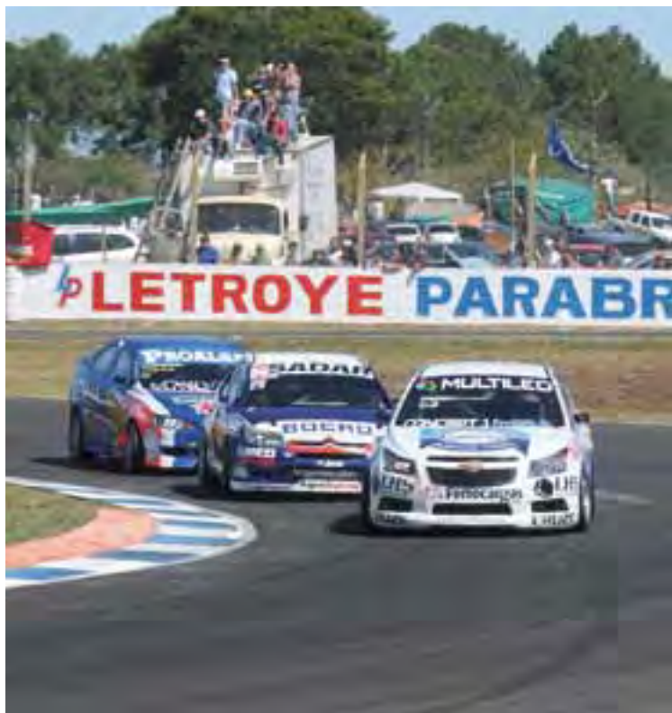
TABLA DE POSICIONES DEL CAMPEONATO CLASE 3

Nacional en el Gran Premio Casinos de Entre Ríos que se corrió en el Parque Autódromo Ciudad de Concordia, con el Chevrolet