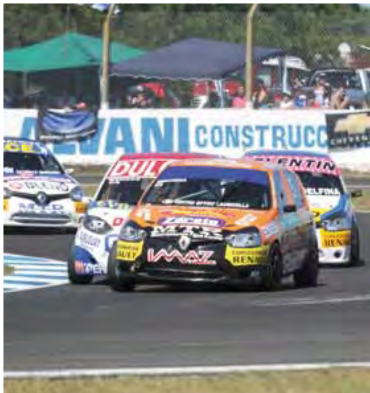
TABLA DE POSICIONES DEL CAMPEONATO CLASE 2

En una prueba que culminó con un fuerte golpe entre los Fiesta