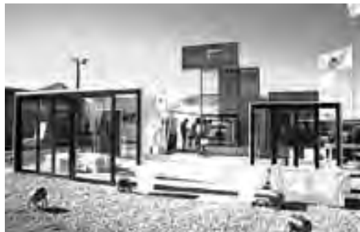
Stand industrial de "Abertecno".