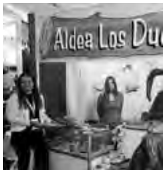
Stand de servicios de "Aldea Los Du...".