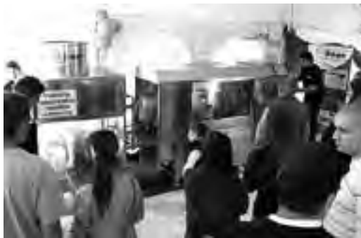
Stand industrial de "Máquinas Bono".