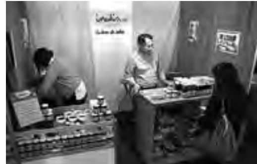
Stand gastronómico de "Productos India".