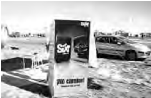
Stand de servicios de "SIXT".