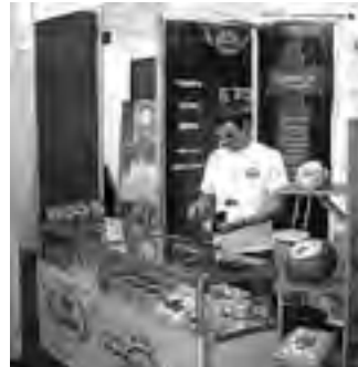
Stand gastronómico de "De...".