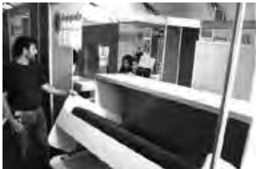
Stand industrial de "Rosignolo Carpintería".