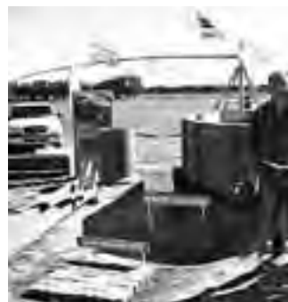
Stand industrial de "Aguadas".