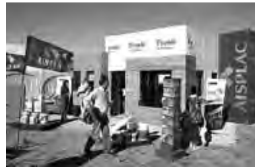
Stand industrial de "Aisplac".