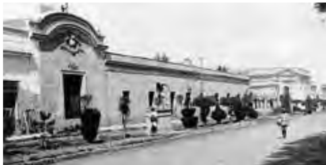
Frete de la Municipalidad de Santa Rosa hace un siglo atrás.

Con motivo del aniversario de Santa Rosa, el Archivo Histórico "Hilda Paris" y la Dirección de Prensa, Difusión y Ceremonial de la Municipalidad de Santa Rosa organizan visitas guiadas al municipio, destinadas a alumnos de 6° grado de las Escuelas Primarias, de las Escuelas Especiales N° 1 y 2 y de Centros Educativos de las Escuelas para Adultos y Jóvenes. Dicha actividad se desarrollará a partir del 22 de abril y a través de ella se pretende introducir a los alumnos en un breve recorrido por la historia de la vida municipal, y aprovechando este acercamiento, posibilitar que los estudiantes puedan conocer y diferenciar los distintos actores, tanto del poder Ejecutivo como del Legislativo. Tendrán la oportunidad también de recorrer las distintas dependencias donde se realizan las tareas administrativas específicas a cada área como así también