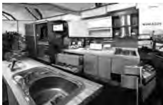
Stand industrial de "Monlezun".