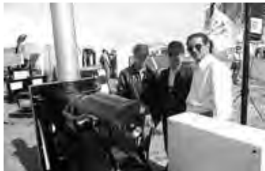
Stand industrial de "Grupos Electrógenos Piana".