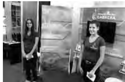
Stand de servicios de "Desinfectadora Cabrera".