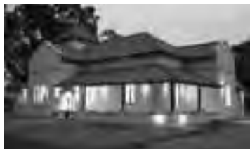
Foto de las ruinas de la Estancia La Malvina, comparada con una imagen de nuestros días, luego de su recuperación. La casona, hoy sitio turístico-cultural, forma parte de los atractivos del Parque Don Tomás, en Santa Rosa.