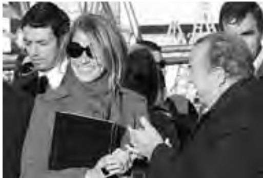
La presencia de la ministra nacional de Industria, fue un importante respaldo para el gobernador Oscar Jorge.

Las presentaciones se realizaron por sectores productivos con la posibilidad de integrar negocios entre empresas. "Los expositores se fueron muy conformes, inclusive algunos nuevos se vieron sorprendidos por la magnitud de las consultas que tuvieron", afirmó el ministro. Hubo problemas de circulación en el acceso durante la tarde del sábado, con una estimación de 25.000 personas.