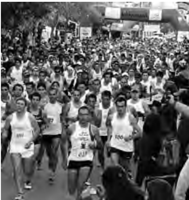
A tener en cuenta también, fue el gran número de participantes que alcanzó los 868 atletas, superando la cifra de la edición anterior.