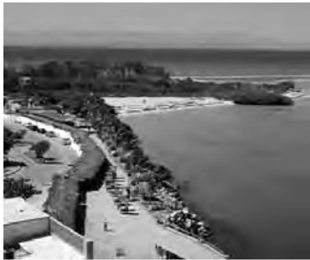
Playa El Agua, Isla Margarita, Venezuela.

La Isla de Margarita está ubicada en el mar Caribe, junto a otras, como Coche y Cubagua, siendo el único estado insular de Venezuela, denominado «Nueva Esparta».