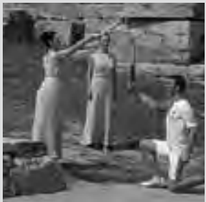
Representación en Olimpia, Grecia.

Los Juegos Olímpicos, comenzaron en la antigua ciudad de Olimpia, en Grecia, en el año 884 antes de Jesucristo, y se celebraron durante 1.200 años, hasta el 394 en que fueron suprimidos.