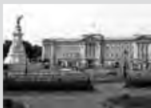
Palacio de Buckingham, causal del recorrido que dió la distancia actual.

Resultó entonces, que la distancia existente entre la meta