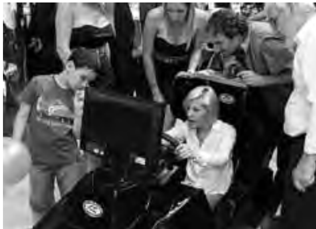
En la Carpa de Turismo habrá un simulador de TC para probar el manejo digital de un auto de la categoría, un entretenimiento informático que se podrá utilizar gratuitamente.

Este viernes 12, sábado 13 y domingo 14, Expo PyMEs 2013 estará abierta al público en forma gratuita en el Autódromo Provincia de La Pampa, ubicado en la Ruta Provincial N° 14 entre la Ruta Nacional N° 35 y Ruta Provincial N° 9. Impulsado y organizado por el Gobierno Provincial en forma conjunta con el Consejo