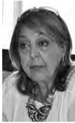
mucho más inclusiva en este sentido.

"Queremos salir de la queja de la situación y ponernos a trabajar para que, entre todos los miembros de la sociedad, involucrándonos, participando y aprendiendo, porque esta también es una tarea en la que hay que desmontar pautas culturales de muchos años, poder aportar a una sociedad mejor, a una sociedad