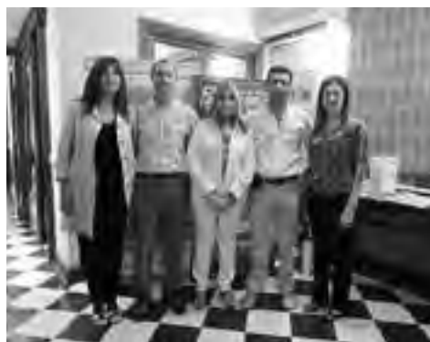
La delegación pampeña en Buenos Aires.

En tanto, la práctica de la caza mayor y menor en La Pampa está reglamentada por normas que tienden a la conservación de la fauna silvestre, permitiendo la actividad únicamente en ciertas especies y en determinada época del año. Para desarrollar la actividad se requiere el per-