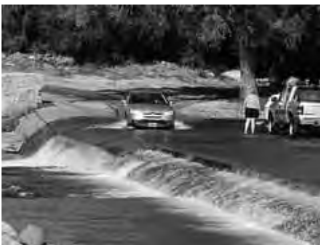
(Viene de la semana pasada)

El norte de San Luis como alternativa muy especial