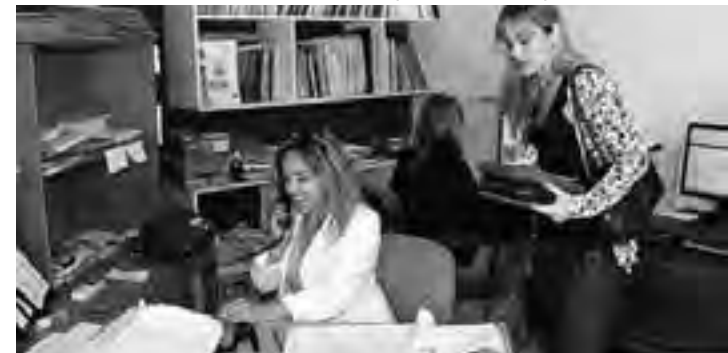
La tarea del Consejo Provincial de la Mujer es dinámica, polifacética y de gran demanda. Sabemos del arduo trabajo de las personas encargadas de atender las necesidades del área.

El músico y director de orquesta sostuvo que "la mujer ha sido y será fuente de inspiración y por ello hemos tratado de concentrar 200 años en donde la estética y el tratamiento de la música se pueden traducir en las obras que serán puestas en escena", informó. Los conciertos serán en el Teatro Español, a partir de las 21hs, con entrada libre y gratuita; y contarán con una sorpresa que tiene que ver con una puesta en escena.