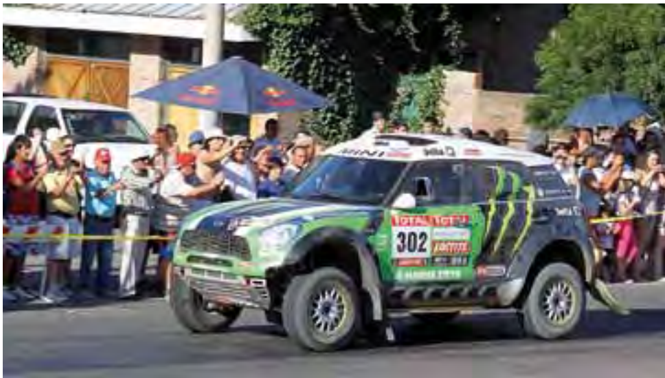
El francés Stephane Peterhansel ganador este año en la categoría autos, con Mini, a su paso por Santa Rosa. Si bien el año próximo el rally no pasará por La Pampa, los entusiastas podrán ver la competencia en provincias vecinas, muy cerca.