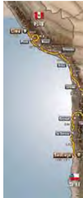
El trazado en Argentina incluye Jujuy, Santiago del Estero, Córdoba