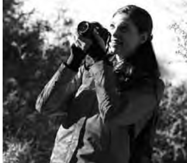
Como parte de la sustentabilidad turística, la defensa de la ecología y el conocimiento del medio ambiente, está la actividad de la observación de aves.

4-Sustentabilidad, Ecología y medio ambiente: Para nadie es un secreto todos los cambios climáticos que están ocurriendo en el planeta, debido al calentamiento global y otros fenómenos. El incremento de la preocupación por el medio ambiente y su conservación ha generado un nuevo grupo turístico, que se dedica a vacacionar en lugares o parajes que permiten un mayor contacto con la naturaleza, fomentando así el cuidado a la biodiversidad de la región visitada, teniendo en consideración sus características medioambientales, su gente y sus costumbres; este tipo de turismo es también una oportunidad para desarrollar las economías locales y apoyar el comercio justo. Esto ha ocasionado el surgimiento de modalidades como: agroturismo, turismo ecológico, sustentable, consciente, rural, responsable, etc. Sustentabilidad: es la capacidad de satisfacer las necesidades ambientales, culturales, sociales y económicas de las presentes generaciones, sosteniéndolas en el tiempo sin comprometer las mismas para que también puedan disfrutarlas otras generaciones. Algunas de sus vertientes son: