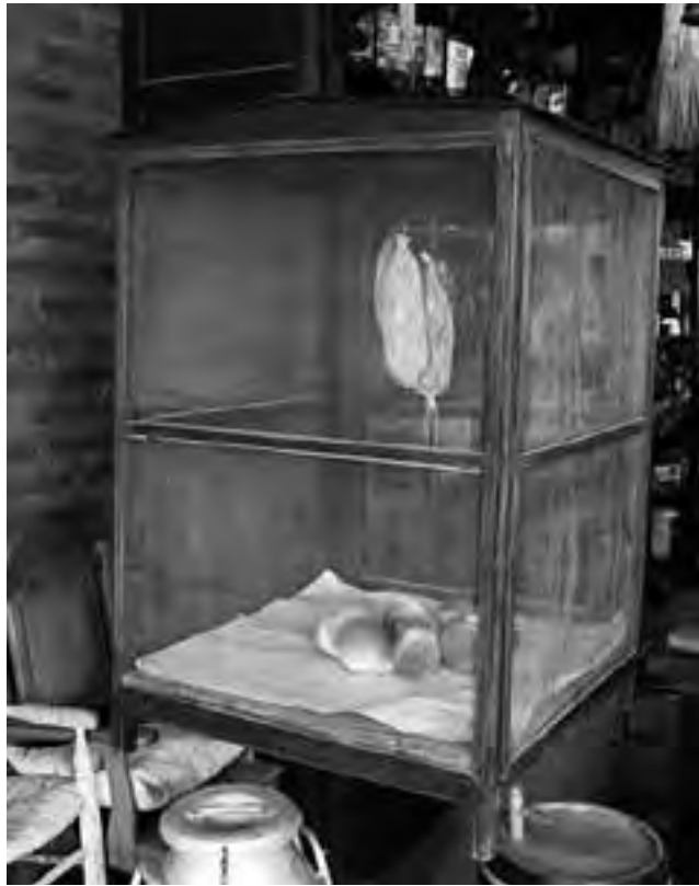
Clásica fiambreira de campo, rodeada de una malla que permitía pasar el aire -donde lo producido reposaba esperando el momento justo-, evitando que ingresaran insectos o alimañas. Por precaución de otros animales, generalmente se las colgaba en altura. La de la foto, aún se puede ver en el Restaurante-Museo de Campo "María Castaña", de Toay, ambientado como pulpería o viejo almacén.

La jornada comenzaba muy de madrugada, con el encendido de una gran fogata y la colocación de grandes tachos para calentar agua, que coadyuvará a la preparación, pelambrea y limpieza de los cerdos. Era costumbre generalizada que se sacrificaran dos o más, de alrededor de 200 kilos c/u; es decir, "chanchos adultos". Con posterioridad a ello se