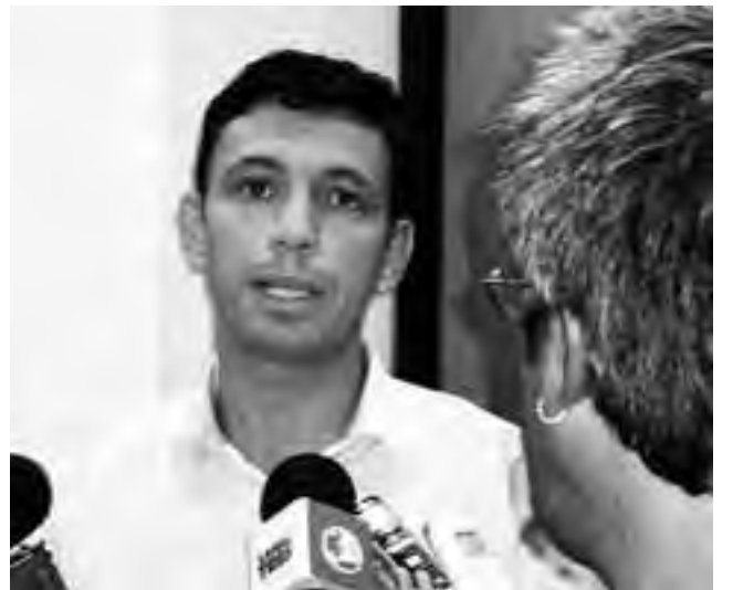
El secretario de Turismo, Santiago Amsé, dio detalles a la prensa.