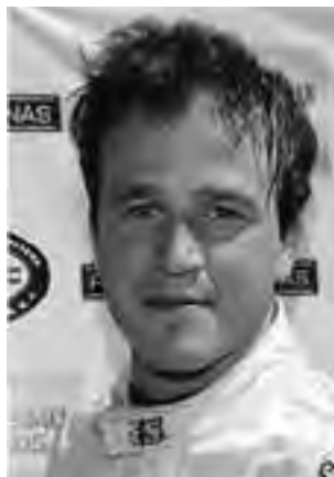
Canapino es el puntero, pero tiene que ganar una carrera para salir campeón.