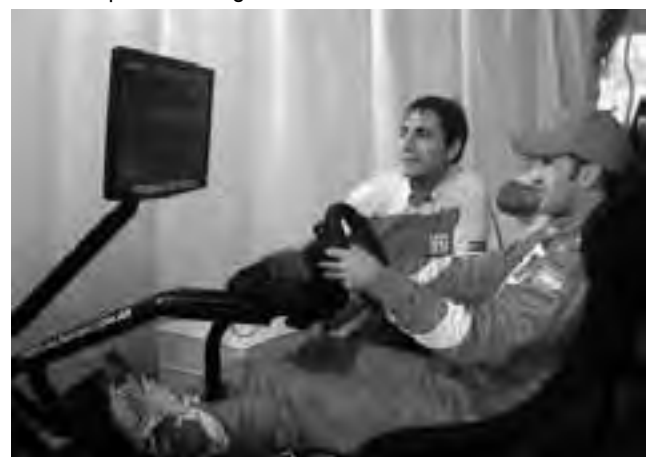
El stand pampeano tendrá un simulador de manejo de Turismo de Carretera.

-Profesionales del sector exclusivamente: lunes 5 y martes 6 de 10 a 19 hs.