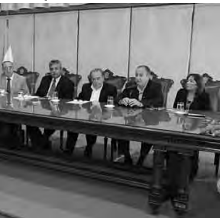
de distintas cámaras empresariales, todos quienes coincidieron en destacar la importancia que Provincia. Sólo los hombres mayores de 16 años y menores de 64, pagarán entrada.

"que todo esto contribuya para posicionar a La Pampa a nivel nacional".