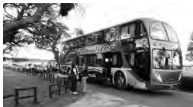
La Secretaría de Turismo contó con la colaboración de la empresa Chevallier, quien puso a disposición un coche cama para el transporte desde Santa Rosa.