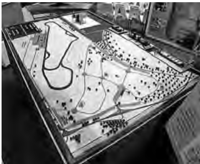
El sábado 3 a las 15:30 horas, en el Auditorio "Coris", el gobernador de La Pampa, Oscar Jorge, realizará la presentación oficial del "Autódromo Provincia de La Pampa", previo a la inauguración una semana después, con la 15ta fecha del Campeonato Nacional de Turismo Carretera.

-Profesionales del sector exclusivamente: lunes 5 y martes 6 de 10 a 19 hs.