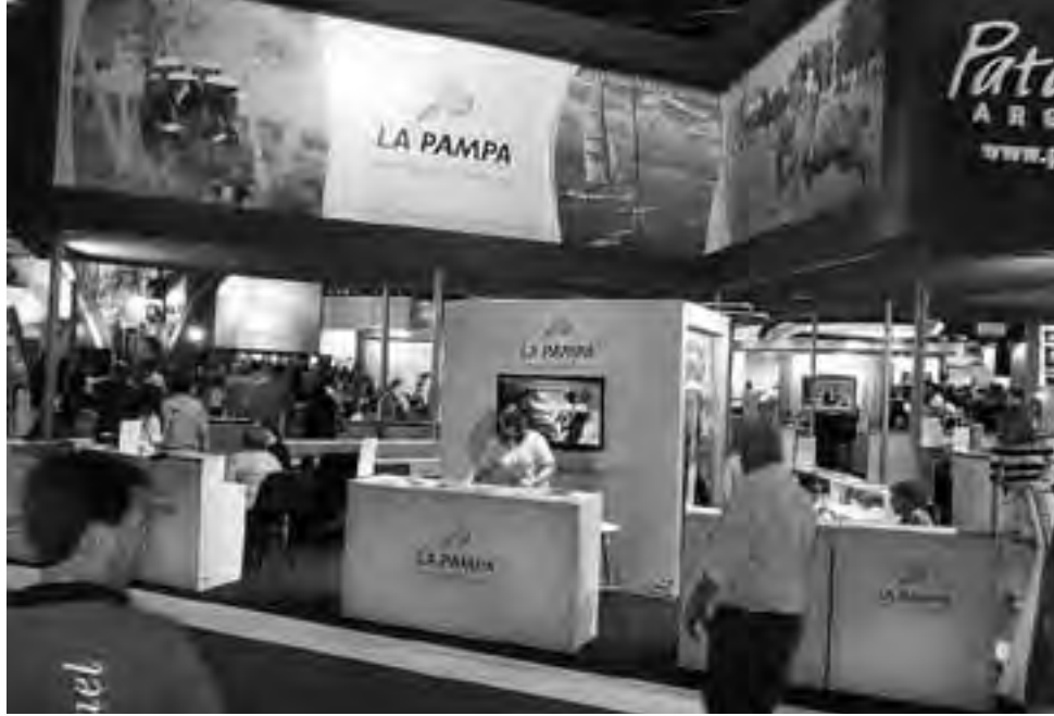
La feria anual más importante en Argentina, se desarrolla el primer fin de semana de noviembre. Turismo de La Pampa participará nuevamente, acompañados con buena presencia de empresas privadas del sector y entidades representativas. Allí será el lanzamiento oficial del nuevo "Autódromo Provincia de La Pampa" a inaugurarse una semana después.