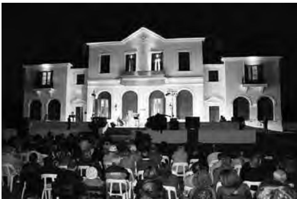
Se alquilaron 400 sillas para el evento y hubo que traer además, todas las del Centro de Interpretación. Mucho público siguió el consejo de llevarse sus propias playeras y aún así, otros muchos debieron sentarse en el césped o estuvieron parados.