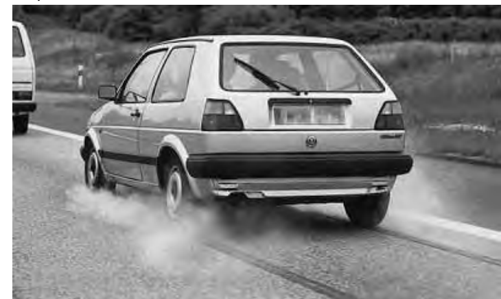
Hoy es fundamental la "seguridad activa". Ningún auto debería venir sin ABS.

Dirección asistida. Mecanismo por el cual se reduce el esfuerzo que debe hacer el conductor para mover el volante. Actualmente hay tres sistemas para hacerlo: hidráulico, electrohidráulico y eléctrico.