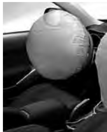
Ya todos sabemos que son los "airbags", pero

Airbag . Se trata de un sistema de seguridad complementario del cinturón que se utiliza para reducir el riesgo de lesiones graves en la cabeza y el tórax en choques intensos: frente a un impacto, los sensores alertan al sistema de control, que activa el inflado de las bolsas de aire.