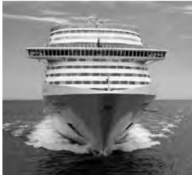
VIENE DE TAPA

Las agencias de viajes en general, como es habitual, reciben poca atención por la compra de destinos nacionales, en tanto que se sigue vendiendo hasta último momento salidas en Cruceros, Brasil, Caribe y Estados Unidos, con el inconveniente de conseguir dólares para los gastos corrientes, pero los argentinos siempre encuentran la forma de superar las vallas.