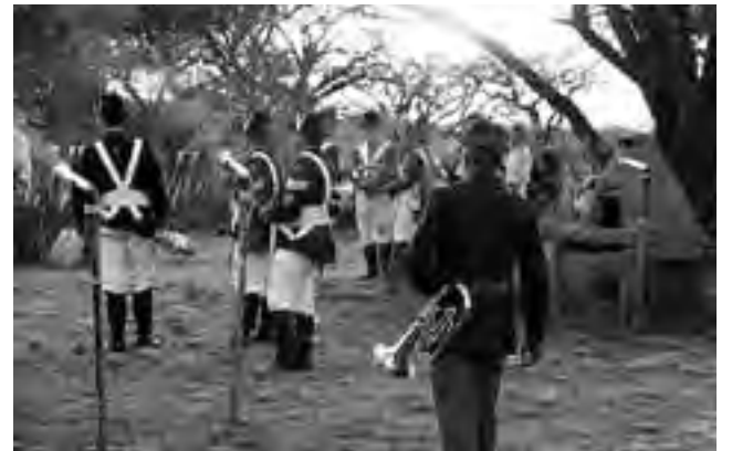
Muy buena recreación, música y danza, con esta "retreta", donde se conjugó un espectáculo único al caer la tarde en pleno campo pampeano.