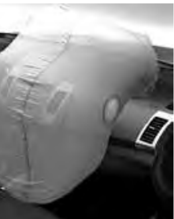
Hay muchos otros términos menos populares.

conoce como ASR (Automatic Stability Control o Anti-Slip Regulation).