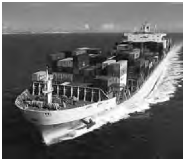
Más de cuatro siglos después de aquel primer embarque exportador, gigantescas naves siguen surcando los mares intercambiando mercaderías.

Este domingo 2 de septiembre se recuerda en nuestro país el "Día de la Industria Nacional", fecha que conmemora el primer embarque para exportación de nuestra historia, que dio nacimiento también a la Aduana, en 1587, cuando partió del Puerto de Buenos Aires la nave San Antonio, rumbo al Brasil, llevando a bordo fundamentalmente productos