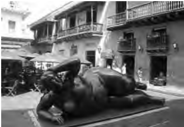
Ciudad Vieja en Cartagena de Indias, Colombia. Un paseo cautivante

La temporada de cruceros por el Caribe va desde el mes de octubre a mayo. Los cruceros embarcados desde Colombia se han convertido en una de las mejores opciones para visitar Cartagena de Indias y recorrer los distintos parajes de ensueño del Caribe.