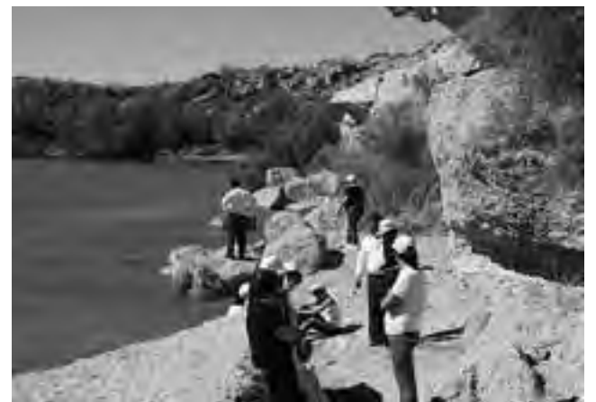
Circuito 2: un paisaje de bardas con restos fósiles marinos.