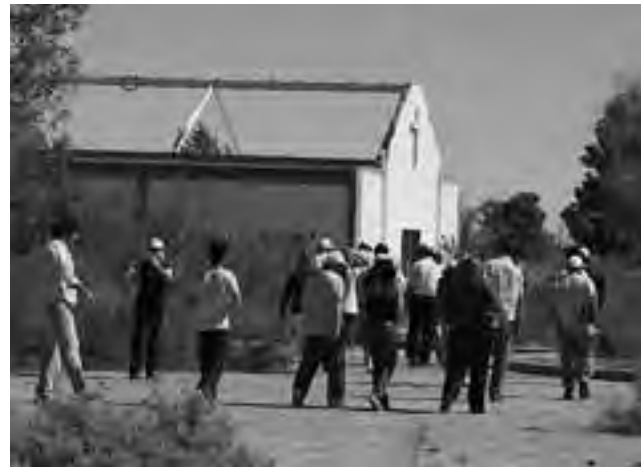
Circuito 1: la antigua Villa Transitoria, que albergó a los ingenieros y trabajadores que llevaron adelante la obra de Presa - Embalse Casa de Piedra.

Personal de la Secretaría de Turismo, visitó la Villa Turística Casa de Piedra para trabajar en el desarrollo de cuatro circuitos turísticos.