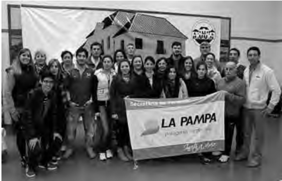
La delegación pampeana que viajó a la provincia de Chaco al 2º Encuentro Federal.

En cuanto al Turismo futuro, el evento aborda los desafíos que presenta el uso de la cibernética en la difusión y comercialización del turismo; la importancia de