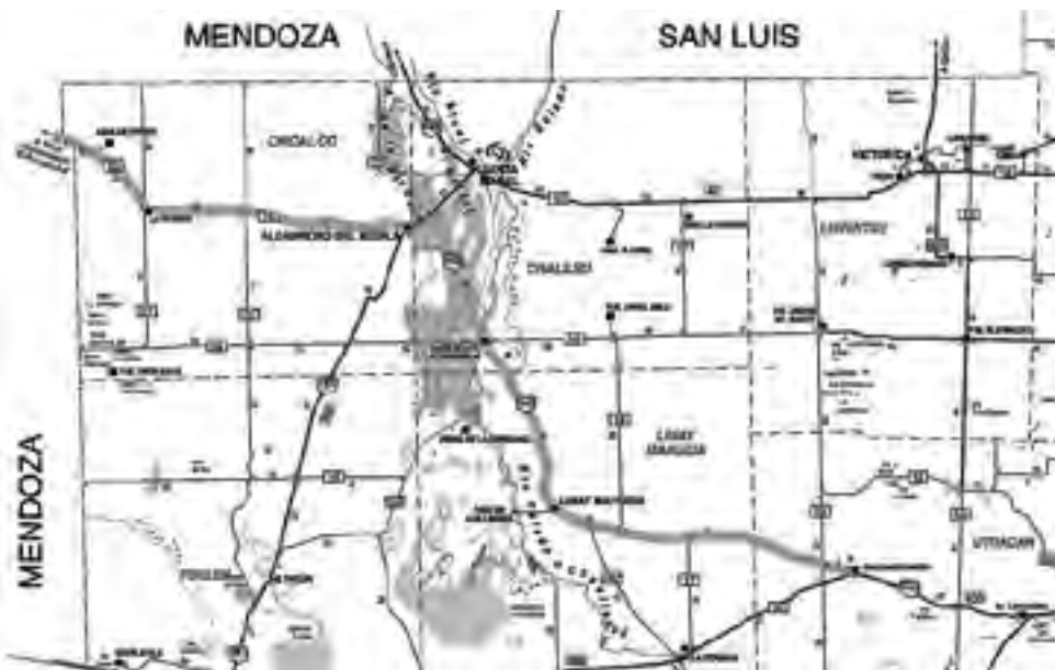
El tramo grueso corresponde a la actual Ruta Nacional N° 143 y Provincial N° 10 -ambas de tierra-, que tras su pavimentación conformarían el recorrido vial más corto y directo, para unir puertos argentinos y chilenos por el paso El Pehuenche.

Ahora, cuando ya el paso binacional El Pehuenche está a punto de quedar definitivamente habilitado en 2012, las provincias involucradas empiezan a definir posiciones y en el caso de La Pampa, según pudimos saber, es un hecho que la