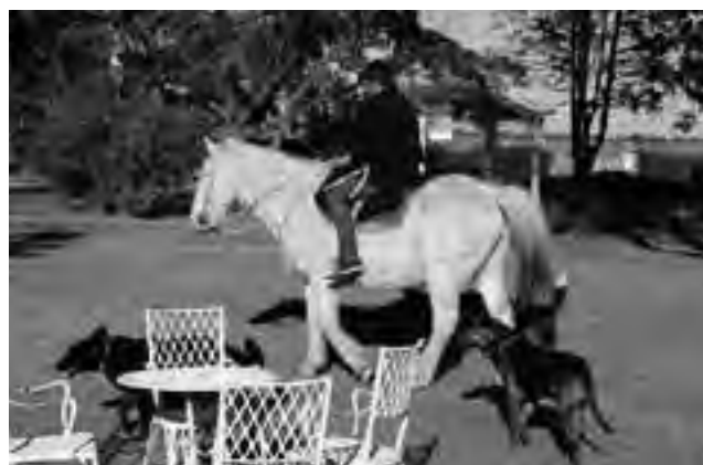
Día de Campo con cabalgata en una estancia turística pampeana.