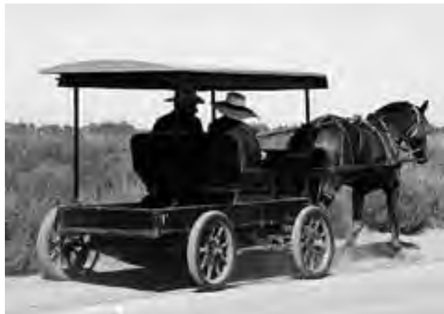
Carruaje típico de la Colonia Menonita.

Las pulperías y boliches de campaña fueron toda una institución en el progreso de la región pampeana. El avance los fue haciendo desaparecer uno a uno hasta transformarlos en exóticos recuerdos de la literatura gauchesca. Hoy, sin embargo, está latente, viva a los ojos y en el corazón del pampeano la "Pulpería de Chacharramendi", también conocida como Boliche de Feito o El Viejo Almacén, un Parador