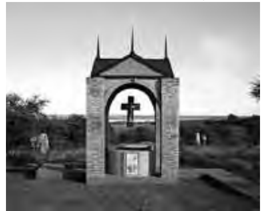
Cristo de la Salud, en Guatraché.

www.termasdeguatrache.de Celular: (02923) 15657606