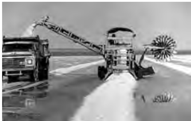
Cosecha de Sal en la Comarca de las Salinas.

En casi todos los establecimientos de la Provincia -previa reserva- se puede disfrutar de un día o me-