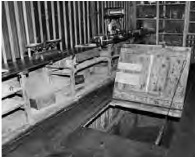
Antiguo sótano y a la vez escondite de la Pulpería de Chacharramendi.

-Guatraché cuenta con buena hotelería y prestadores de servicios que hacen excursiones como Circuito Histórico, Circuito Productivo, Visita al Cristo de la Salud y Colonia Menonita, un asentamiento religioso conservador al que sólo se accede con guía autorizada, para recorrer y conocer sus vivencias, adquirir productos artesanales y hasta compartir un almuerzo en una casa de familia de colonos. Consultas: Carmelo Viajes (02923) 15426936