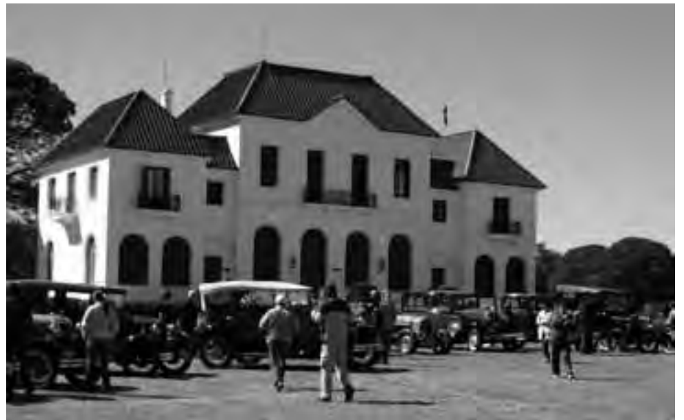
Los autos participantes, a su paso por la Reserva Provincial Parque Luro, en anteriores ediciones.

La largada simbólica será este sábado 18 desde la rampa ubicada en el casino, con un show de fuegos artificiales y el acompañamiento musical de la Banda del Ejército. Luego los autos serán expuestos en la Plaza San Martín. Mientras que la competencia en sí se pondrá en marcha a las 9 de la mañana del domingo 19 desde la avenida Circunvalación.