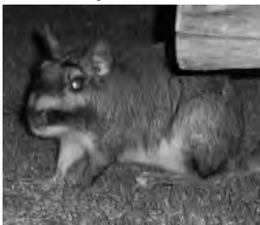
La idea es controlar la excesiva población de especies exóticas y promover el regreso de las autóctonas como la vizcacha.