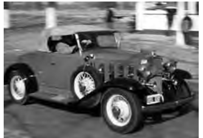
Son tres categorías: velocidad baja (hasta 57 km/hora), velocidad media (70 km/hora) y velocidad alta (90 km/hora). La baja es de autos Vintage -1931, como éste que vemos en la foto- y micro autos.

donde se combina el deporte motor con el pasado cultural de otros tiempos, que muchas veces los participantes reviven con vestimenta de época, en distintas expresiones sociales que forman parte de esta gran fiesta, que una vez más se instala en La Pampa durante el fin de semana largo.