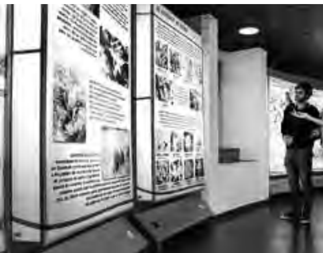
Centro de Interpretación Reserva Provincial Parque Luro.