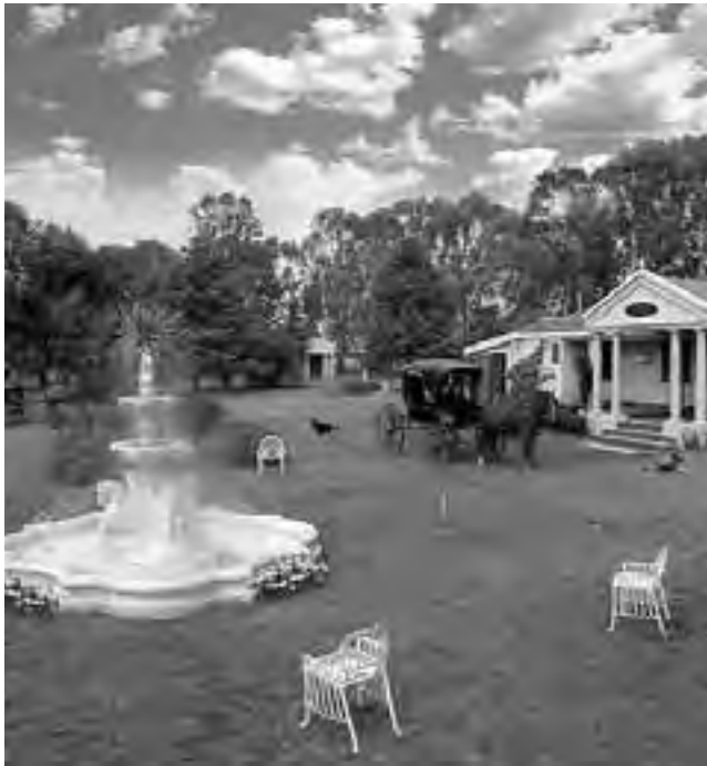
Estancia Turística "Villaverde" en Santa Rosa.

El turismo rural en La Pampa es uno de los temas periodísticos que se plasmarán como atractivos centrales de la provincia de La Pampa.