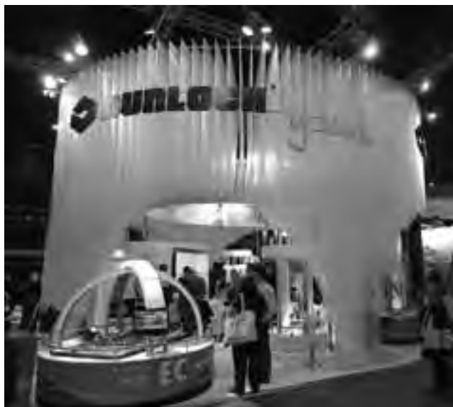
Stand de Durlock en "Batimat Expovivienda 2012".