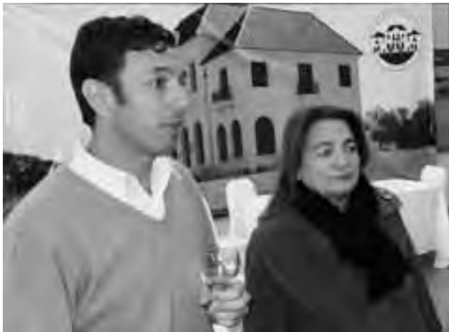
Secretario de Turismo Amsé y presidente de Catulpa Nemesio.

Con motivo de haberse recordado el jueves 7 de junio el día del periodista, la Secretaría de Turismo de La Pampa convocó a representantes de los medios locales a un ágape regional, donde pudimos degustar finos productos pampeanos de chacinados "Lemún" y vinos "Quietud".