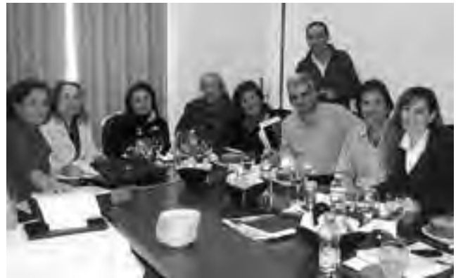
La Cámara aprobó el programa de Concientización Turística 2012 por el cual se realizarán charlas informativas en Colegios, Institutos y a la comunidad en general, relacionadas con transporte, hotelería, gastronomía, servicios, excursiones, arte, cultura, actividades en comunidades indígenas, turismo rural y comercio.