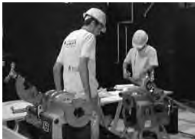
3º Competencia Nacional de Formación Profesional de la Fundación UOCRA