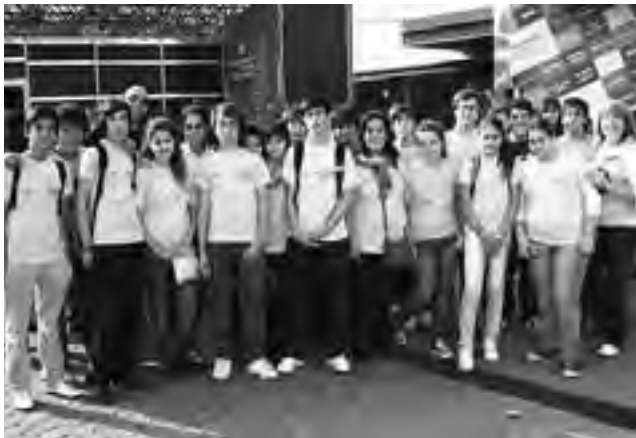
Alumnos del Club de lectores en la 38ª Feria Internacional del libro.