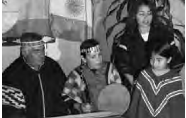
El Ente Oficial de Turismo Patagonia Argentina y el Ministerio de Turismo de la Nación intensifican acciones de prensa para incentivar el mercado interno. Turismo rural, cultura ranquel y avistaje, son los temas periodísticos que plasmarán notas que reflejen los atractivos de la provincia de La Pampa.