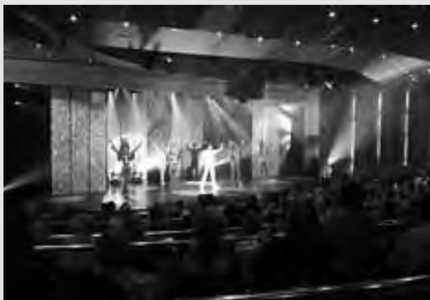
La noche reúne a todos en el gran teatro a bordo.

Si fuera necesario, los barcos cuentan con servicio médico.