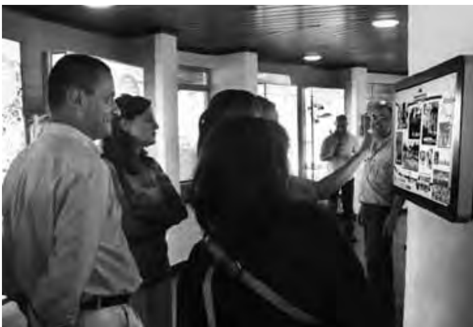
Con la presencia de autoridades nacionales, provinciales y municipales, fueron presentadas las nuevas obras de modernización y actualización tecnológica realizadas en la Reserva Provincial Parque Luro.

Amsé explicó que la Reserva ahora cuenta con nueva panelería lumínica informativa; sistema kiosk multimedia touchscreen de 32 pulgadas con información sobre la Reserva y el turismo pampeano; pantalla, proyector, reproductor de DVD, equipo de sonido, además de un nuevo video sobre la Reserva (realizado por Juan Carlos Gerardo) en formato panorámico 16:9 y sonido de alta definición, que fue exhibido a continuación.