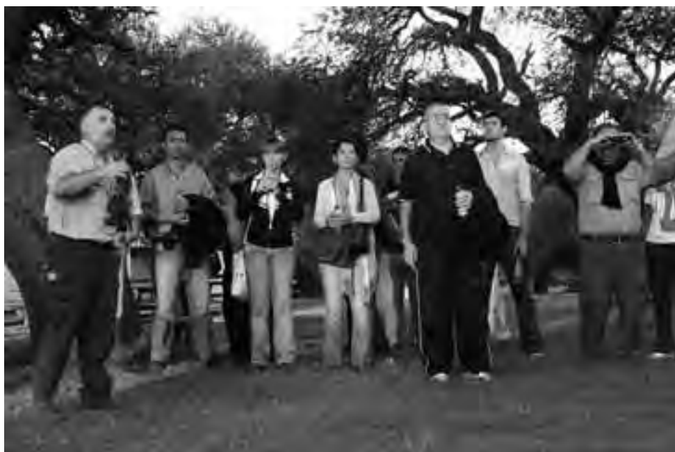
Luego de la recorrida por el Centro de Interpretación, se realizó la primera salida guiada del año de Avistaje de Ciervos en Brama, que tuvo además una sesión de observación astronómica.