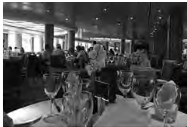
Seis comidas diarias garantizan que nadie pasará hambre. Lujosos restaurantes y buffets grills o pizzerías autoservice intercalan horarios durante todo el día.

De todas maneras es recomendable llevar algunos billetes encima