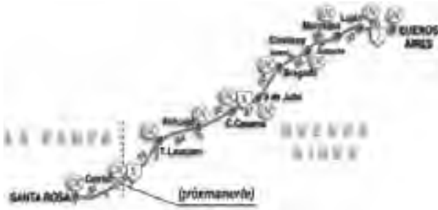
Recorrido actual de la RN N°5 con estaciones de GNC