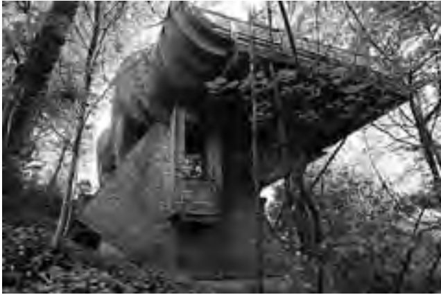
Diseñada exclusivamente, está inmersa en la naturaleza y en "sintonía musical".

Los diseños exclusivos siguen marcando las tendencias sustentables. En esta oportunidad un arquitecto dedicado a la arquitectura orgánica se encargó de llevar adelante este proyecto natural. Esta casa se encuentra en Portland, Oregón, Estados Unidos y la construcción le llevó siete años. Comenzó en 1997 y finalizó en 2004. La idea le pertenece al arquitecto Robert Harvey Oshatz. Rodeada de la naturaleza y la tranquilidad que se respira en ese lugar la hace idónea para escapar del estrés que produce la ciudad y volver al "hábitat natural".