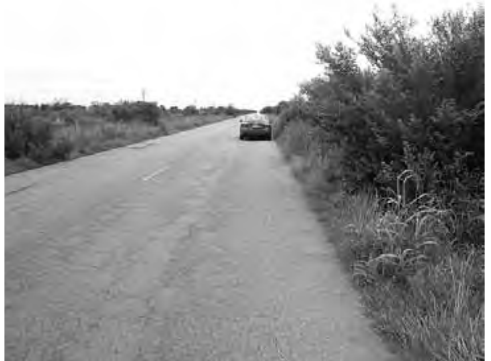
Ruta 70: Hasta el presente nada se ha hecho, lo que sí sabemos que la falta de seguridad vial sobre esa vía de comunicación es grave y observamos que quienes se tienen que ocupar no se ocupan, quienes en alguna oportunidad le pusieron ímpetu y tiempo de sus vidas, evidentemente han bajado los brazos.