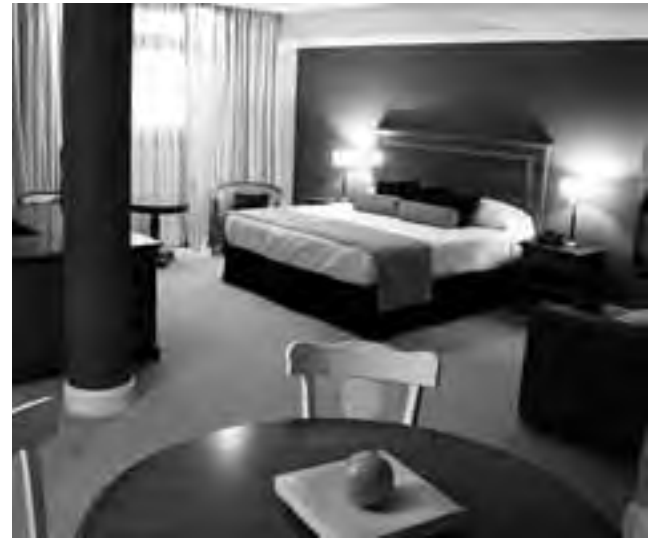
En cada cuarto hay que elegir un mueble que será el destacado, y a partir de él se pueden armar distintas combinaciones, ya sean haciendo juego o contrastando (una tendencia que viene creciendo: los ambientes eclécticos).

En las habitaciones, la cama debe ir de manera que la luz de la ventana no moleste (se pueden usar black outs), pero tampoco es bueno perder la vista si es buena. Las cortinas acá juegan un rol fun-