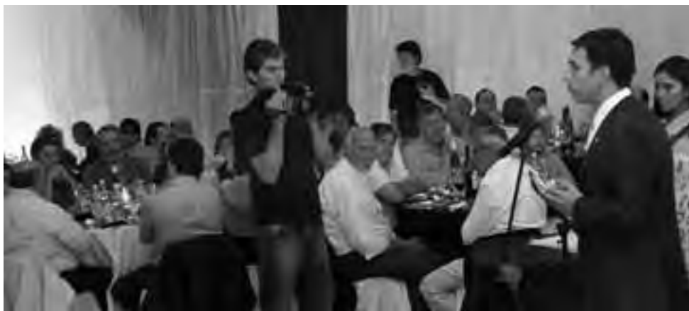
El sábado 10 de marzo a partir de las 19:30 hs. será el lanzamiento oficial de la "Temporada de Brama 2012 en La Pampa del Ciervo Colorado", en la Escuela N° 32 de Quehué, donde técnicos de la Secretaría de Turismo y de la Dirección de Recursos Naturales, darán charlas y expondrán sobre el tema. A las 22 hs. del mismo día, se desarrollará en el Club Juventud Unida la "18ª Fiesta Pampeana de la Caza Mayor" con una Gran Cena Regional, cañilla libre, con elección de la Reina de la Caza más shows y baile. La noche será animada por Tomás Vazquez, La Yesca Malambo y Los Gigantes del Ritmo.

A su vez, se programó el lanzamiento de la Temporada de Brama