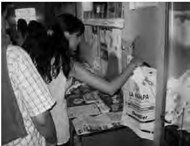
Recordamos que desde el 21 hasta el 25 de febrero, la Secretaría ha participado, con material promocional, en la Fiesta del Sol de San Juan en forma conjunta con el Ministerio de Turismo de Nación.

Los mismos deberán estar con 5 días de anticipación a la fiesta y el precio por medición es muy accesible: $ 50 para todas las especies de ciervos y jabalíes. También se recomienda reservar con tiempo la tarjeta para la Gran Cena Regional, con elección de la Reina y Shows, que tiene un valor de $ 120. Informes: (029522) 49-9008 y (029549) 1555-6850 / 1554-5570 - ciervosquehue@yahoo.com.ar - hospedajequehue@gmail.com