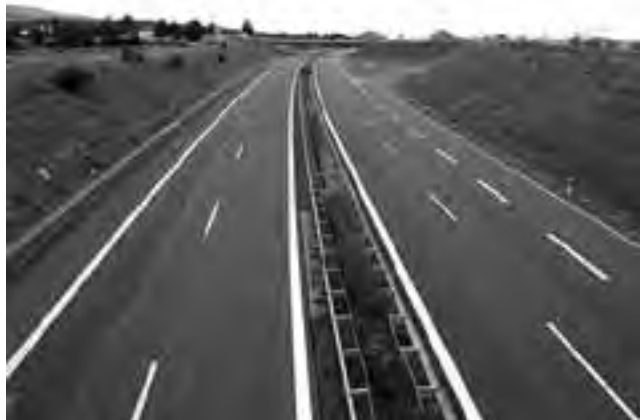
Autovía Huelva-Badajoz en España, un ejemplo de como podría llegar a ser.

Según explicaron durante una de las varias presentaciones del proyecto "Autovía Ruta 5 Ya", realizada en la sede del Distrito Centro de UnLPa en Santa Rosa, este reclamo propone agregar un carril más de cada lado de la Ruta Nacional N° 5, entre Luján y Santa Rosa, con el fin de disminuir la gran cantidad de accidentes que ocurren en la misma. Se diferenciaría así de una "autopista", que es una obra más cara y compleja.