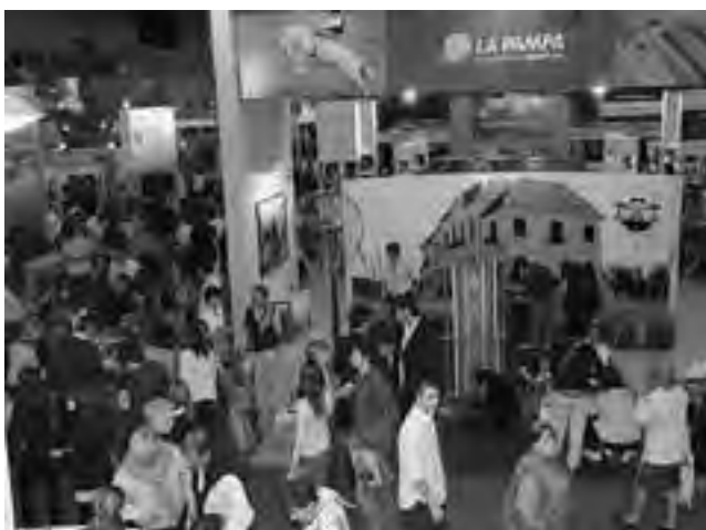
Stand de La Pampa en "Expo Patagonia 2010".

Nuevamente la Gastronomía Argentina adquiere un especial protagonismo en Expo Patagonia 2011, que se desarrolla del 23 al 25 de septiembre y exhibe la oferta y los atractivos turísticos de La Pampa, Neuquén, Río Negro, Chubut, Santa Cruz y Tierra del Fuego. La Federación Empresaria Hotelera Gastronómica de la República Argentina (FEHGRA) presenta las "Clases Magistrales de Cocina Patagónica", que están a cargo de reconocidos especialistas. Desde los últimos años, el Ente Patagonia Argentina, organizadora de Expo Patagonia, y FEHGRA vienen trabajando en conjunto para fortalecer por medio de distintas acciones la identidad gastronómica regional y promover -a través de este recurso- a la actividad hotelera, gastronómica y turística argentina.