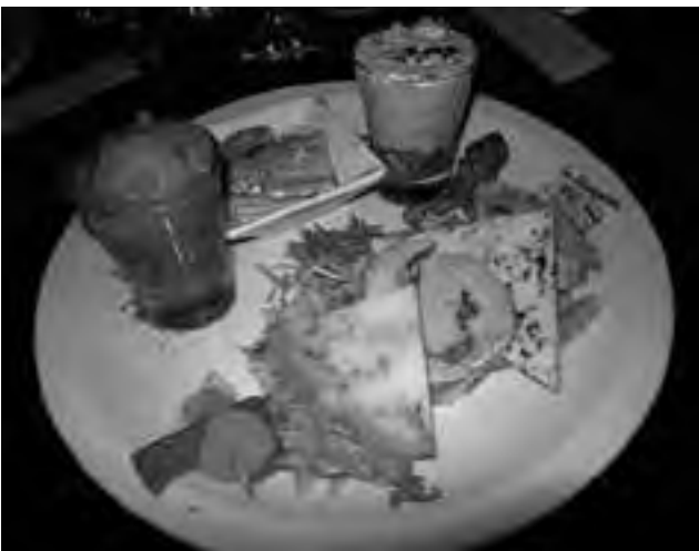
Como no podía ser de otra manera, un exquisito menú y buen espectáculo acompañará a la gran Cena Show del Turismo en La Pampa.

Como si esto fuera poco, entre sábado y domingo se desarrollará un “Torneo de Pato de Picadero”.