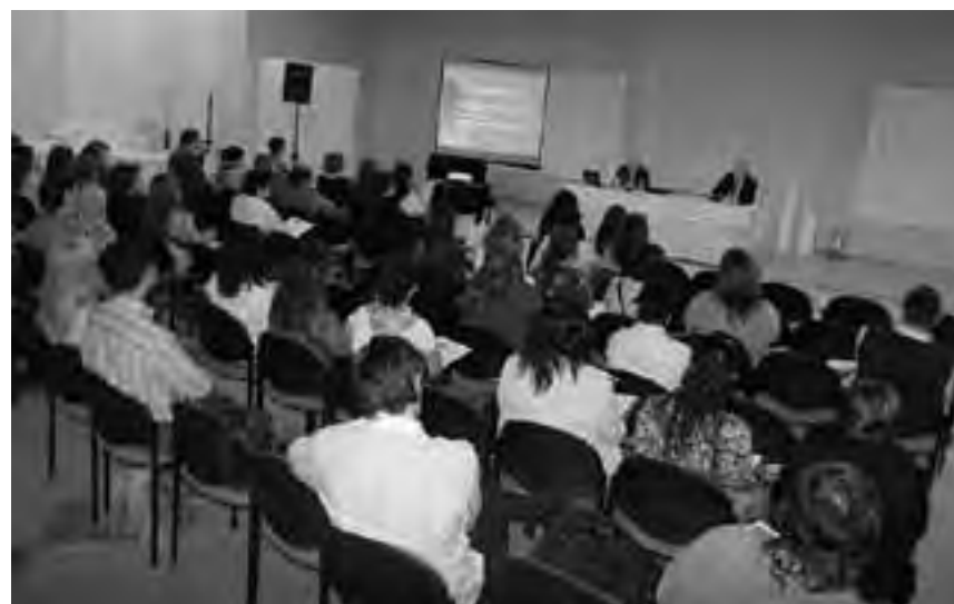
La Asociación es permanente sede de consulta de toda índole por los concesionarios de automóviles, en temas legales, impositivos, registrales, incluso laborales y ahora también a nivel informático.