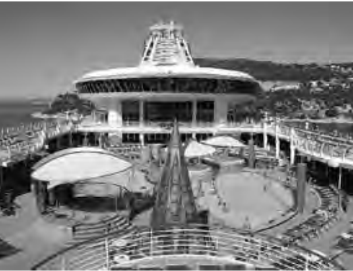
Con los transatlánticos del Grand Celebration, la empresa "Ibero Cruceros" propone para sus salidas, pagar la mitad y disfrutar el doble.

DE TAPA El 26 de noviembre el Grand Celebration, de 26 toneladas y capacidad para 1.896 pasajeros, iniciará su cruceo Barcelona - Buenos Aires mientras se desplaza hacia Montevideo para iniciar su temporada en Suramérica. Serán 18 días de navegación visitando Casablanca, Santa Cruz de Tenerife, Río de Janeiro, Salvador, Ilhéus, Río de Janeiro y antes de arribar a Buenos Aires. El costo para el primer pasajero es de U$S 2.913 y el segundo, viajando en el camarote interno, abona U$S 730 (consulte con su Agencia de Viajes).